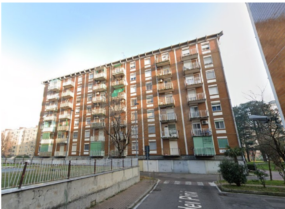
Foto 1 – Vista della facciata del fabbricato di via dei Pini 1-3-5.