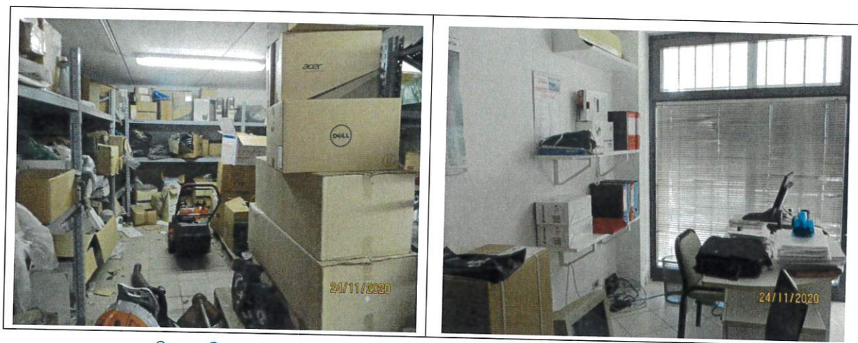
Corpo G cantina