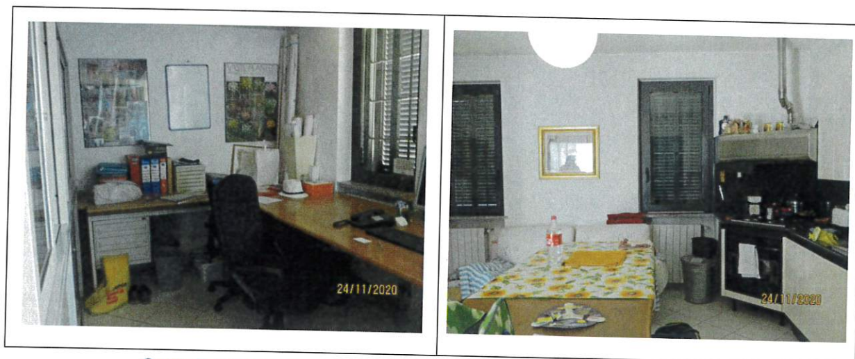
Corpo G piano terra