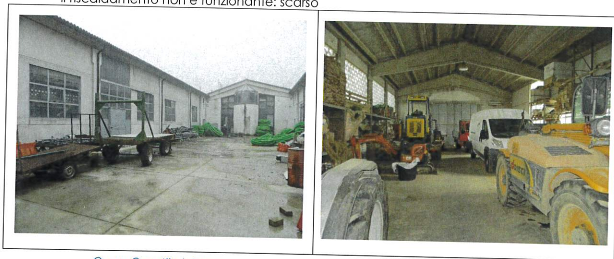
Corpo C cortile interno