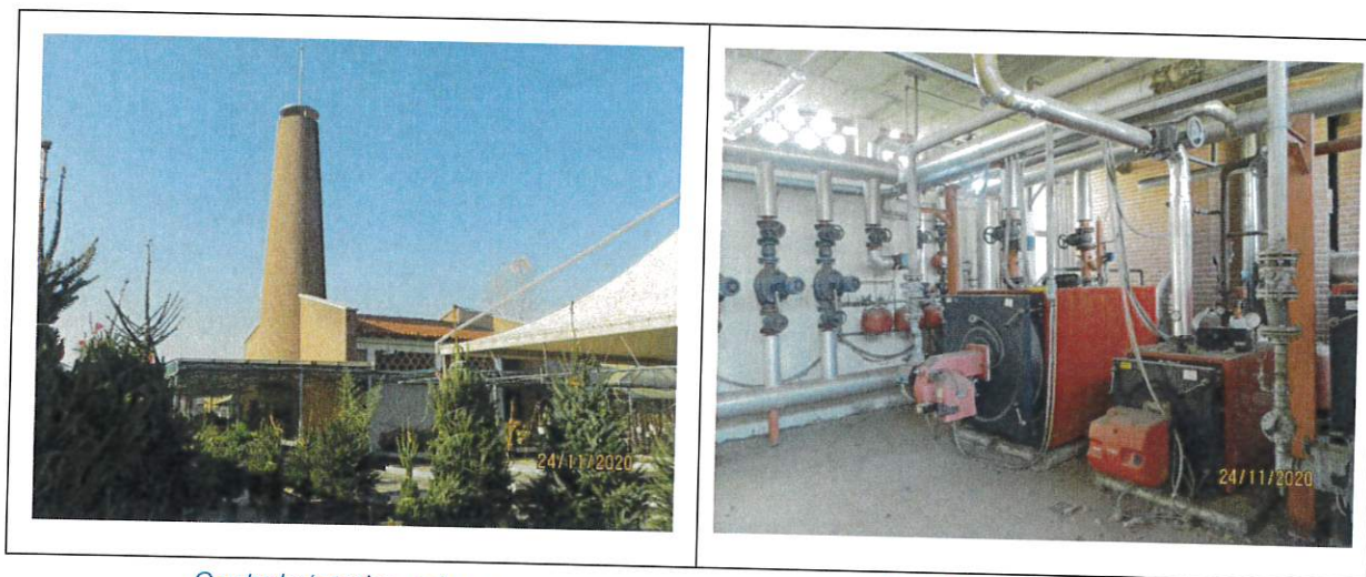
Centrale termica esterno