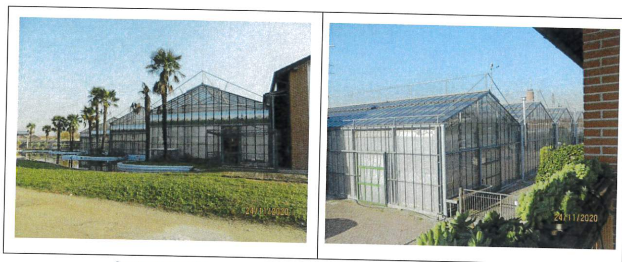
Serre e laghetto