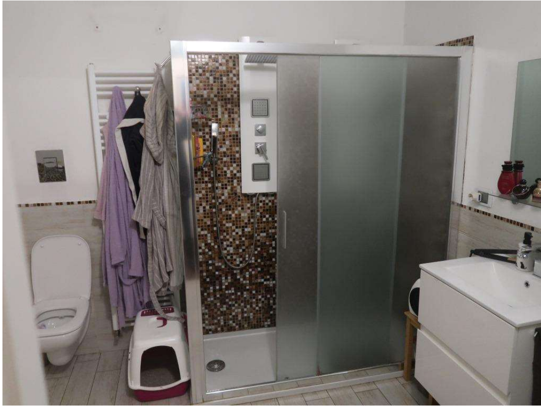
BAGNO FOTO 2