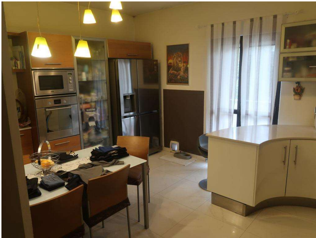
CUCINA FOTO 1