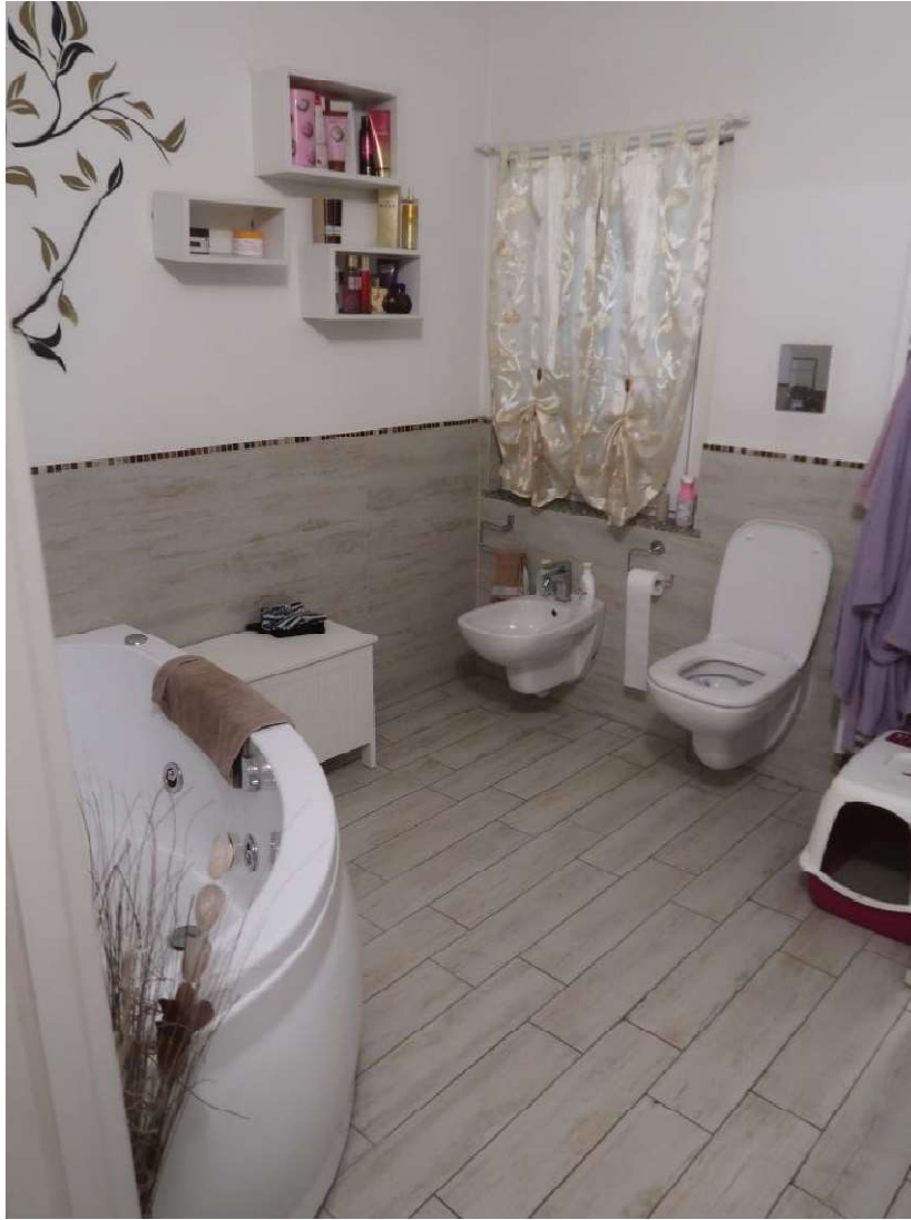
BAGNO FOTO 1