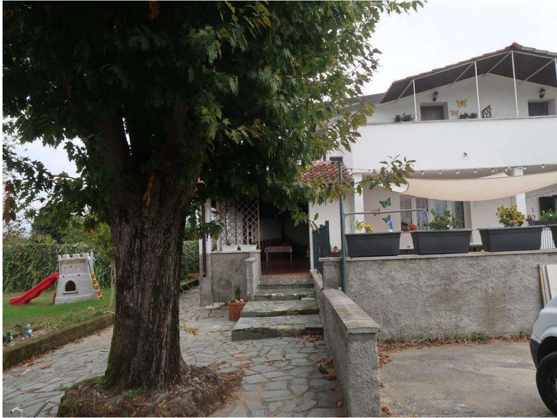
INGRESSO DAL PORTICO