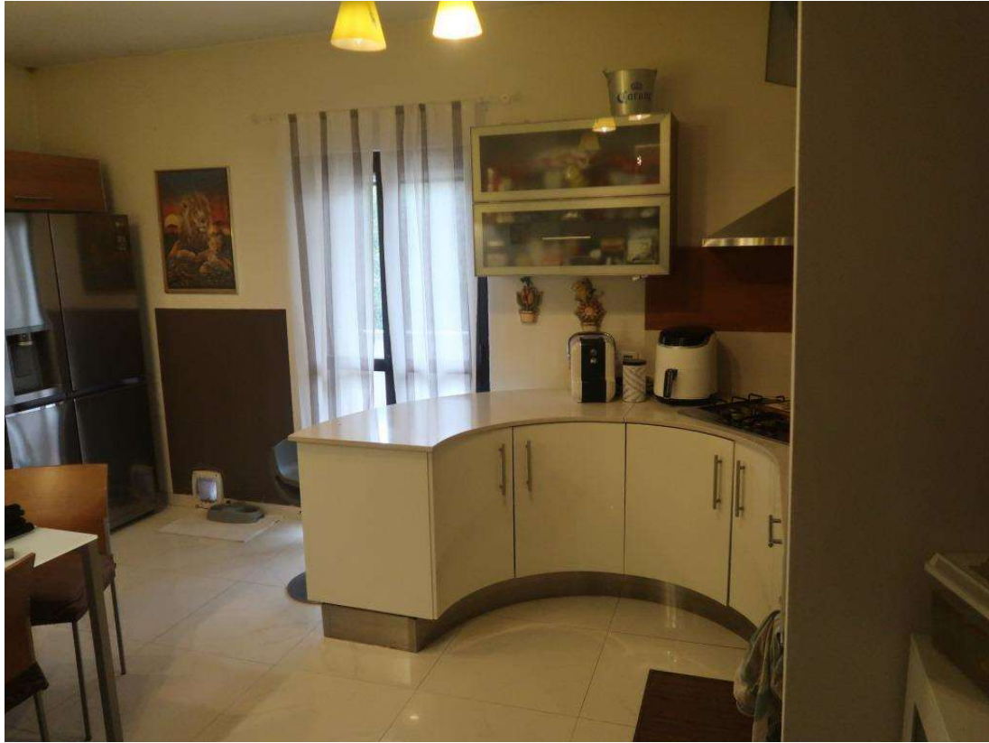
CUCINA FOTO 2