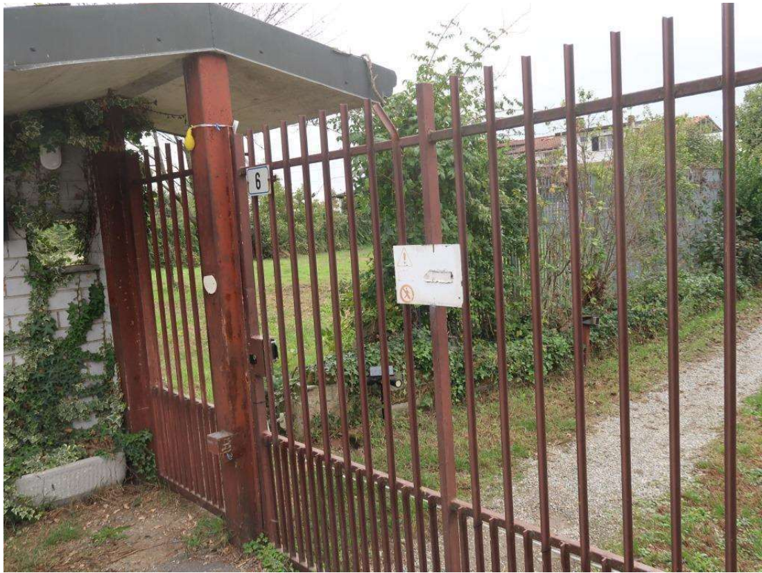
SERVITU' CARRAIA E PEDONALE PER ACCESSO ALLA PROPRIETA'