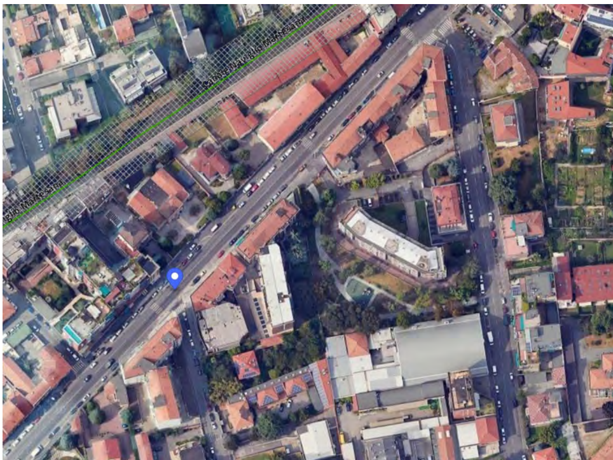
Inquadramento territoriale - vista dell'area e individuazione fabbricato e accesso