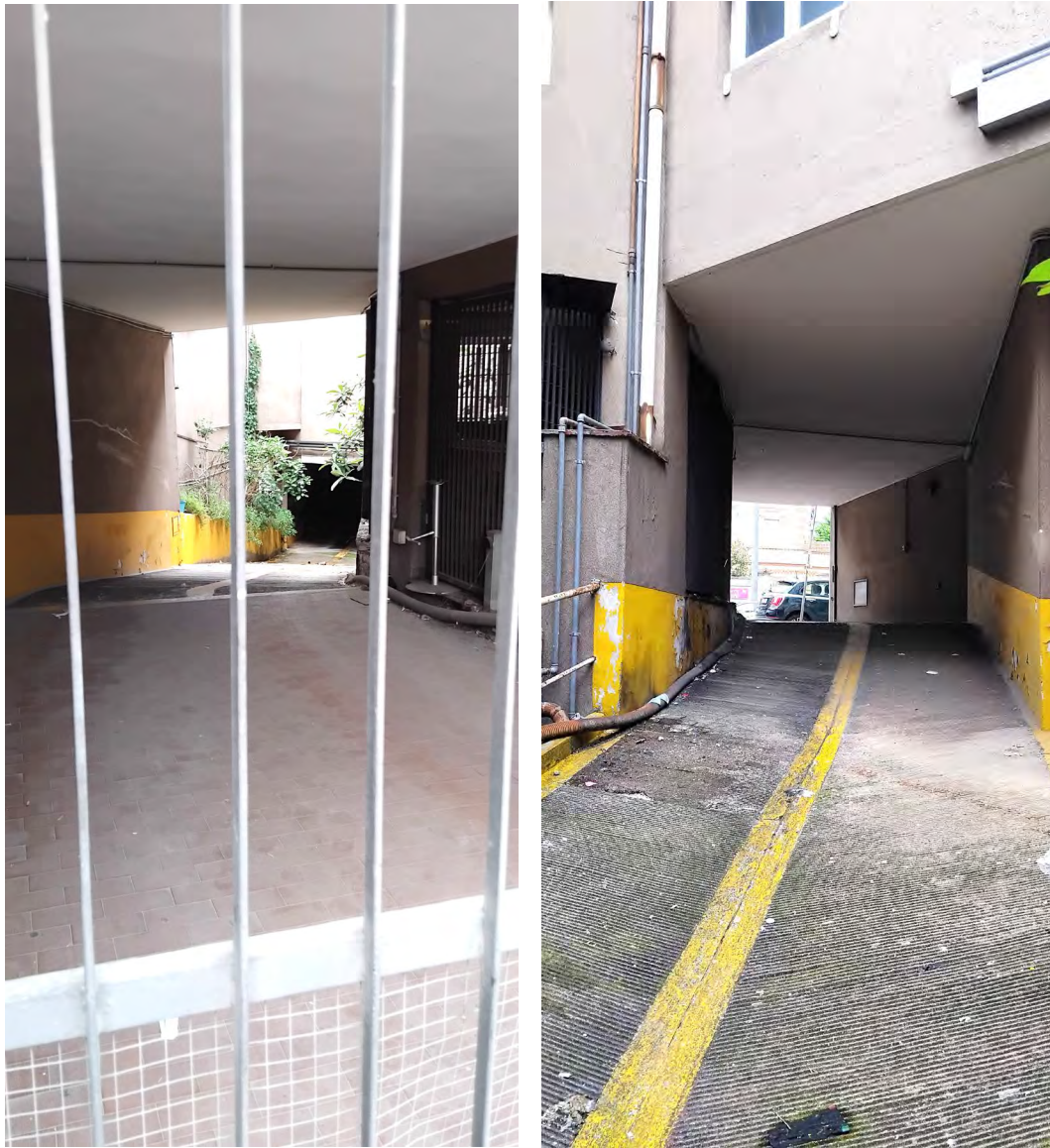
Rampa accesso piano interrato via Padova