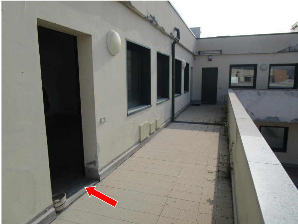
Foto 4 – Indicazione dell'ingresso alla porzione A dell'unità immobiliare sub 719