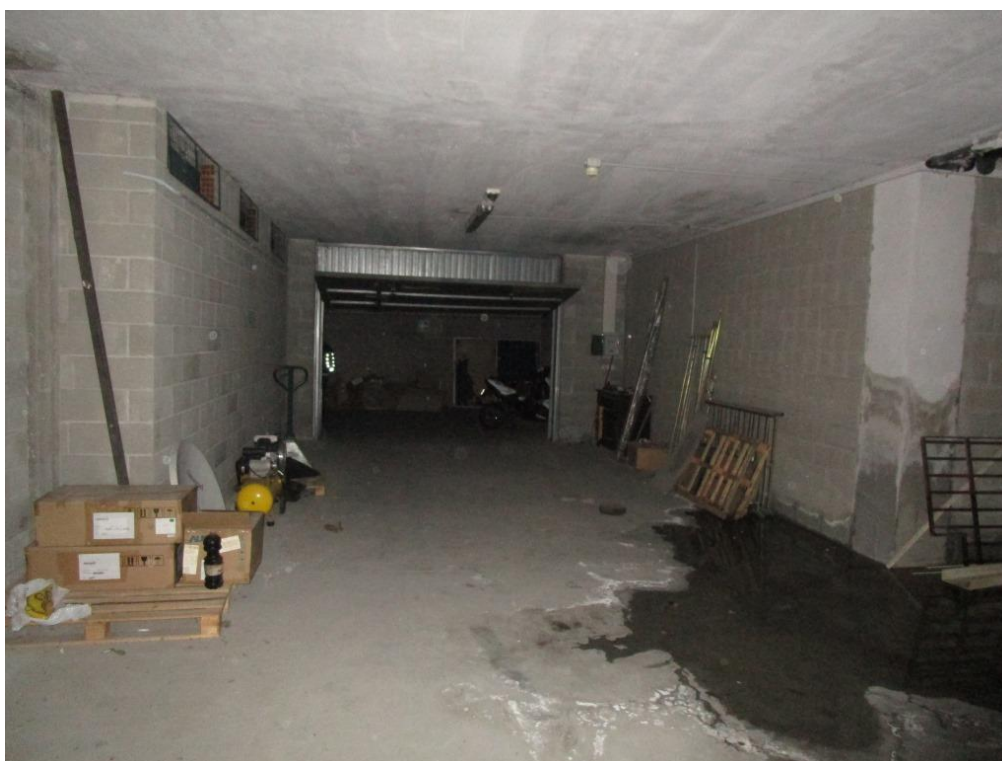
Foto 9 – Vista del deposito sub 724 (porzione B) verso l'ingresso