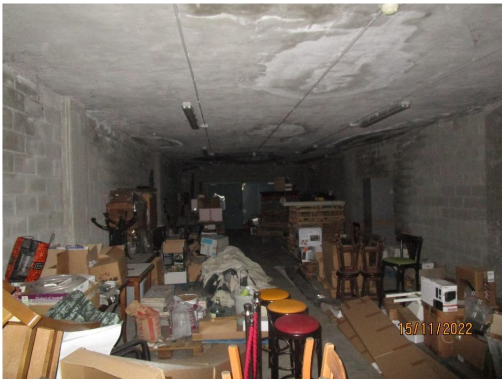
Foto 9 - Deposito