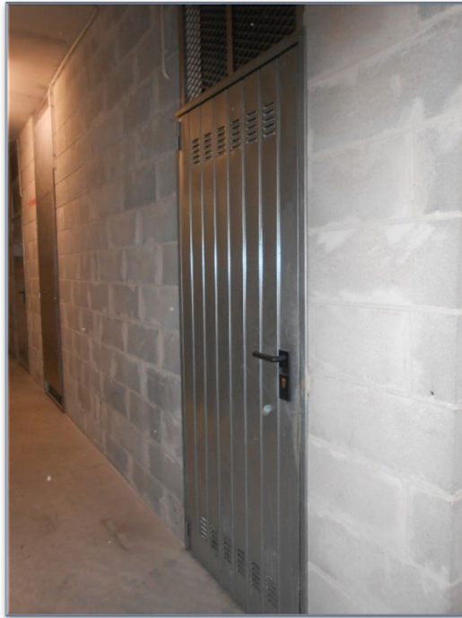
Foto 23 porta ingresso cantina