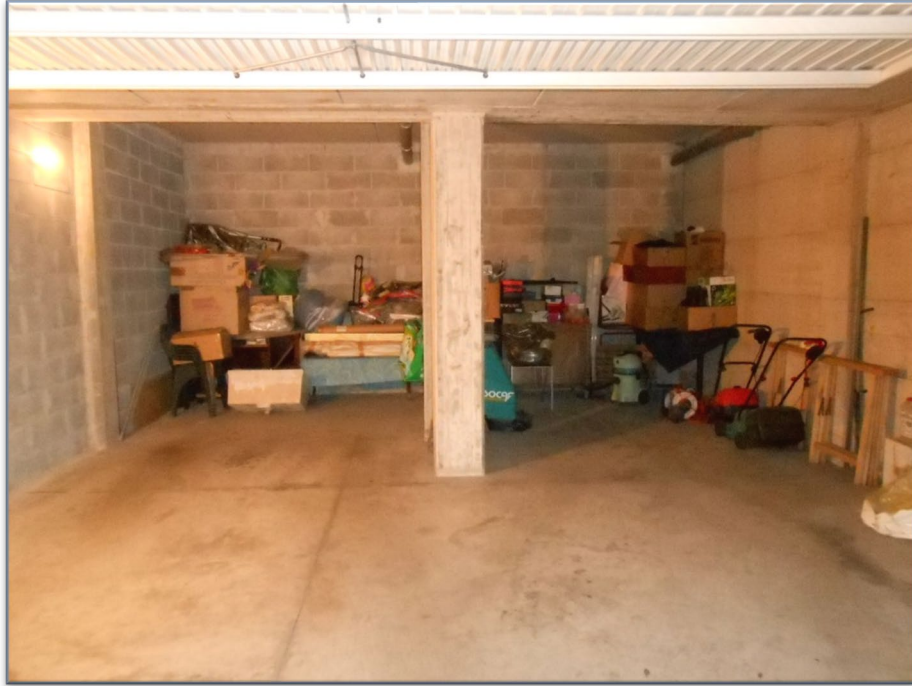
Foto 29 box