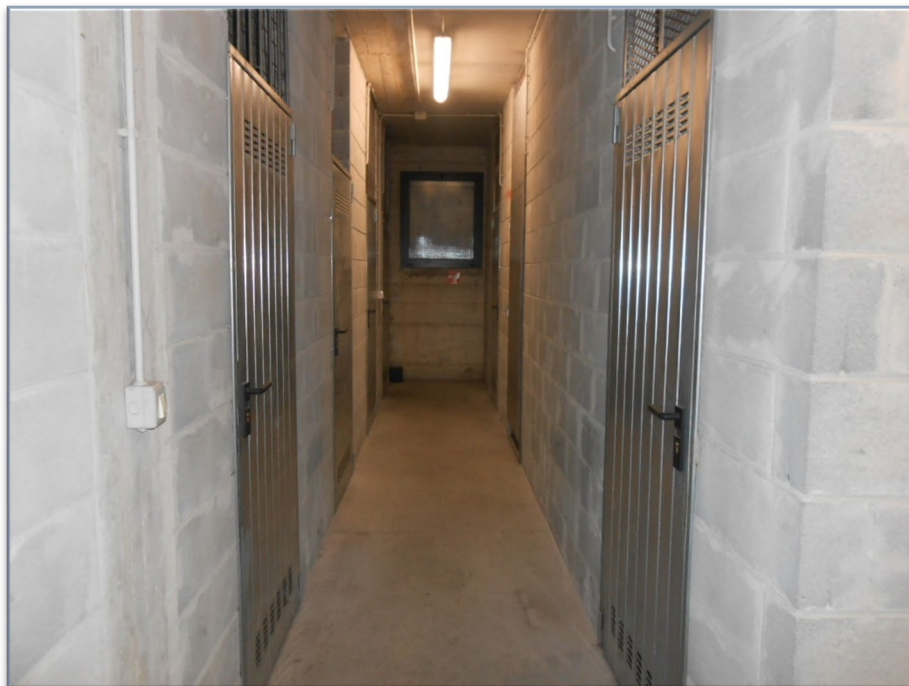
Foto 22 parti comune cantine