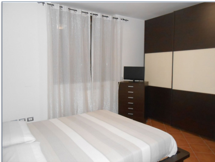
Foto 16 camera matrimoniale