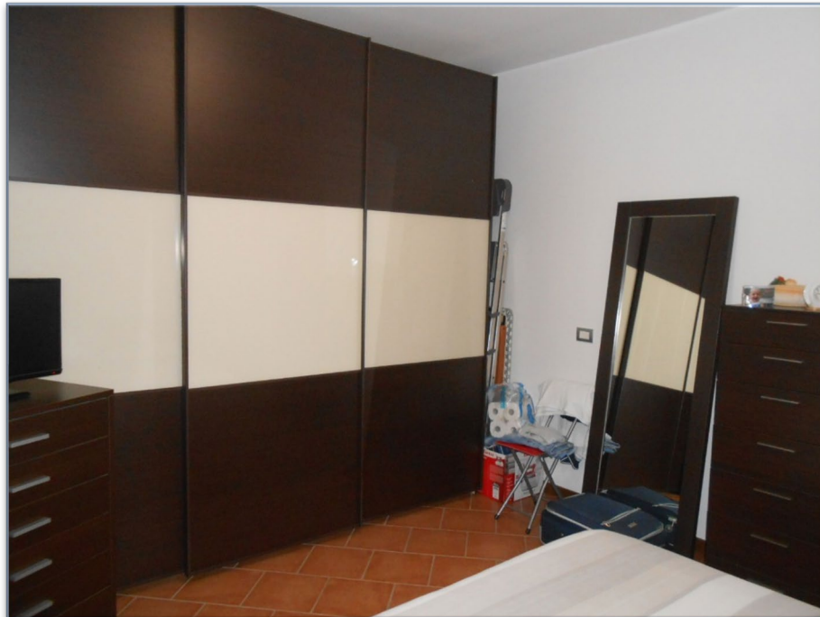
Foto 17 camera matrimoniale