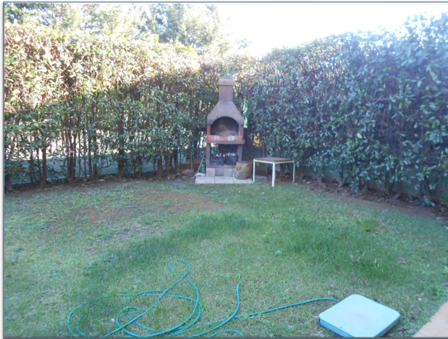
Foto 21 giardino