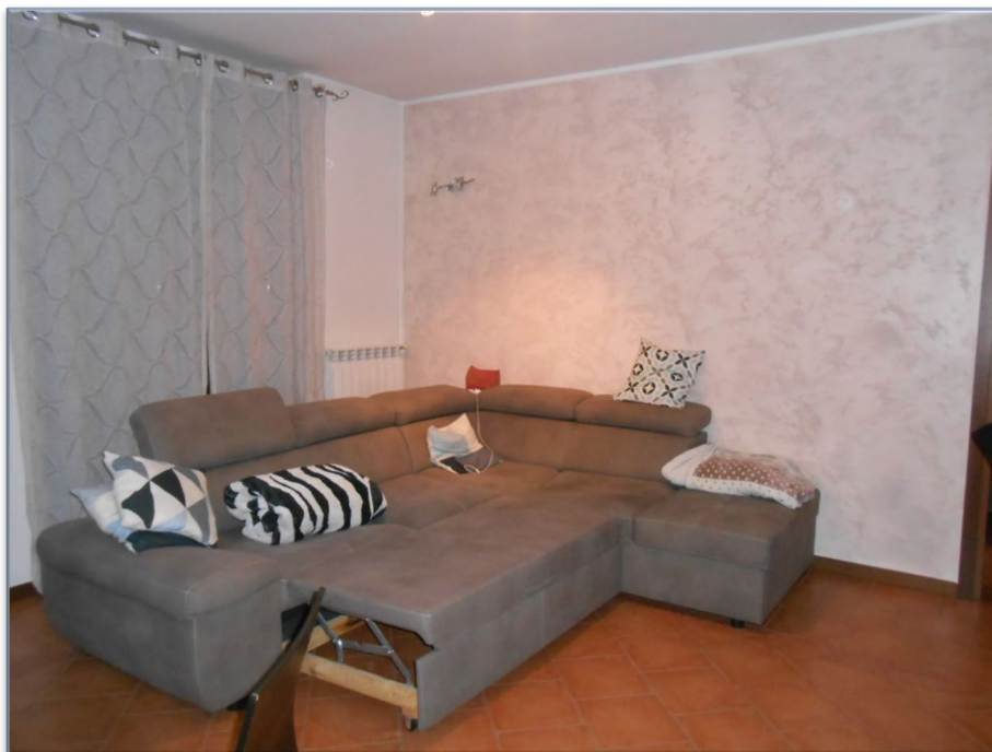
Foto 8 soggiorno