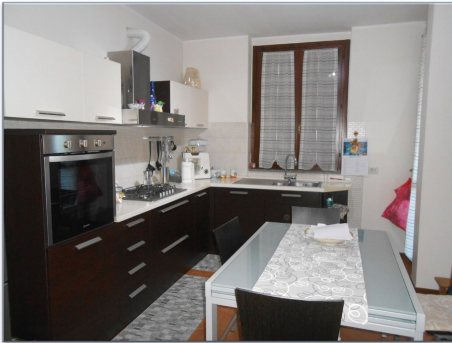
Foto 9 angolo cottura