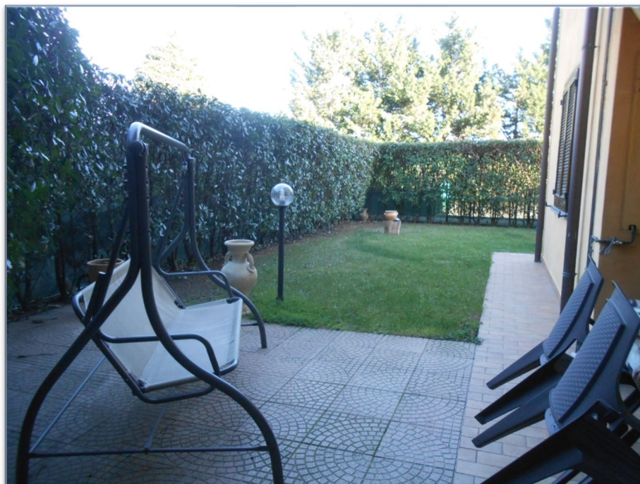
Foto 18 portico