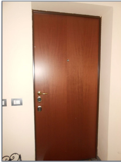
Foto 5 porta ingresso all'appartamento