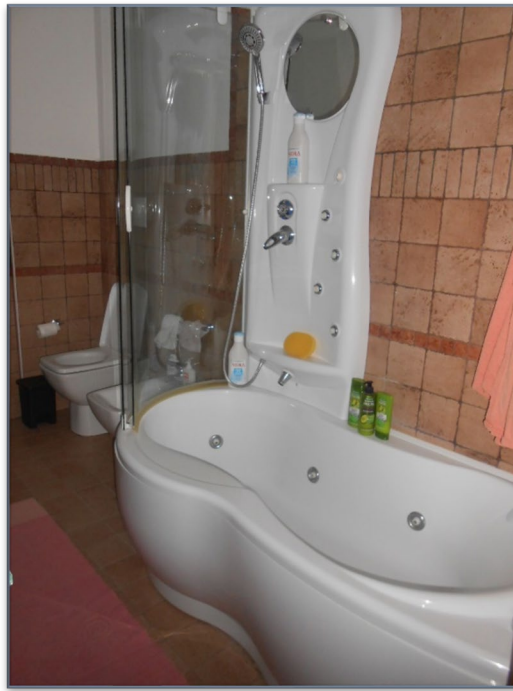
Foto 13 bagno