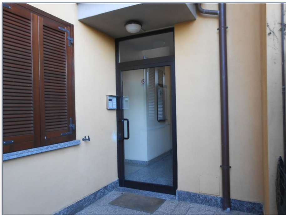
Foto 2 porta ingresso al condominio