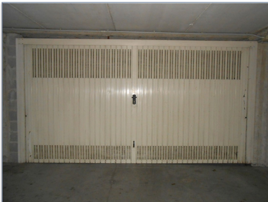
Foto 28 box