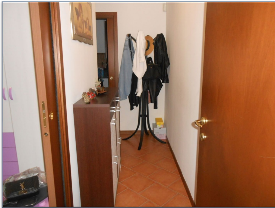
Foto 11 disimpegno