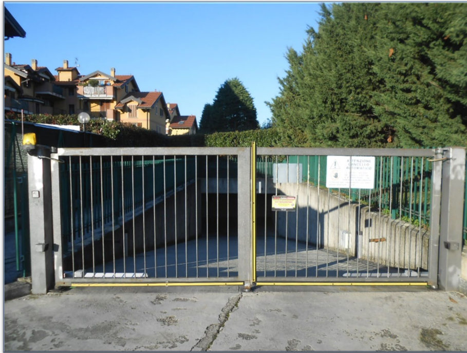
Foto 25 cancello di accesso ai box