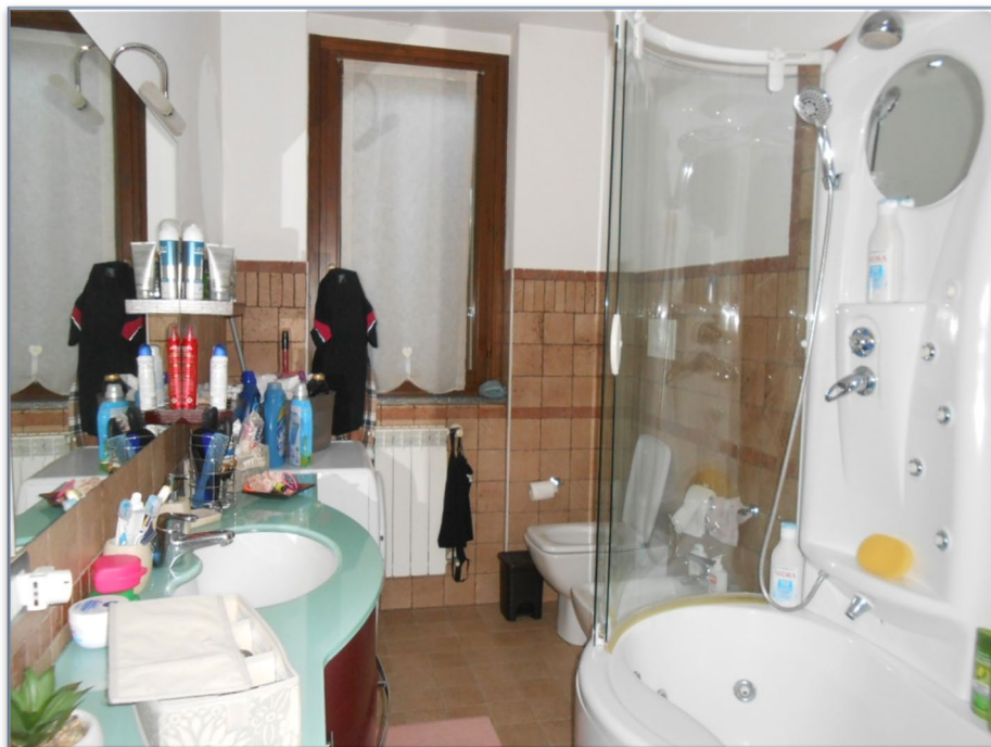
Foto 12 bagno