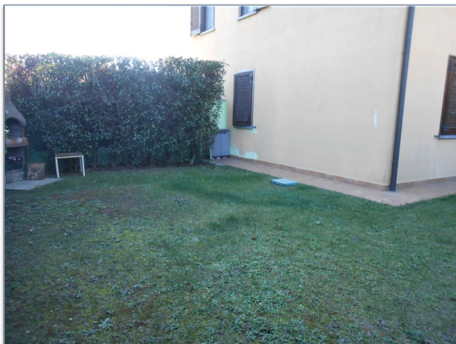
Foto 20 giardino