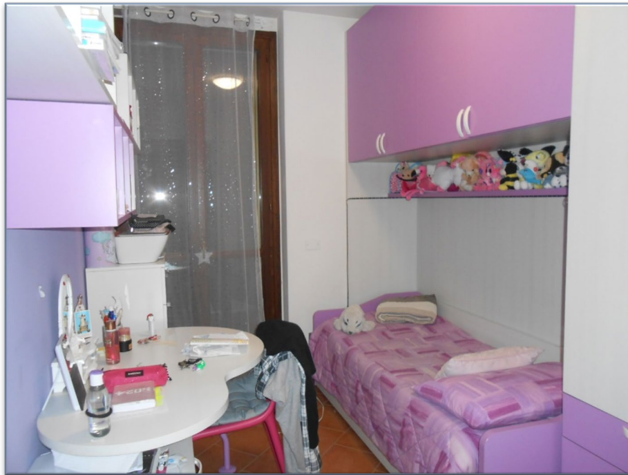
Foto 15 camera/studio