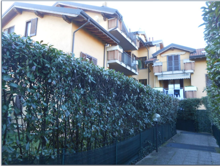
Foto 1 vista del condominio