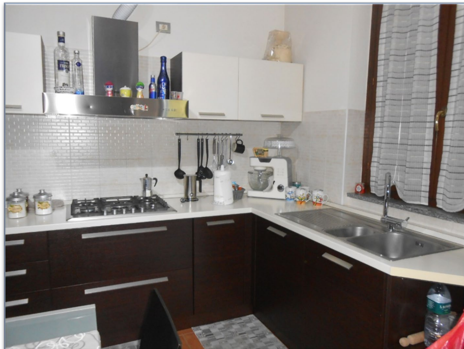
Foto 10 angolo cottura