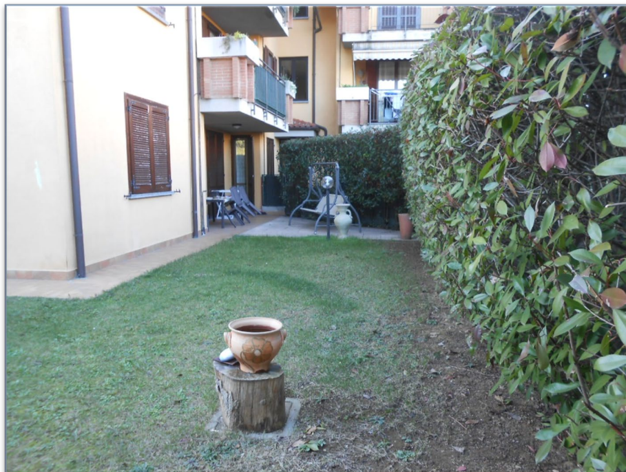
Foto 19 giardino