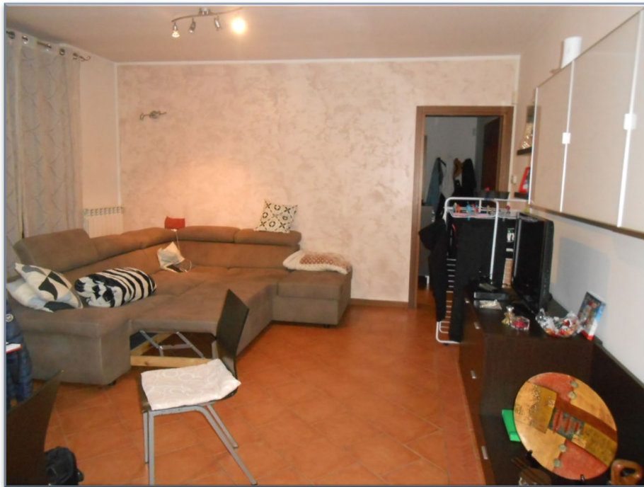
Foto 7 soggiorno