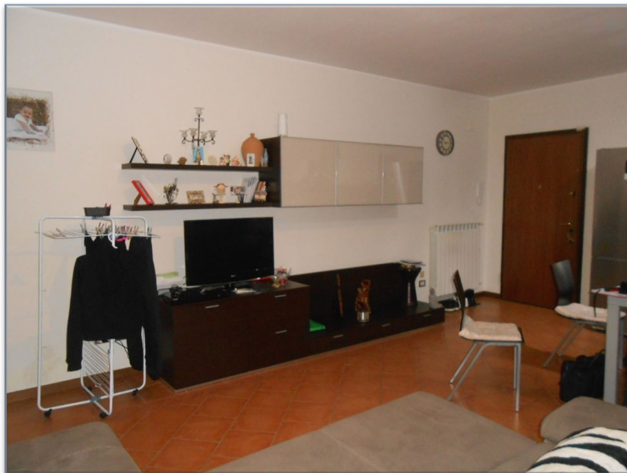
Foto 6 ingresso/soggiorno