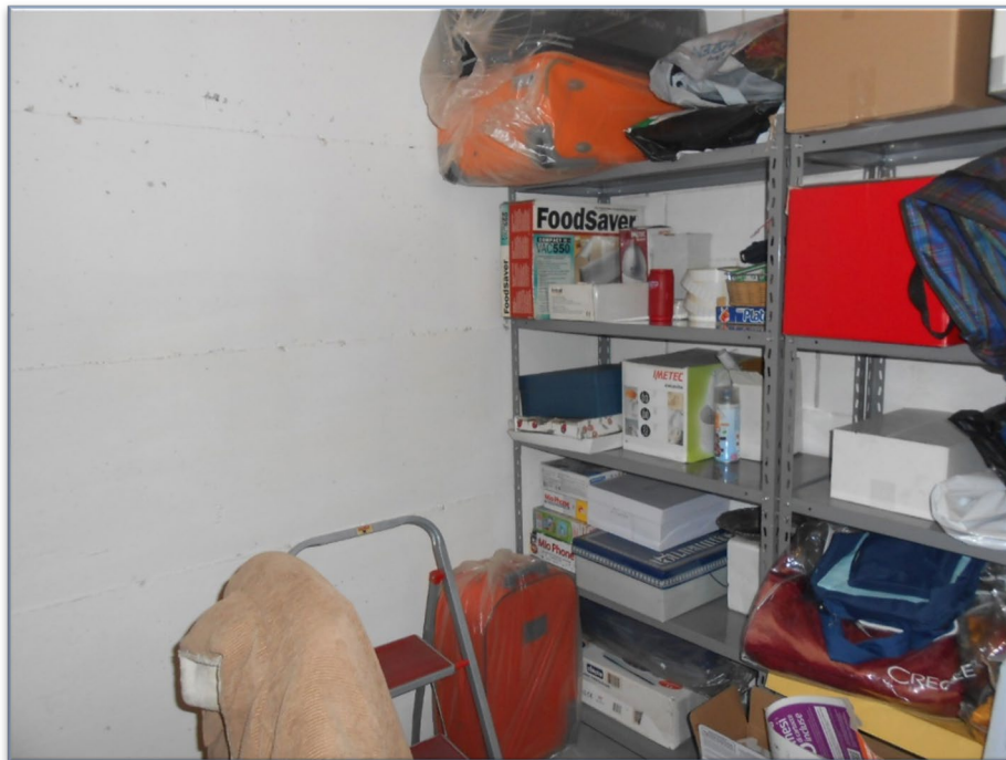
Foto 24 cantina