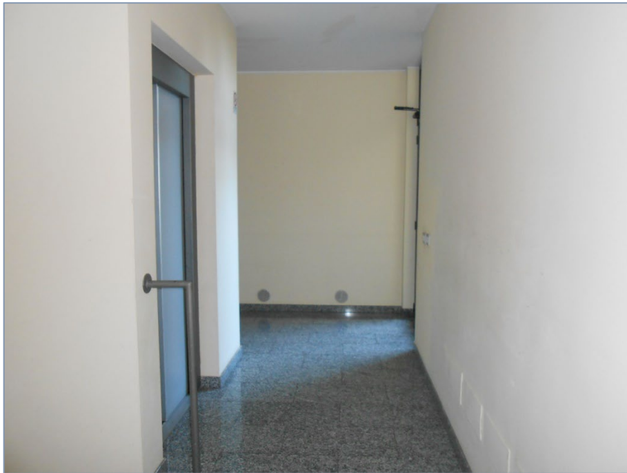
Foto 3 parti comuni