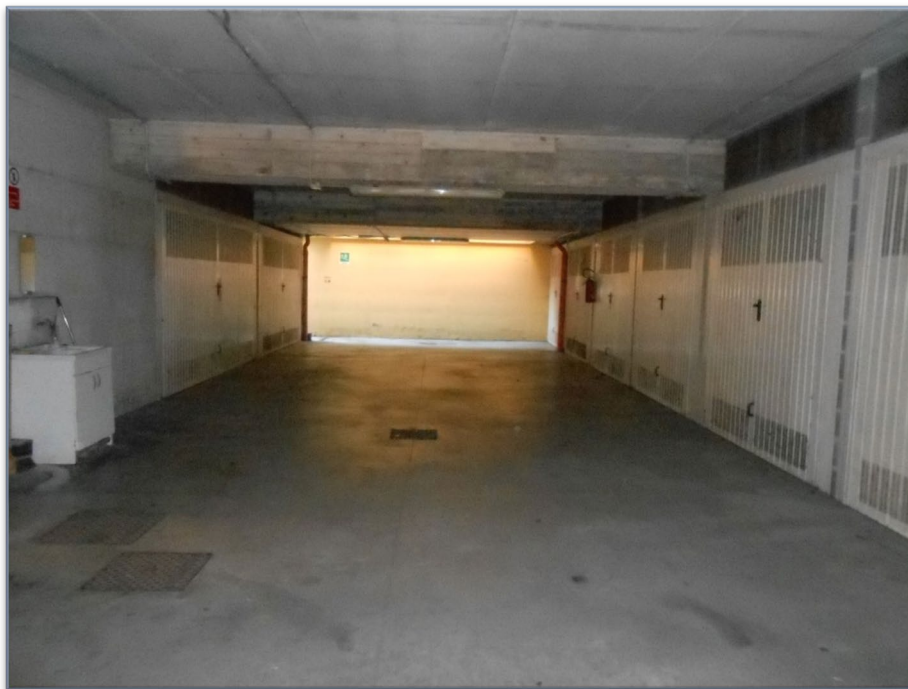
Foto 27 parti comuni