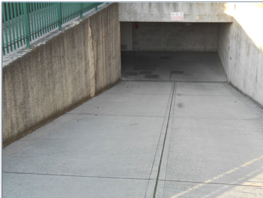
Foto 26 rampa