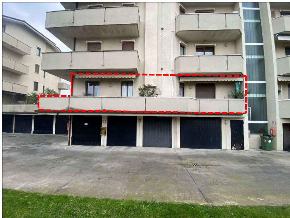
Foto n°3 – Prospetto sul cortile interno ed immobile di interesse