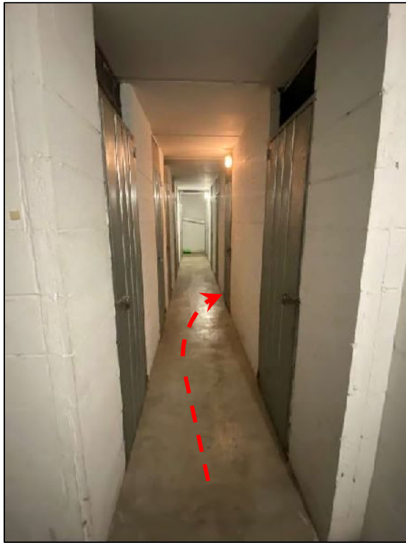
Foto n°22 – Cantina di pertinenza al piano seminterrato (Corridoio comune)