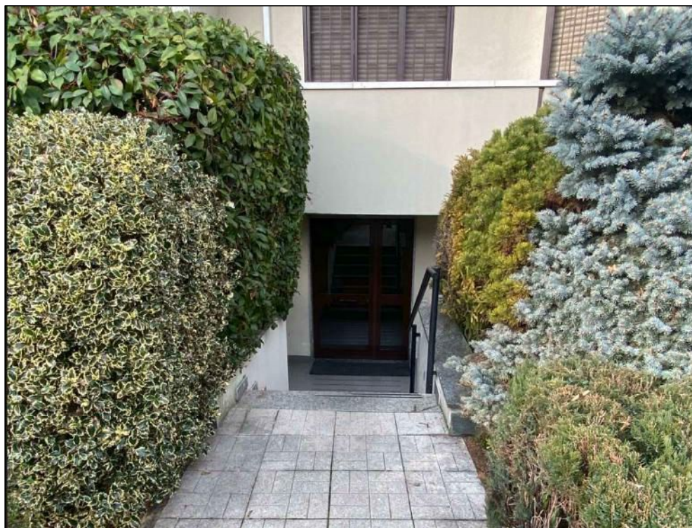
Foto n°5 – Accesso pedonale all'androne posto al piano seminterrato (si notano le barriere architettoniche)