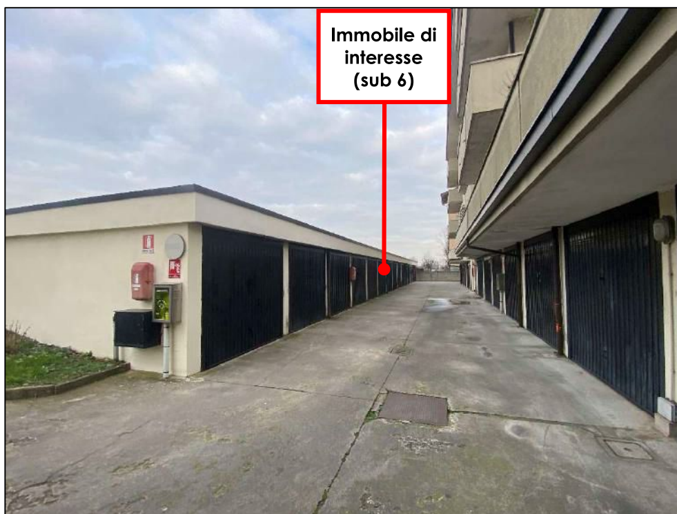
Foto n°24 – Corpo separato box auto al piano seminterrato e cortile di accesso