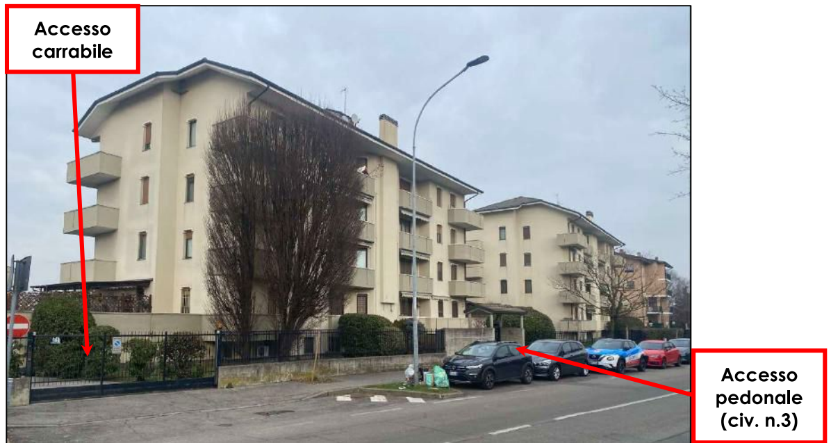
Foto n°1 - Vista prospettica del complesso di due edifici residenziali