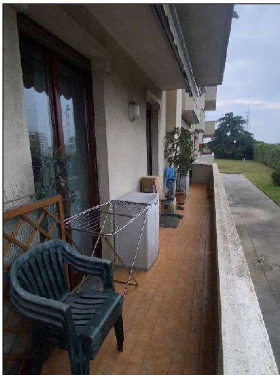
Foto n°18 – Balcone coperto soggiorno e cucina e dettaglio caldaia (2022)