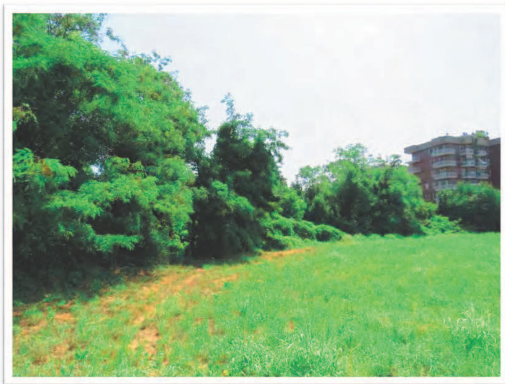
Terreni al Foglio 61 particella 190 e al Foglio 72 Particelle 10 e 66: viste da Nord.