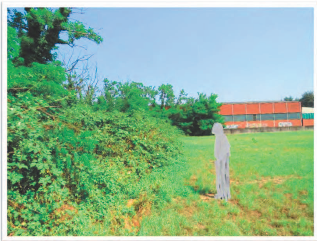
Terreno al Foglio 72 Particella 13: confine Ovest e vista da Sud-Ovest.