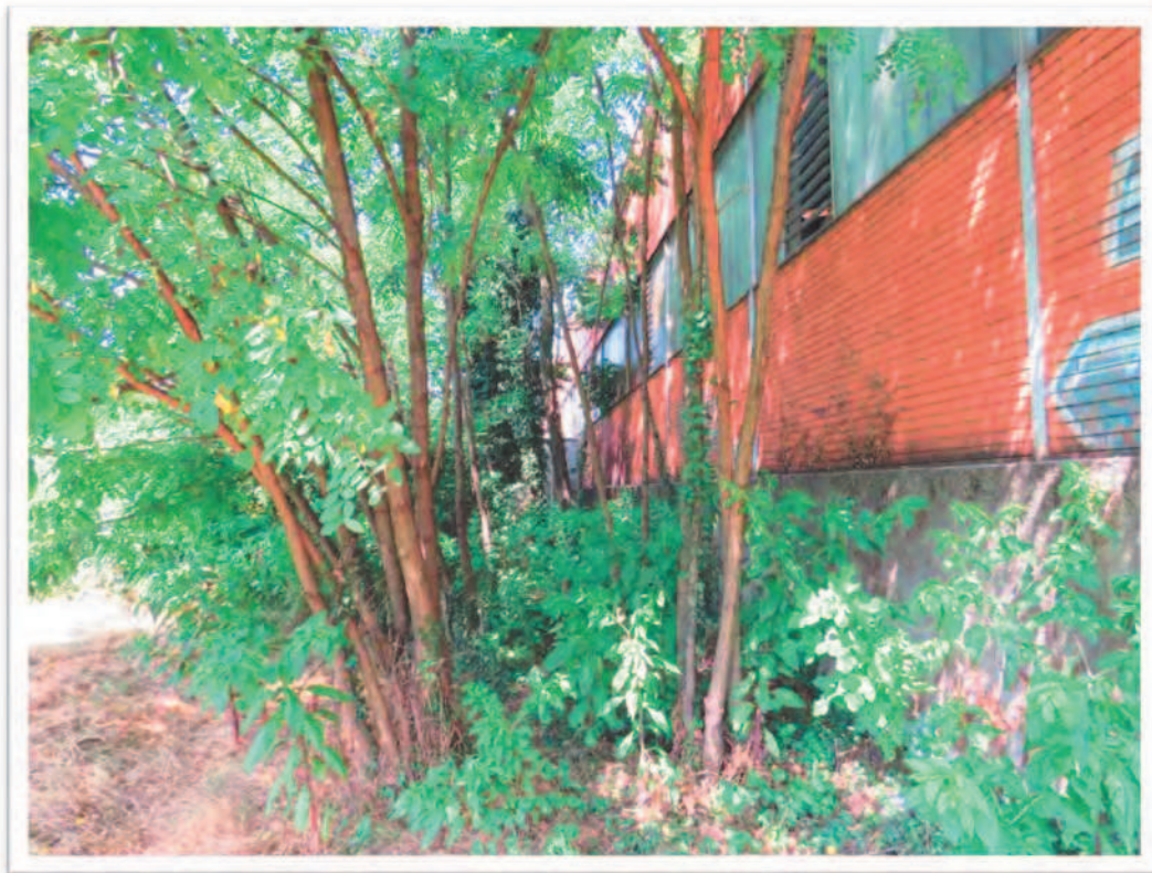
Terreno al Foglio 72 Particella 13: confine Nord.