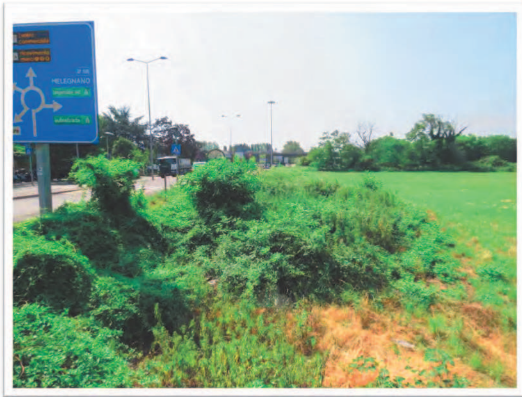
Terreno al Foglio 72 Particella 13: particolari del confine Est.