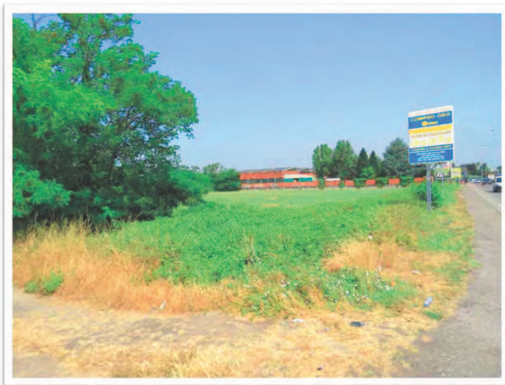
Terreno al Foglio 72 Particella 13: vista da Sud-Est e confine Sud ed Ovest.