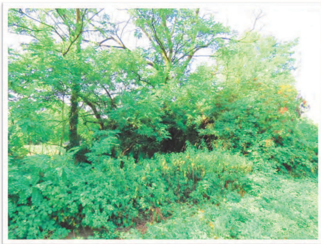
Terreno al Foglio 72 Particella 13: confine Sud e vista del confine da Sud-Est.