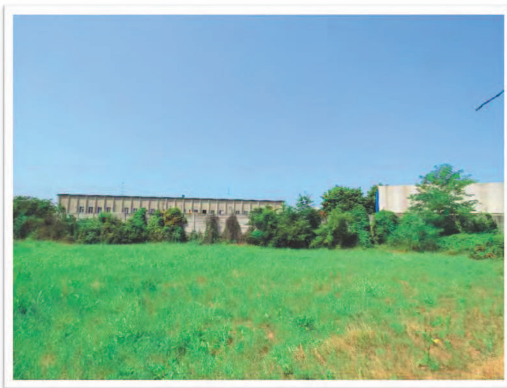
Terreni al Foglio 61 particella 190 e al Foglio 72 Particelle 10 e 66: viste da Est e da Sud.