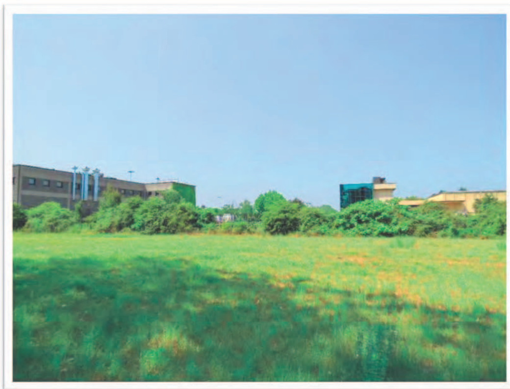
Terreni al Foglio 61 particella 190 e al Foglio 72 Particelle 10 e 66: viste da Est e da Nord-Est.