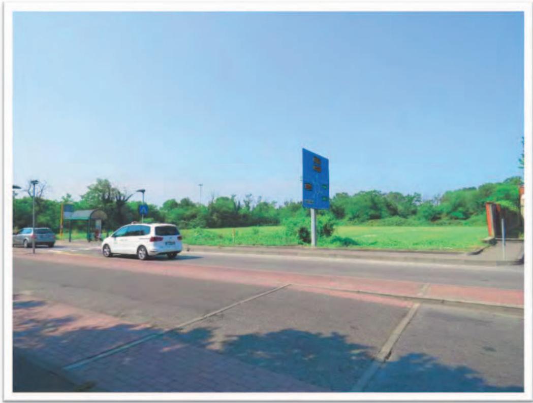
Terreno al Foglio 72 Particella 13 visti da Est.