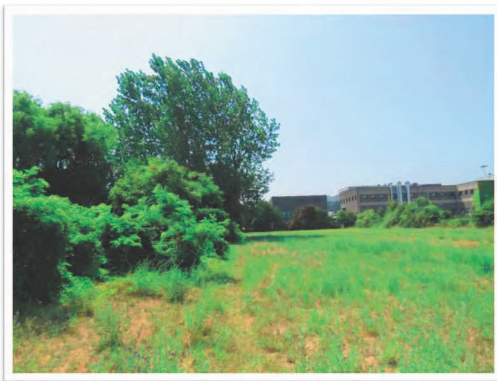
Terreni al Foglio 61 particella 190 e al Foglio 72 Particelle 10 e 66: viste da est e da Nord e da Sud.