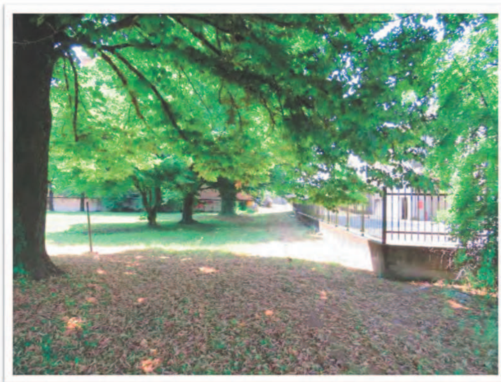
Terreni al Foglio 61 particella 190 e al Foglio 72 Particelle 10 e 66: viste da Nord e del confine Sud.