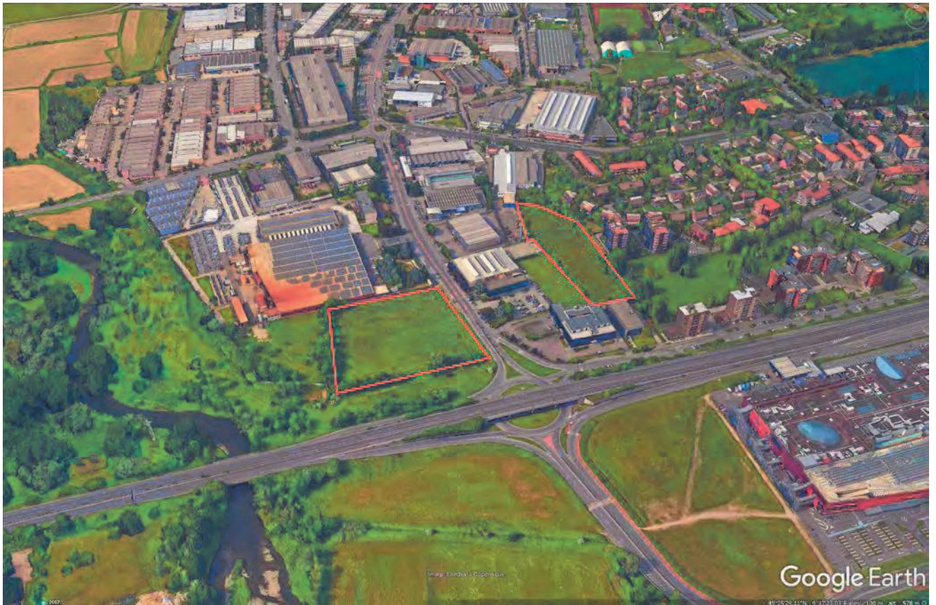
Contorno indicativo di massima dei terreni in rosso.