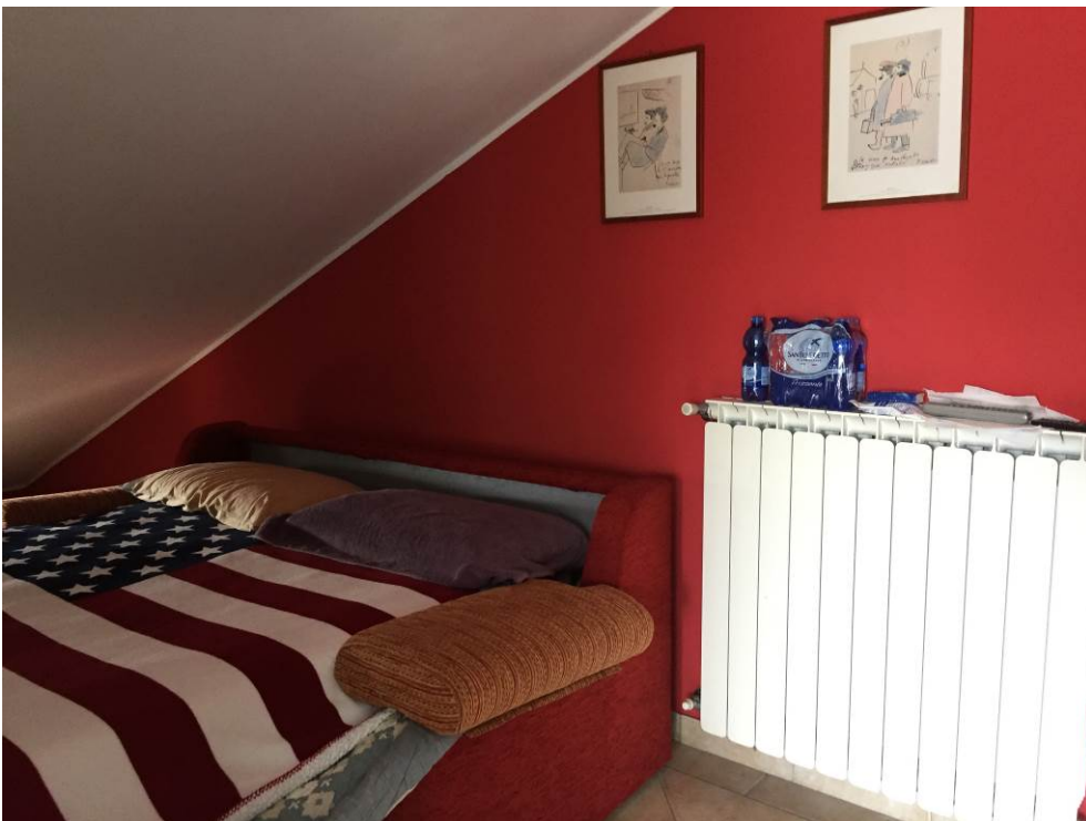
Fotografia n. 30 – PIANO SOTTOTETTO: vista dei locali di sgombero/servizio della porzione di casa di abitazione bifamiliare degli esecutati