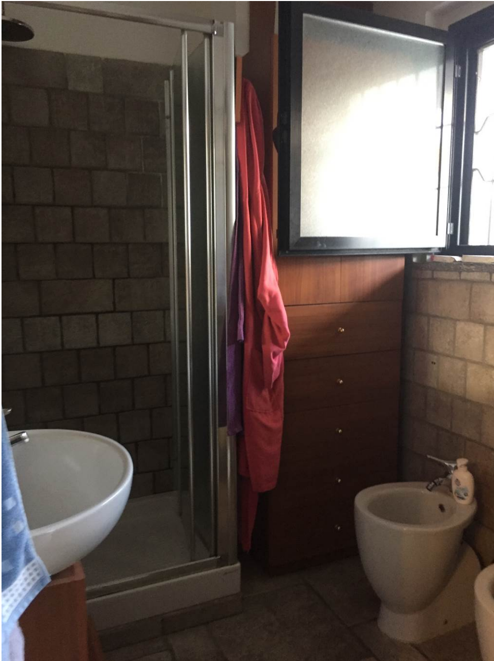
Fotografia n. 17 – PIANO INTERRATO: vista del locale bagno della porzione di casa di abitazione bifamiliare degli esecutati