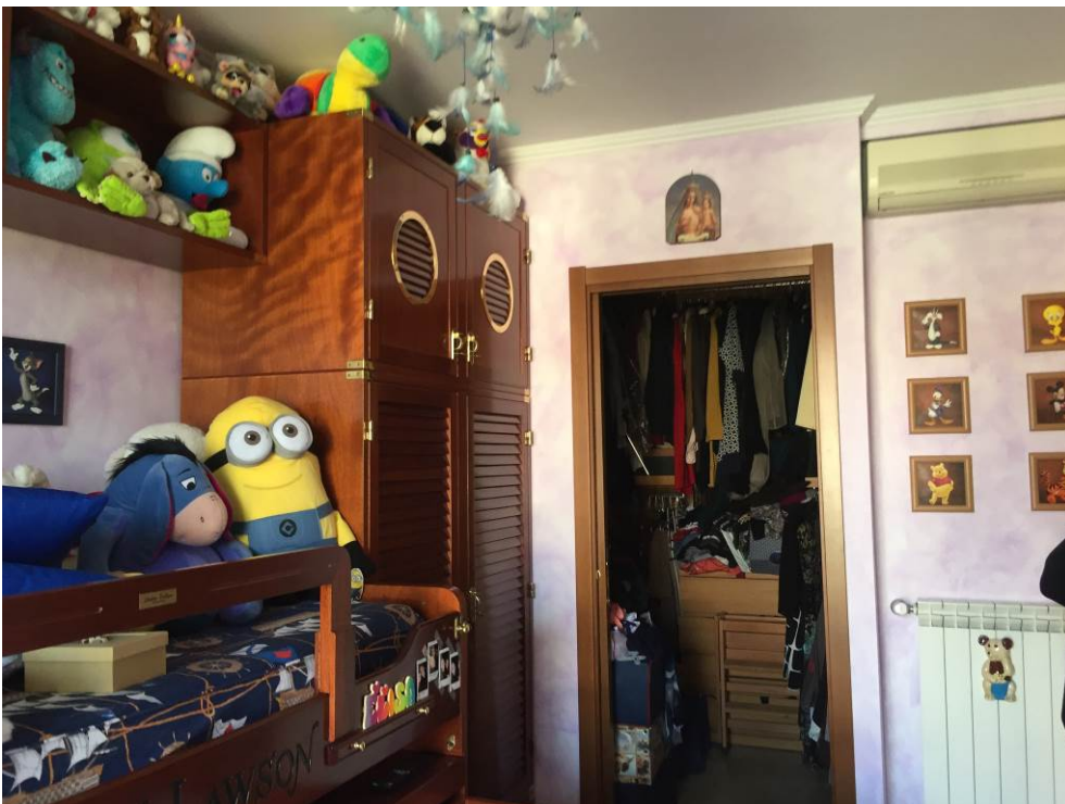
Fotografia n. 26 – PIANO PRIMO: vista del locale camera da letto della porzione di casa di abitazione bifamiliare degli esecutati