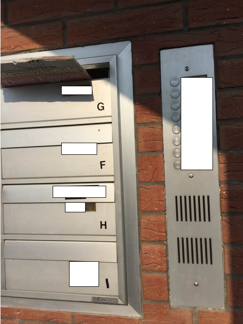
Fotografia n. 1 – Vista del muretto all’ingresso del complesso edilizio sito in Barbaiana di Lainate (Mi) - Via L. Ariosto n. 23, in cui alloggianno le caselle delle lettere ed il citofono – particolare, sulla destra, del citofono con il nominativo degli esecutati