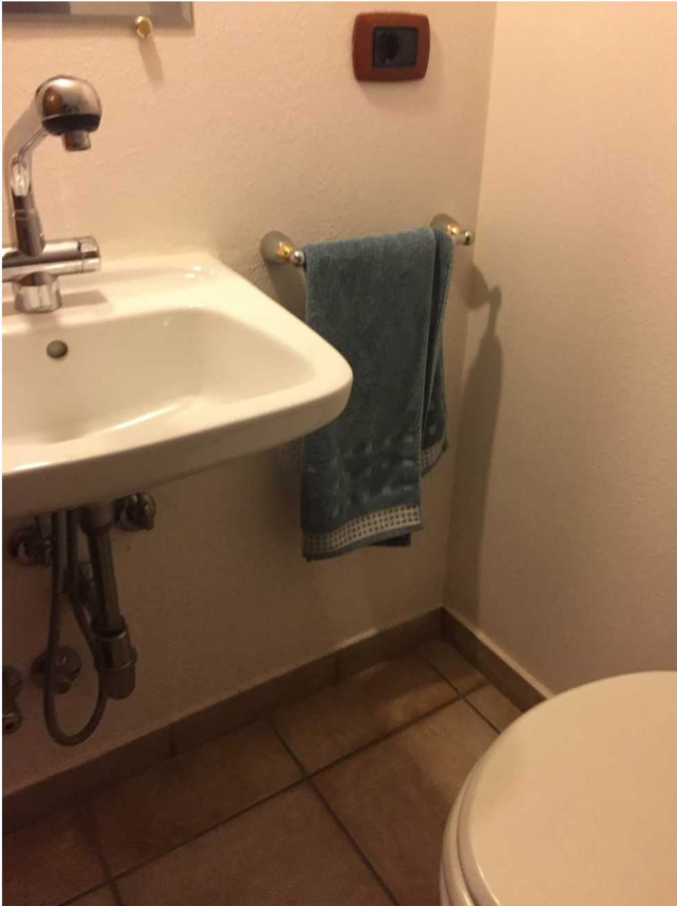
Fotografia n. 31 – PIANO SOTTOTETTO: vista del locale wc della porzione di casa di abitazione bifamiliare degli esecutati

Esecuzione Forzata n. 43/2017 XXXXXXXXXXXXXXXXXXXX contro XXXXXXXXXXXXXXXXXXXX XXXXXXXXXXXXXXXXXXXX