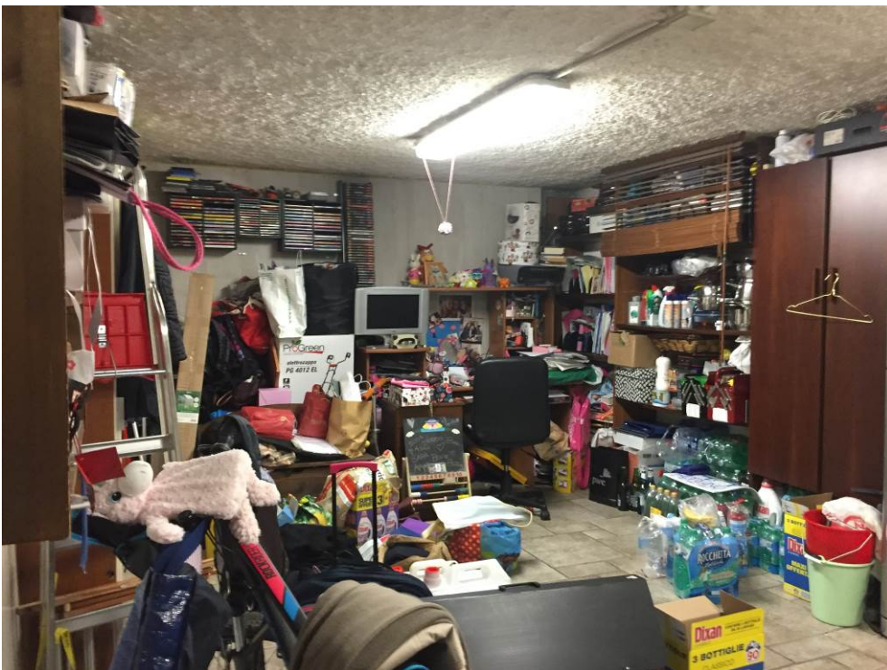
Fotografia n. 20 – PIANO INTERRATO: vista del locale autorimessa, adibito a ripostiglio, della porzione di casa di abitazione bifamiliare degli esecutati