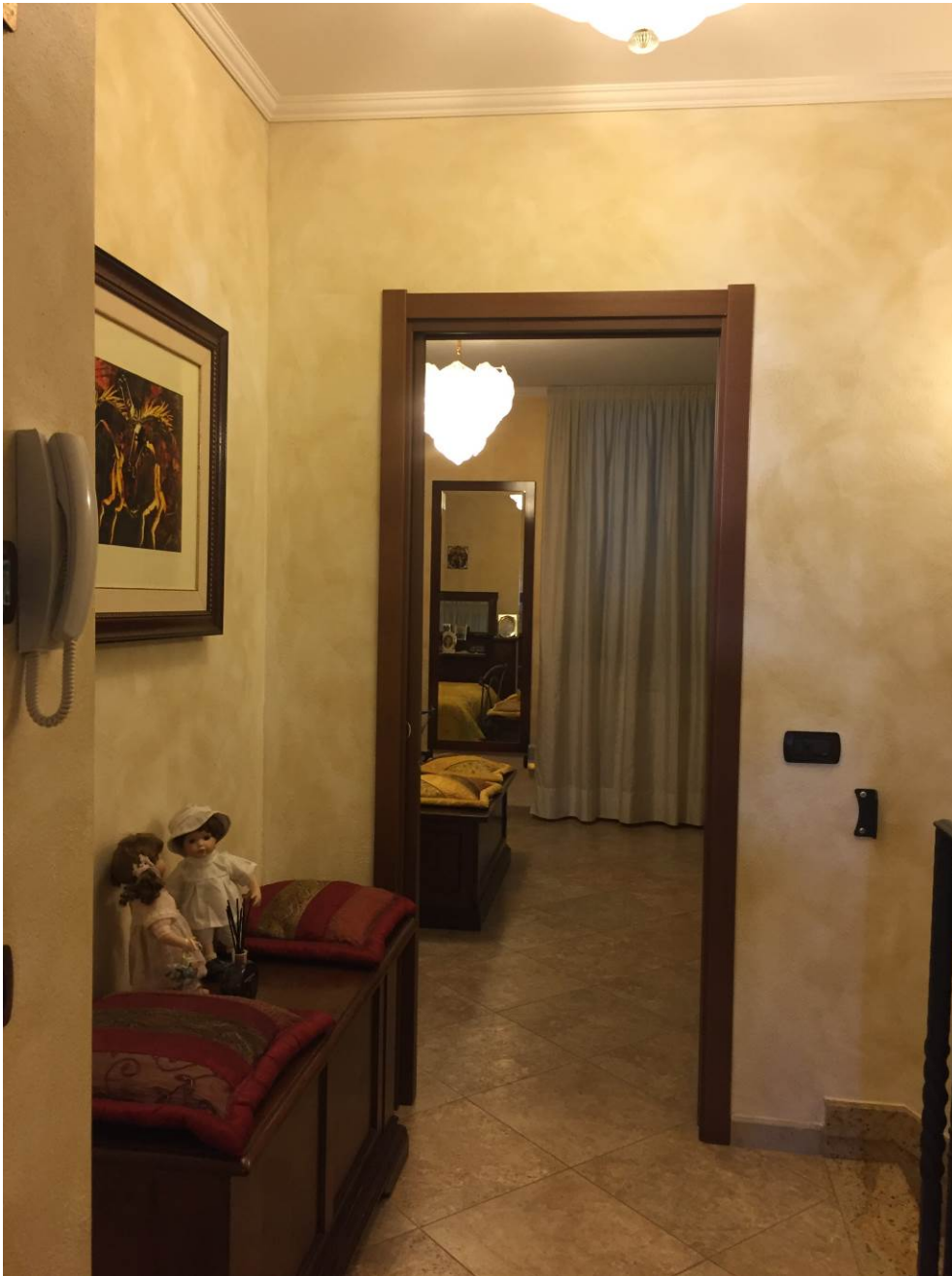
Fotografia n. 22 – PIANO PRIMO: vista, dal disimpegno, dell'ingresso alla camera da letto matrimoniale della porzione di casa di abitazione bifamiliare degli esecutati