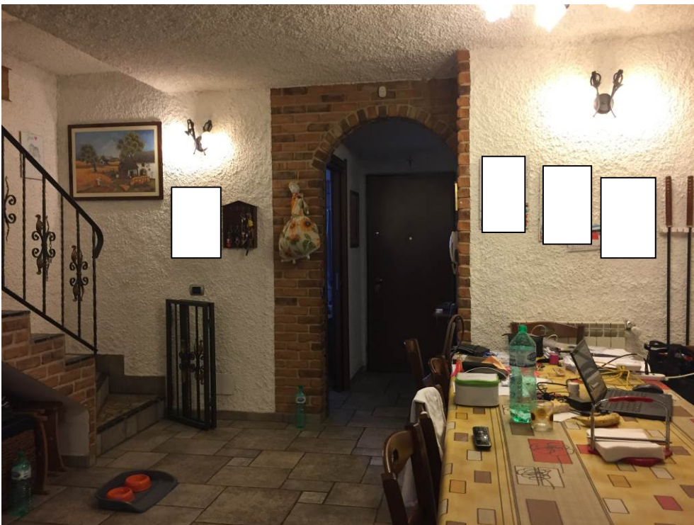
Fotografia n. 16 – PIANO INTERRATO: vista del locale cantina, adibito a cucina/pranzo, della porzione di casa di abitazione bifamiliare degli esecutati - particolare, sul fondo a sinistra, dell'ingresso al locale bagno e, sul fondo a destra, dell'ingresso al locale lavanderia