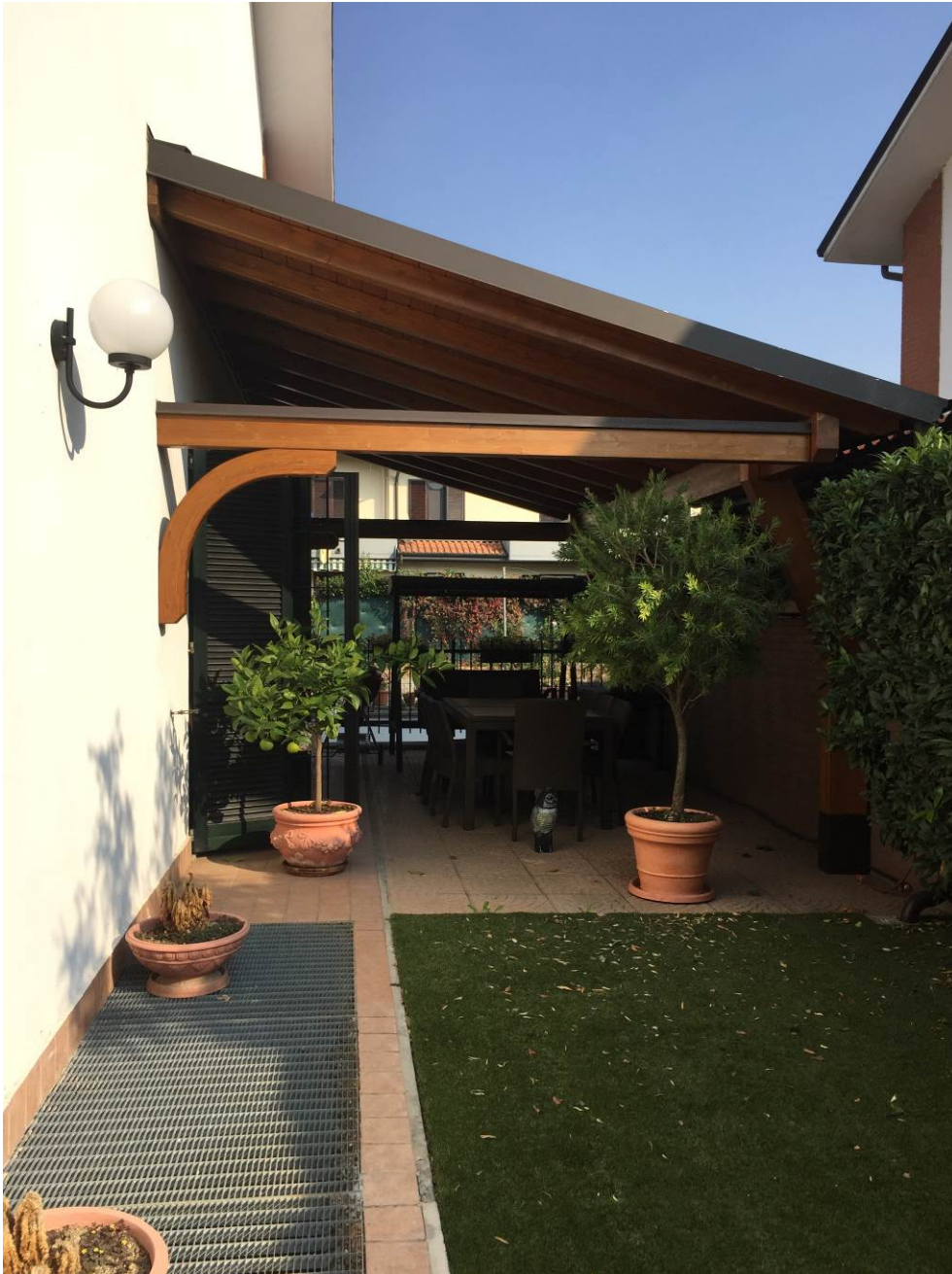
Fotografia n. 6 – Vista del prospetto laterale e della tettoia della porzione di casa di abitazione bifamiliare degli esecutati, sita in Barbaiana di Lainate (Mi) - Via L. Ariosto n. 23/G

Esecuzione Forzata n. 43/2017 XXXXXXXXXXXXXXXXXXXX contro XXXXXXXXXXXXXXXXXXXX XXXXXXXXXXXXXXXXXXXX