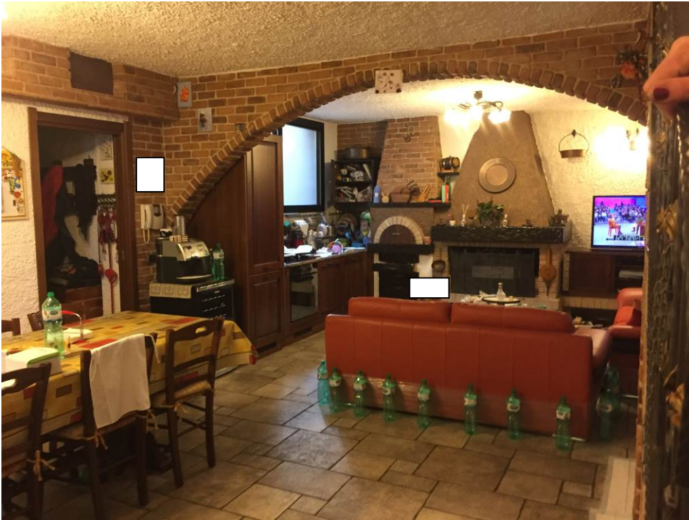
Fotografia n. 19 – PIANO INTERRATO: vista del locale cantina, adibito a cucina/pranzo, della porzione di casa di abitazione bifamiliare degli esecutati – particolare, a sinistra, dell'ingresso al locale autorimessa