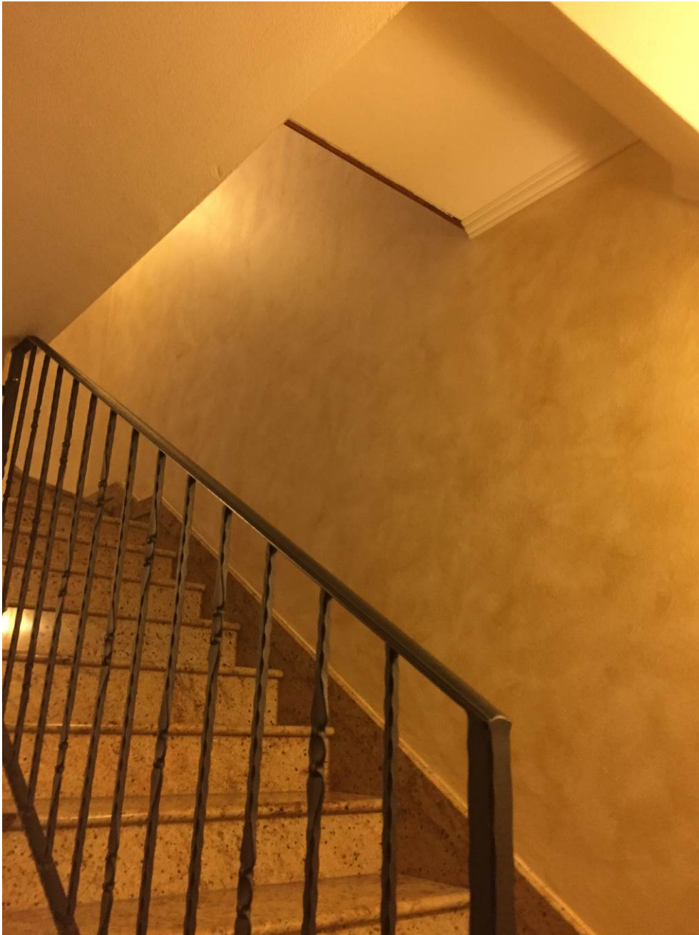
Fotografia n. 21 – Vista, dal locale soggiorno/pranzo del piano terra, della scala di collegamento tra i piani terra e primo della porzione di casa di abitazione bifamiliare degli esecutati