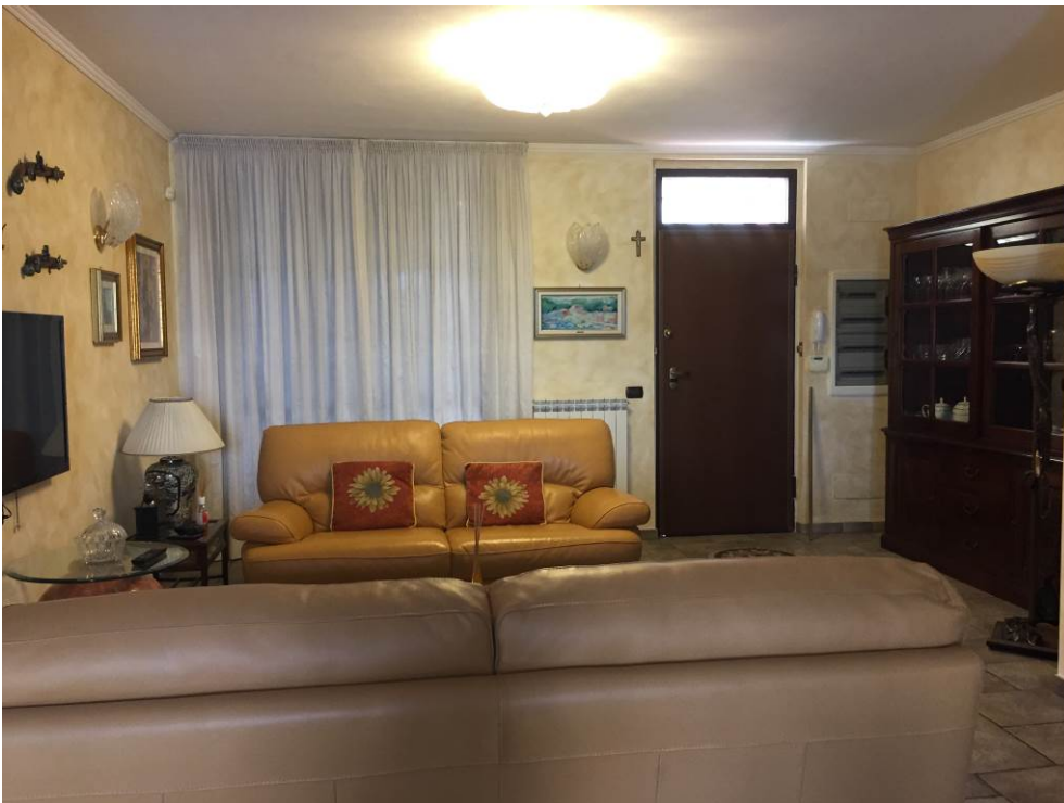
Fotografia n. 10 – PIANO TERRA: vista dell'ingresso della porzione di casa di abitazione bifamiliare degli executati