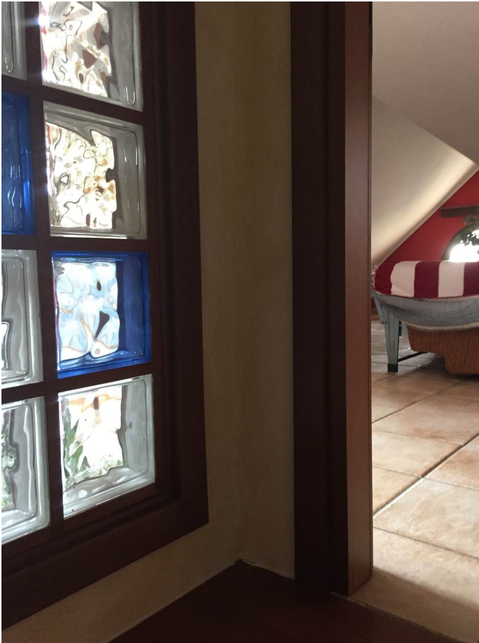
Fotografia n. 28 – PIANO SOTTOTETTO: vista dell'approdo della scala ai locali di sgombero/servizio della porzione di casa di abitazione bifamiliare degli esecutati