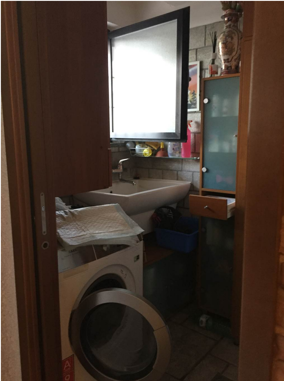
Fotografia n. 18 – PIANO INTERRATO: vista del locale lavanderia della porzione di casa di abitazione bifamiliare degli esecutati