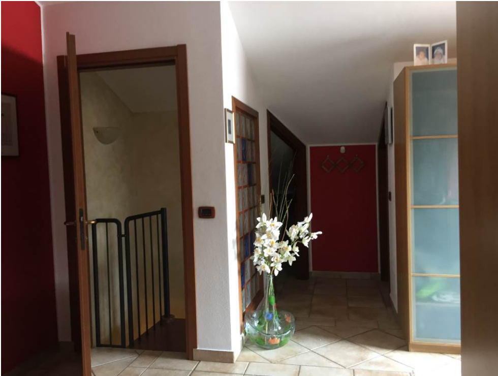
Fotografia n. 29 – PIANO SOTTOTETTO: vista dell'ingresso ai locali sgombero/servizio della porzione di casa di abitazione bifamiliare degli esecutati