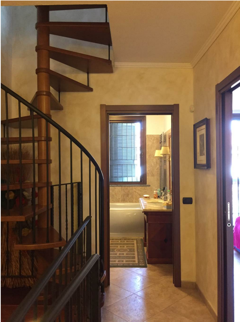
Fotografia n. 24 – PIANO PRIMO: vista, dal disimpegno, dell'ingresso al locale bagno, dell'ingresso alla camera da letto e della scala di collegamento tra i piani primo e sottotetto della porzione di casa di abitazione bifamiliare degli esecutati