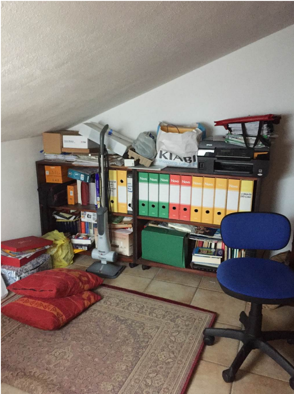
Fotografia n. 32 – PIANO SOTTOTETTO: vista del locale ripostiglio della porzione di casa di abitazione bifamiliare degli esecutati

Esecuzione Forzata n. 43/2017 XXXXXXXXXXXXXXXXXXXX contro XXXXXXXXXXXXXXXXXXXX XXXXXXXXXXXXXXXXXXXX