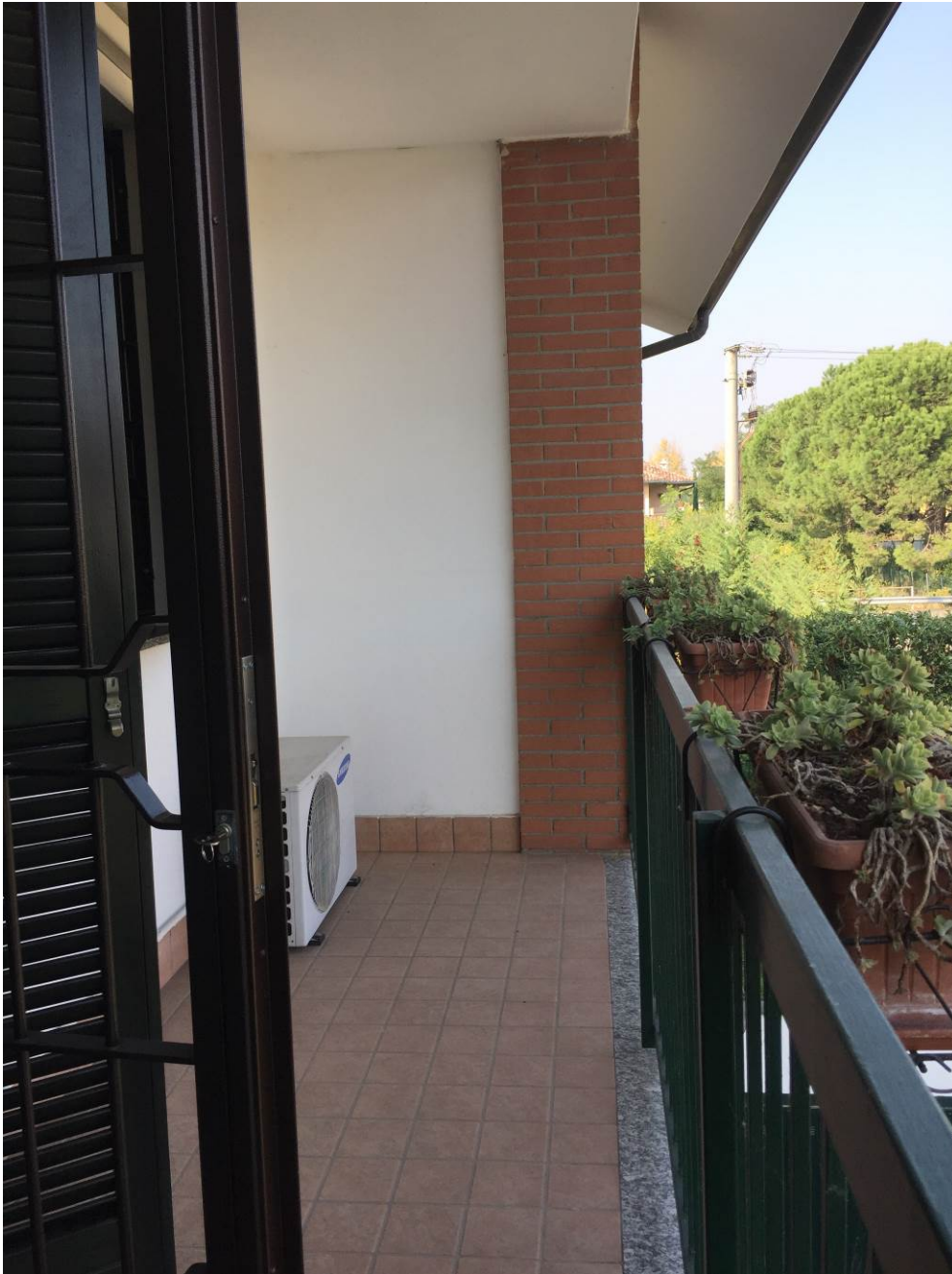
Fotografia n. 27 – PIANO PRIMO: vista del balcone (loggia) della porzione di casa di abitazione bifamiliare degli esecutati