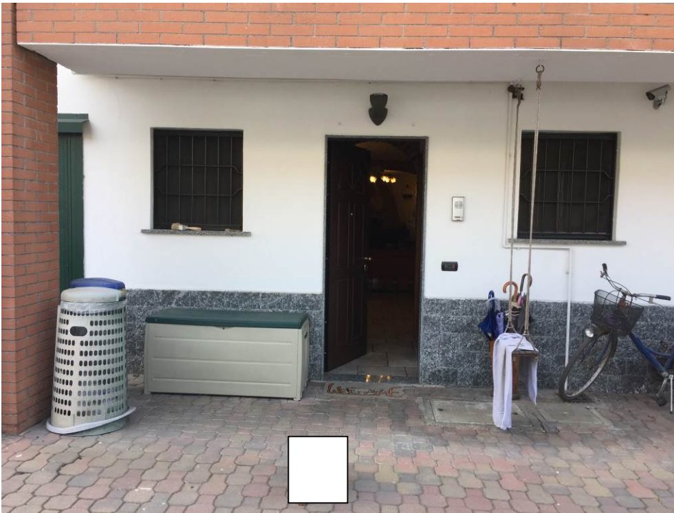
Fotografia n. 9 – Particolare dell'ingresso ai locali cantina (piano interrato - lato corsello box) della porzione di casa di abitazione bifamiliare degli executati, sita in Barbaiana di Lainate (Mi) - Via L. Ariosto n. 23/G

Esecuzione Forzata n. 43/2017 XXXXXXXXXXXXXXXXXXXX contro XXXXXXXXXXXXXXXXXXXX XXXXXXXXXXXXXXXXXXXX