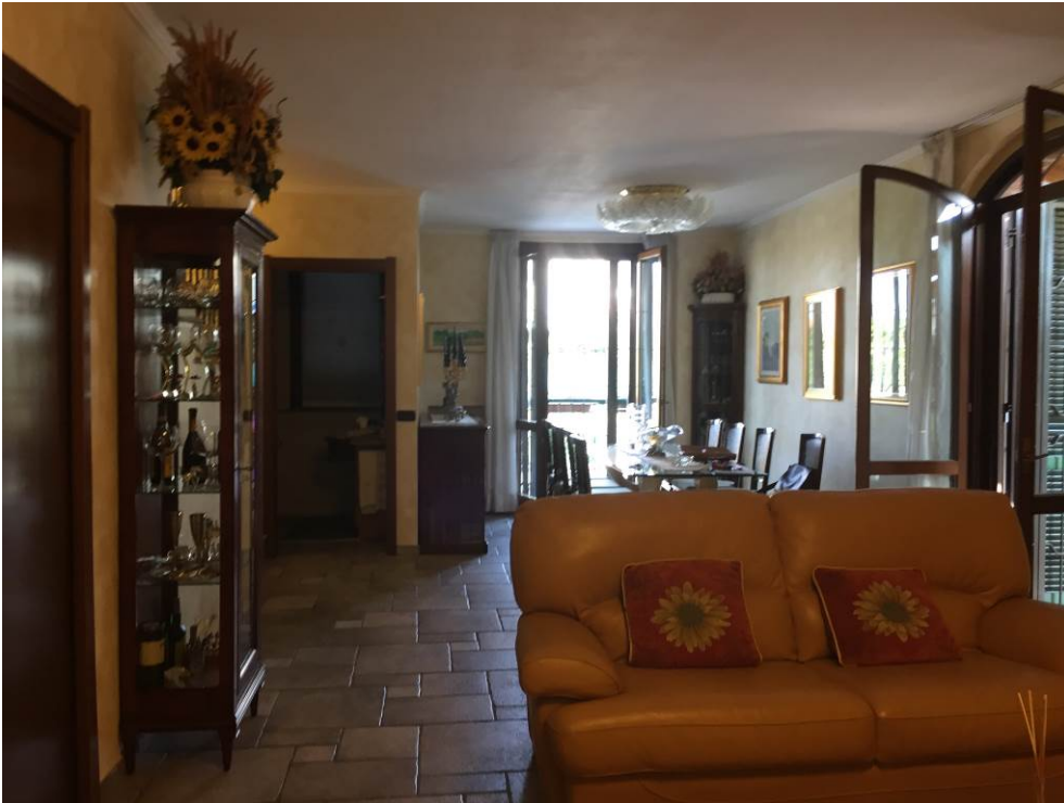
Fotografia n. 13 – PIANO TERRA: vista del locale soggiorno/pranzo della porzione di casa di abitazione bifamiliare degli esecutati - particolare, a sinistra, della porta che conduce al piano interrato e, sul fondo, della porta di accesso al locale bagno, sprovvisto di antibagno