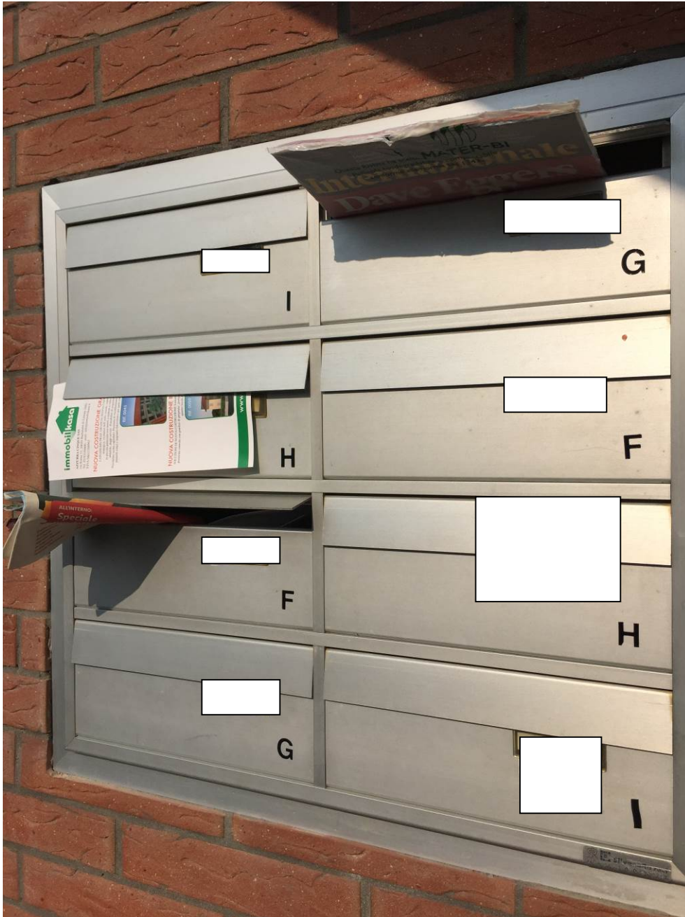
Fotografia n. 2 – Vista del muretto all'ingresso del complesso edilizio sito in Barbaiana di Lainate (Mi) - Via L. Ariosto n. 23, in cui alloggiavano le caselle delle lettere ed il citofono – particolare, sulla sinistra in basso, della casella delle lettere con il nominativo degli esecutati, contraddistinta con la lettera G

Esecuzione Forzata n. 43/2017 XXXXXXXXXXXXXXXXXXXX contro XXXXXXXXXXXXXXXXXXXX XXXXXXXXXXXXXXXXXXXX