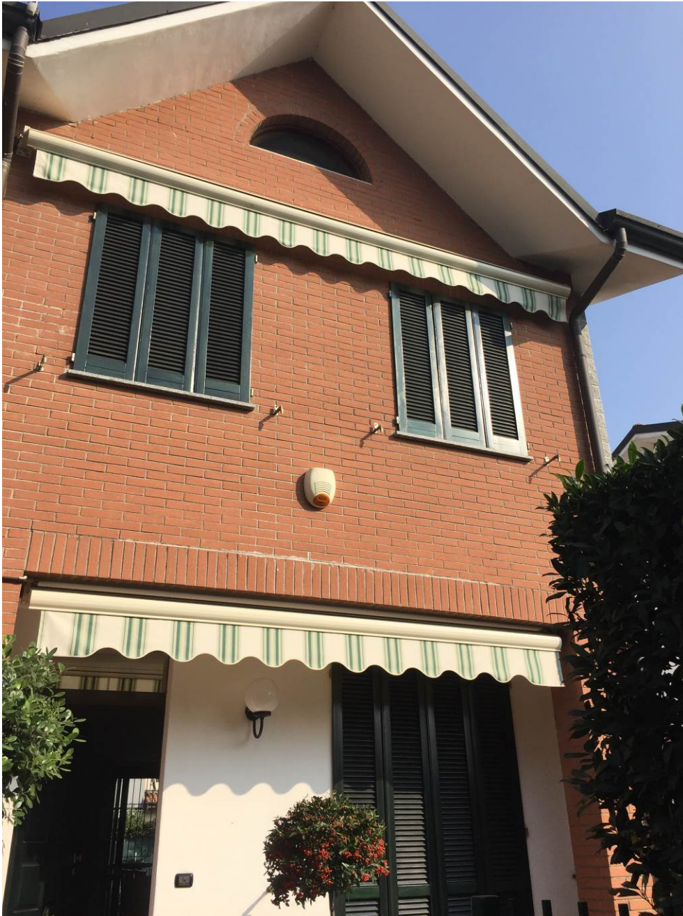
Fotografia n. 5 – Vista del prospetto principale della porzione di casa di abitazione bifamiliare degli esecutati, sita in Barbaiana di Lainate (Mi) - Via L. Ariosto n. 23/G

Esecuzione Forzata n. 43/2017 XXXXXXXXXXXXXXXXXXXX contro XXXXXXXXXXXXXXXXXXXX XXXXXXXXXXXXXXXXXXXX