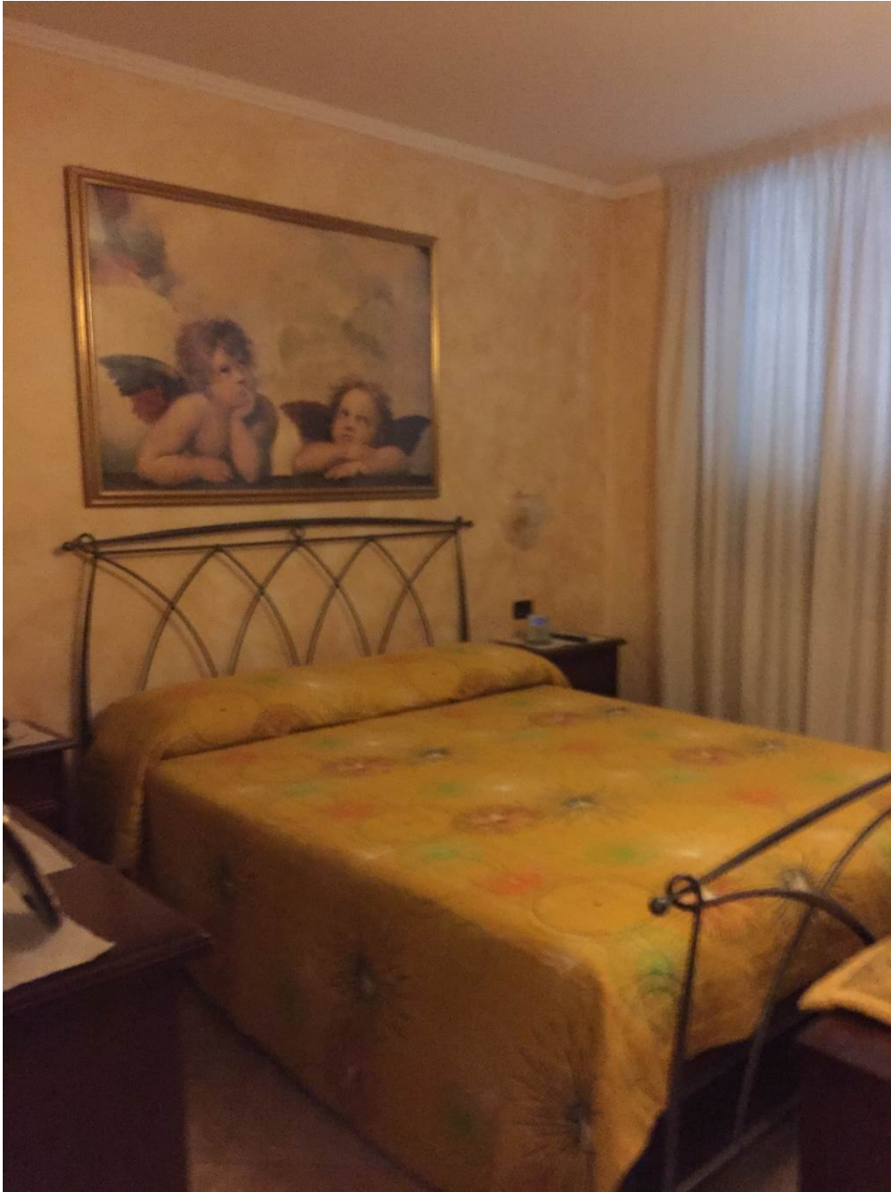
Fotografia n. 23 – PIANO PRIMO: vista della camera da letto matrimoniale della porzione di casa di abitazione bifamiliare degli esecutati