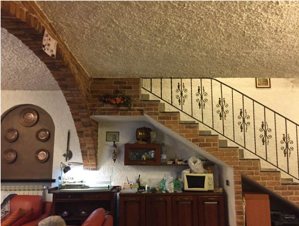
Fotografia n. 15 – PIANO INTERRATO: vista del locale cantina, adibito a cucina/pranzo, della porzione di casa di abitazione bifamiliare degli esecutati - particolare della scala