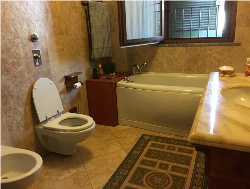
Fotografia n. 25 – PIANO PRIMO: vista del locale bagno della porzione di casa di abitazione bifamiliare degli esecutati

Esecuzione Forzata n. 43/2017 XXXXXXXXXXXXXXXXXXXX contro XXXXXXXXXXXXXXXXXXXX XXXXXXXXXXXXXXXXXXXX