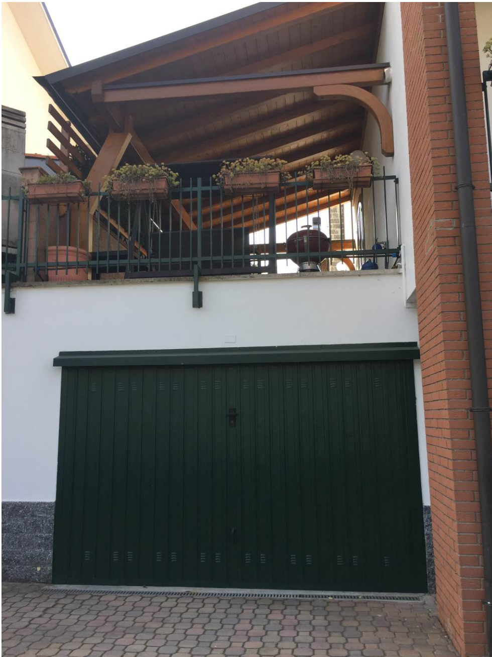
Fotografia n. 8 – Particolare della tettoia (piano terra) e dell'autorimessa (piano interrato – lato corsello box) della porzione di casa di abitazione bifamiliare degli esecutati, sita in Barbaiana di Lainate (Mi) - Via L. Ariosto n. 23/G

Esecuzione Forzata n. 43/2017 XXXXXXXXXXXXXXXXXXXX contro XXXXXXXXXXXXXXXXXXXX XXXXXXXXXXXXXXXXXXXX