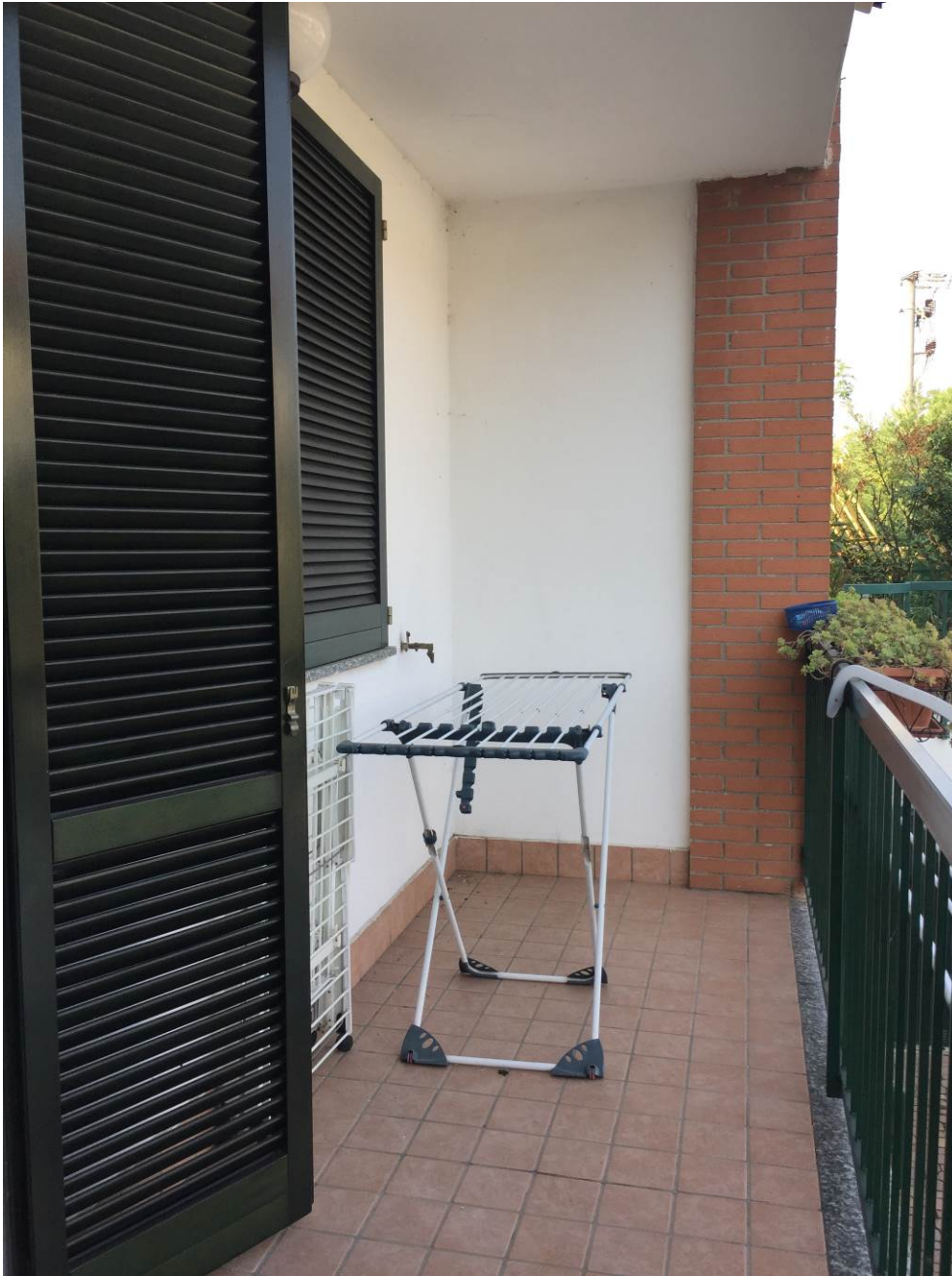
Fotografia n. 12 – PIANO TERRA: vista del balcone (loggia) della porzione di casa di abitazione bifamiliare degli esecutati