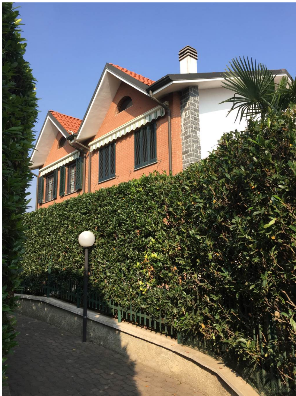
Fotografia n. 3 – Vista del passaggio pedonale comune, localizzato all'interno del complesso edilizio sito in Barbaiana di Lainate (Mi) - Via L. Ariosto n. 23

Esecuzione Forzata n. 43/2017 XXXXXXXXXXXXXXXXXXXX contro XXXXXXXXXXXXXXXXXXXX XXXXXXXXXXXXXXXXXXXX