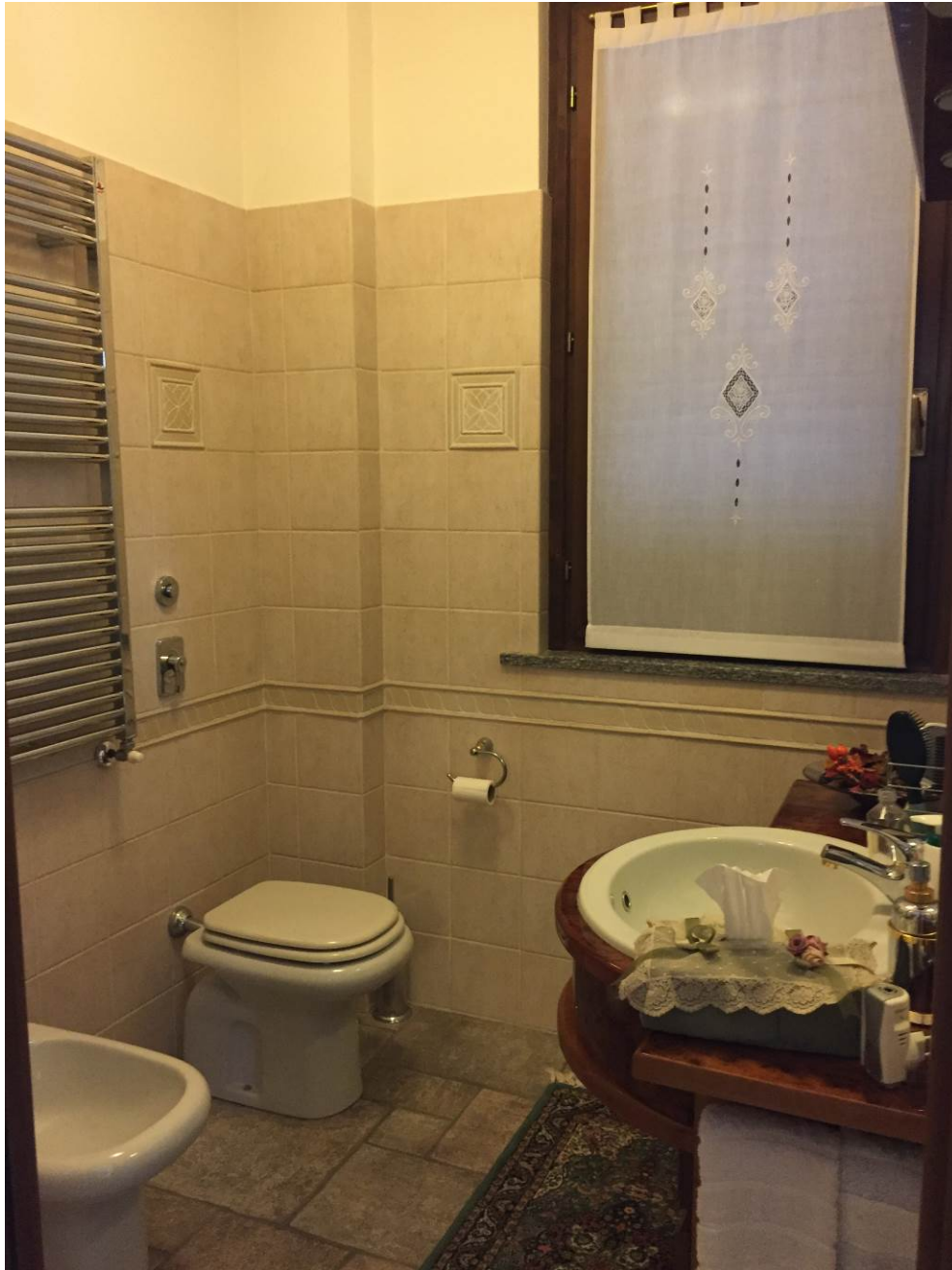
Fotografia n. 11 – PIANO TERRA: vista del locale bagno della porzione di casa di abitazione bifamiliare degli esegutati