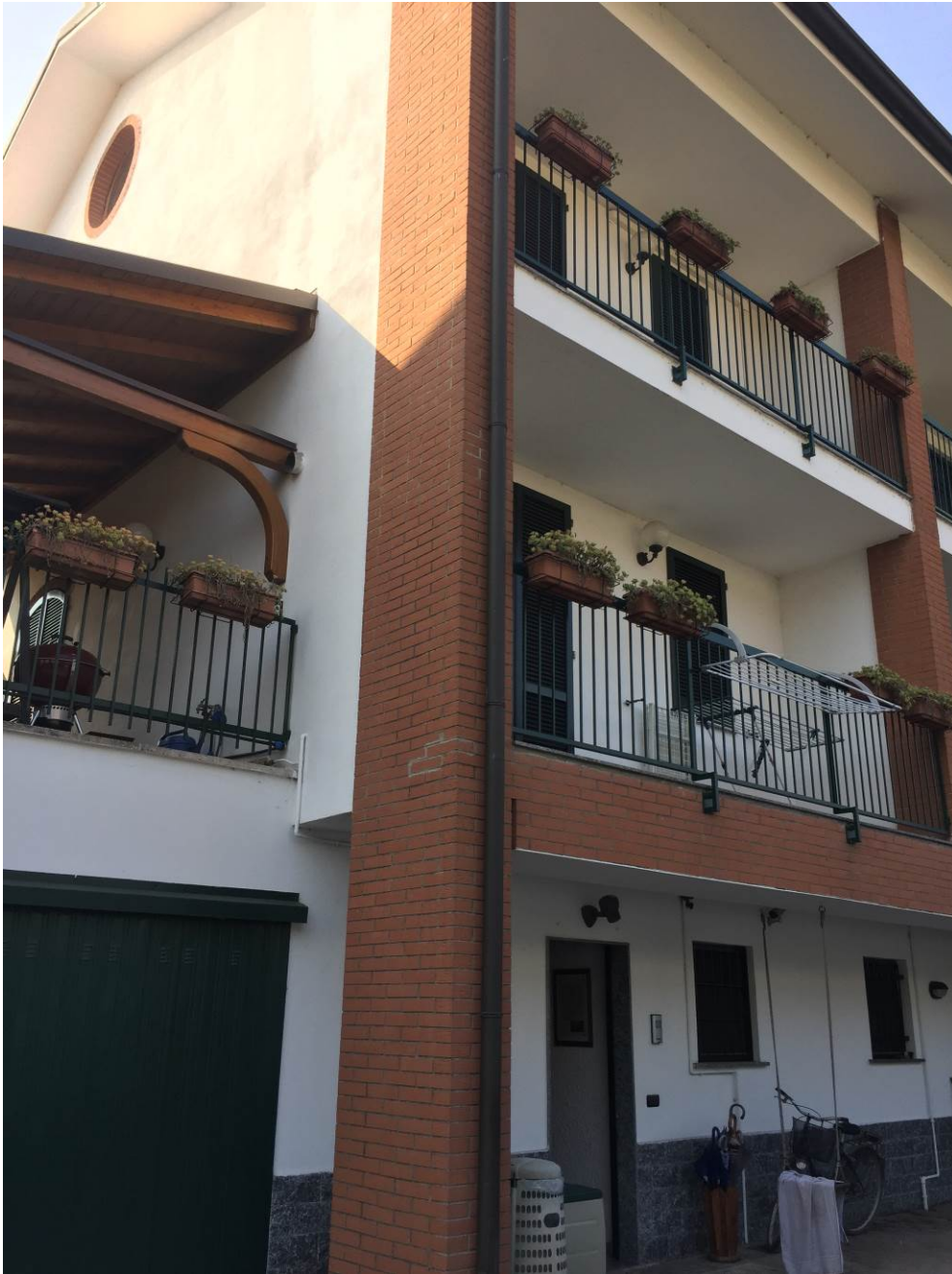
Fotografia n. 7 – Vista del prospetto secondario, con la tettoia (piano terra), l'autorimessa e l'ingresso ai locali cantina (piano interrato – lato corsello box), della porzione di casa di abitazione bifamiliare degli esecutati, sita in Barbaiana di Lainate (Mi) - Via L. Ariosto n. 23/G

Esecuzione Forzata n. 43/2017 XXXXXXXXXXXXXXXXXXXX contro XXXXXXXXXXXXXXXXXXXX XXXXXXXXXXXXXXXXXXXX