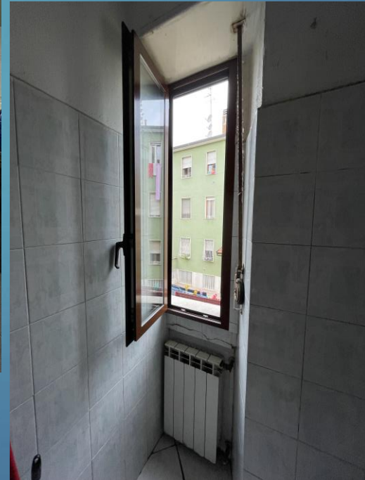
Viste interne: zona giorno – cucina