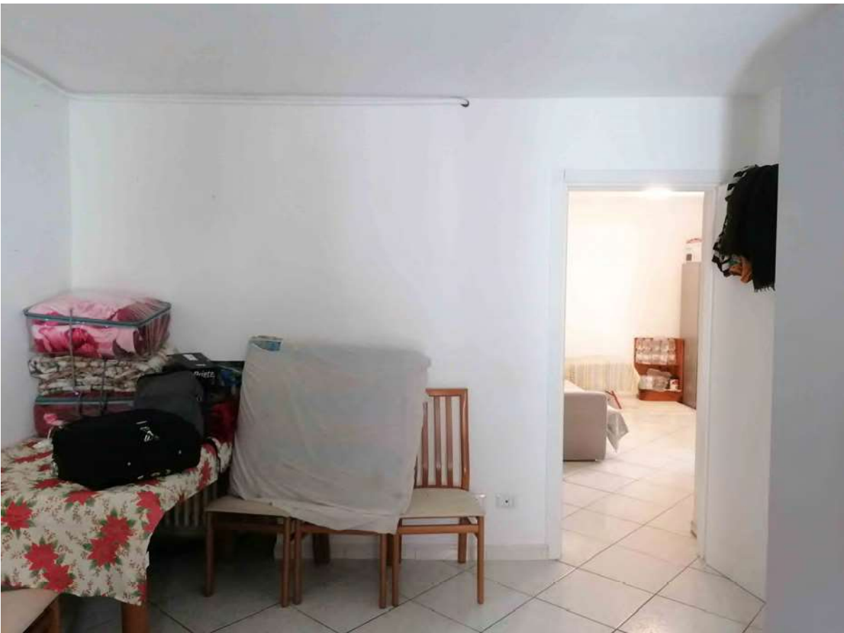
Foto 16. Camera