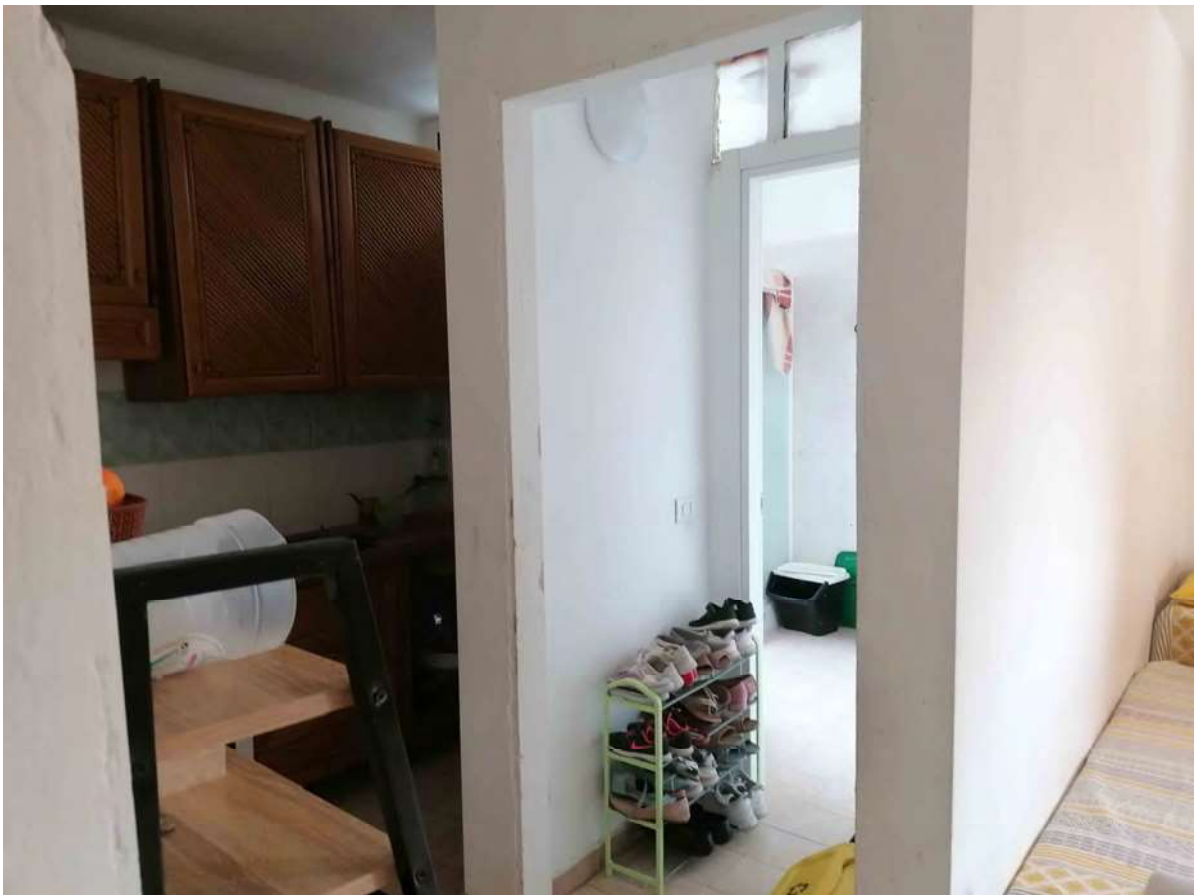
Foto 11. Antibagno