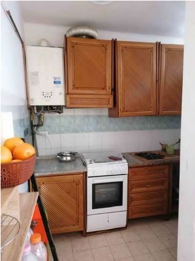
Foto 11. Angolo cottura