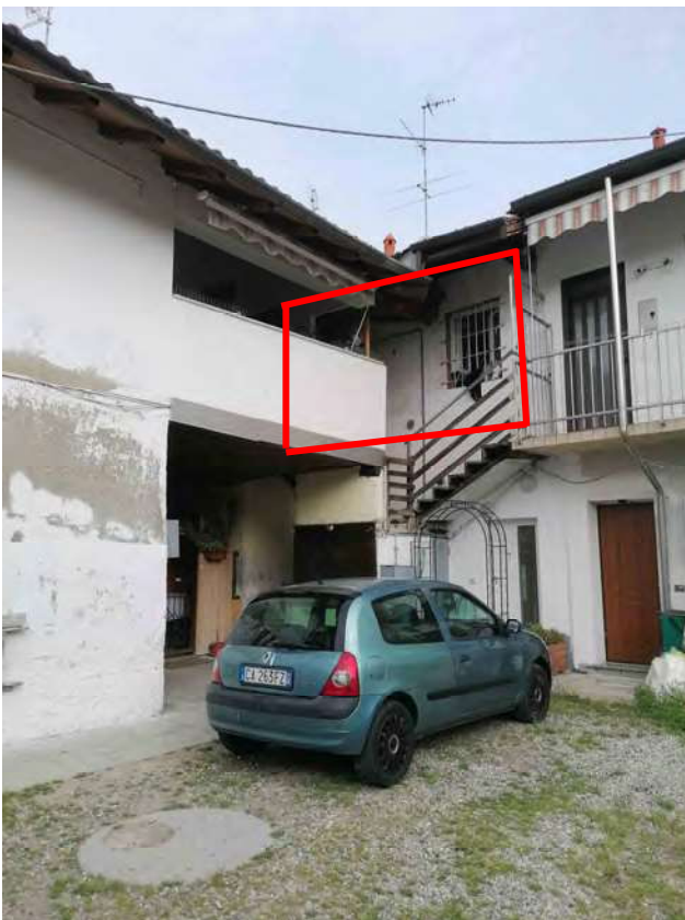
Foto 4. Prospetto su cortile comune