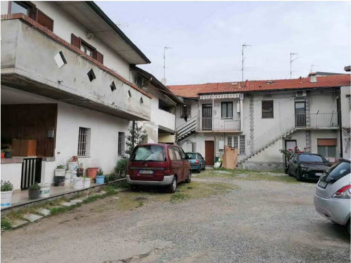
Foto 3. Cortile comune