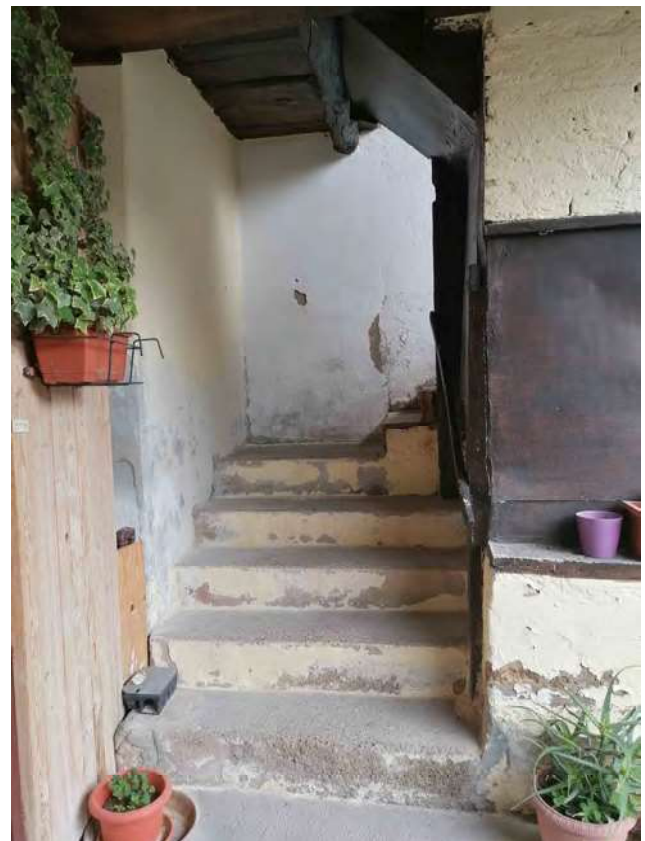
Foto 5. Sbarco piano terra scala d'accesso all'immobile