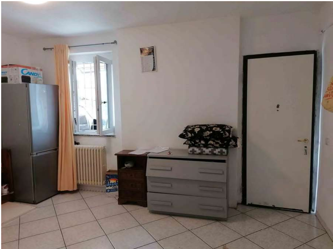
Foto 9. Soggiorno con angolo cottura