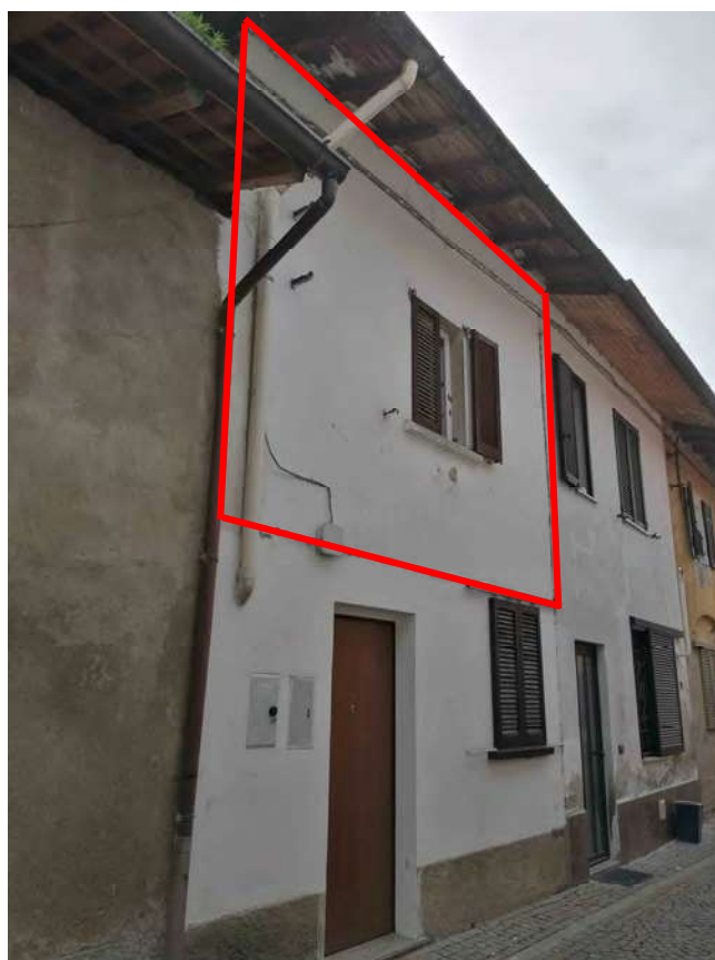
Foto 1. Prospetto su Via Marconi