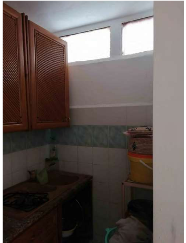
Foto 12. Angolo cottura