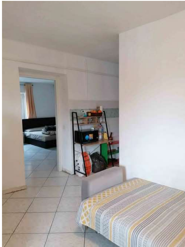
Foto 10. Soggiorno con angolo cottura