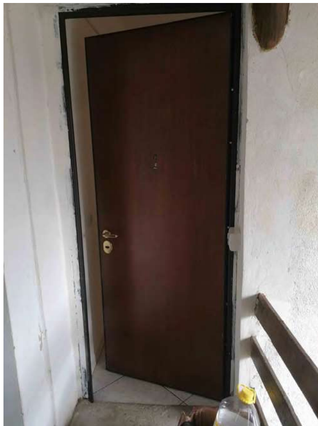
Foto 7. Porta d'accesso all'appartamento