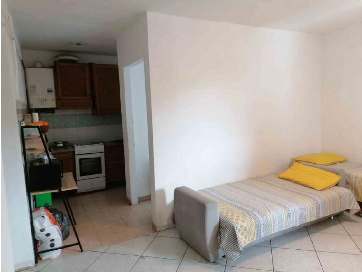
Foto 8. Soggiorno con angolo cottura