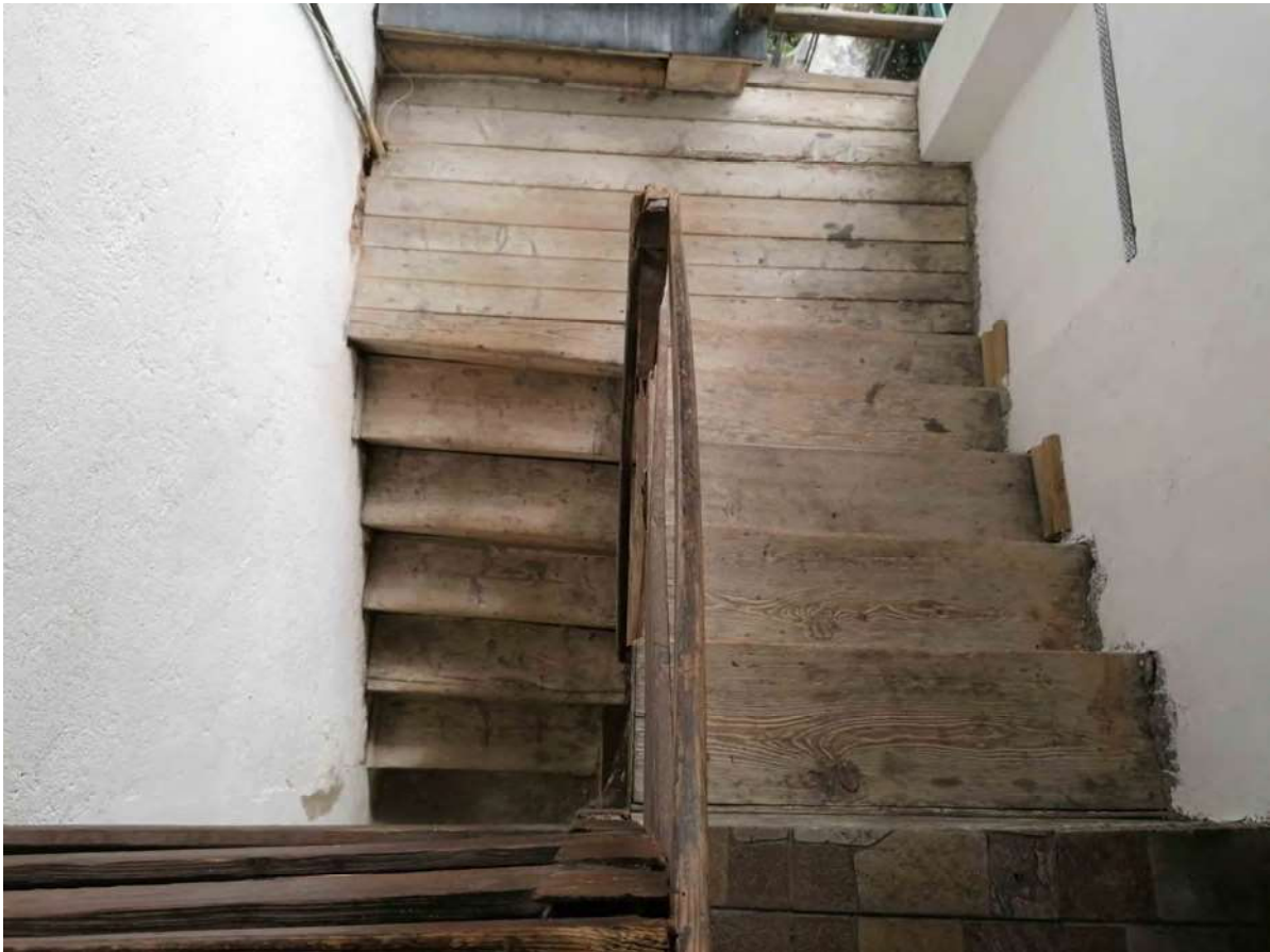
Foto 6. Scala d'accesso all'immobile