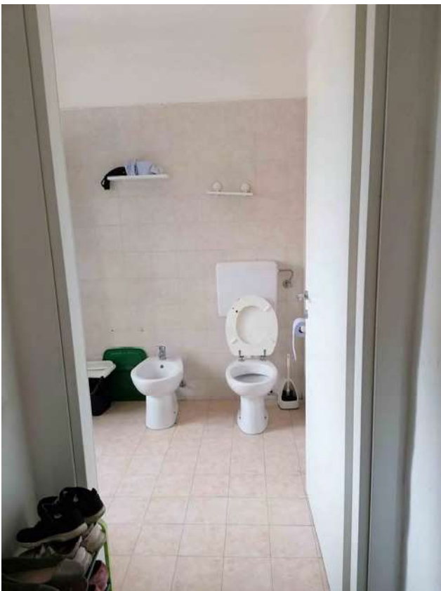
Foto 13. Bagno