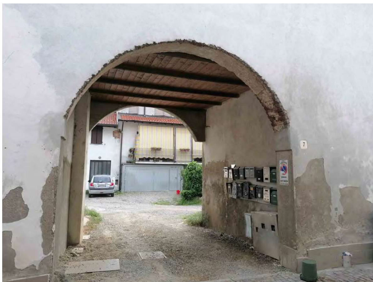
Foto 2. Ingresso al civico n.7 di Via Marconi