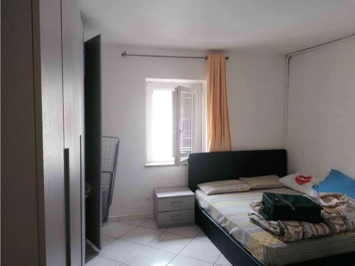
Foto 15. Camera