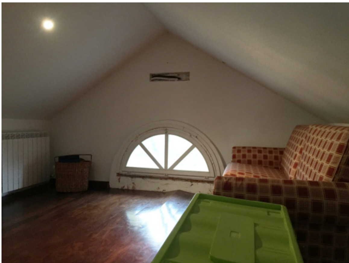
Foto 34 - Solaio al secondo piano sottotetto