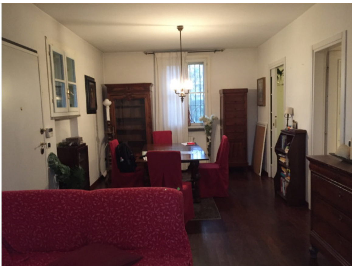
Foto 12 - Soggiorno