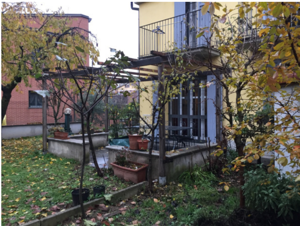
Foto 07 - Giardino esclusivo sul retro della villetta con pergolato