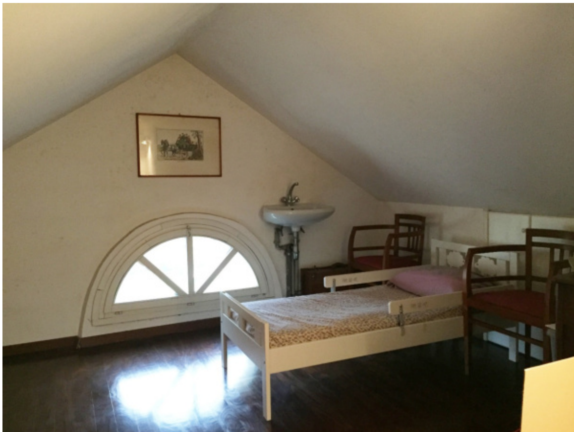
Foto 33 - Solaio al secondo piano sottotetto