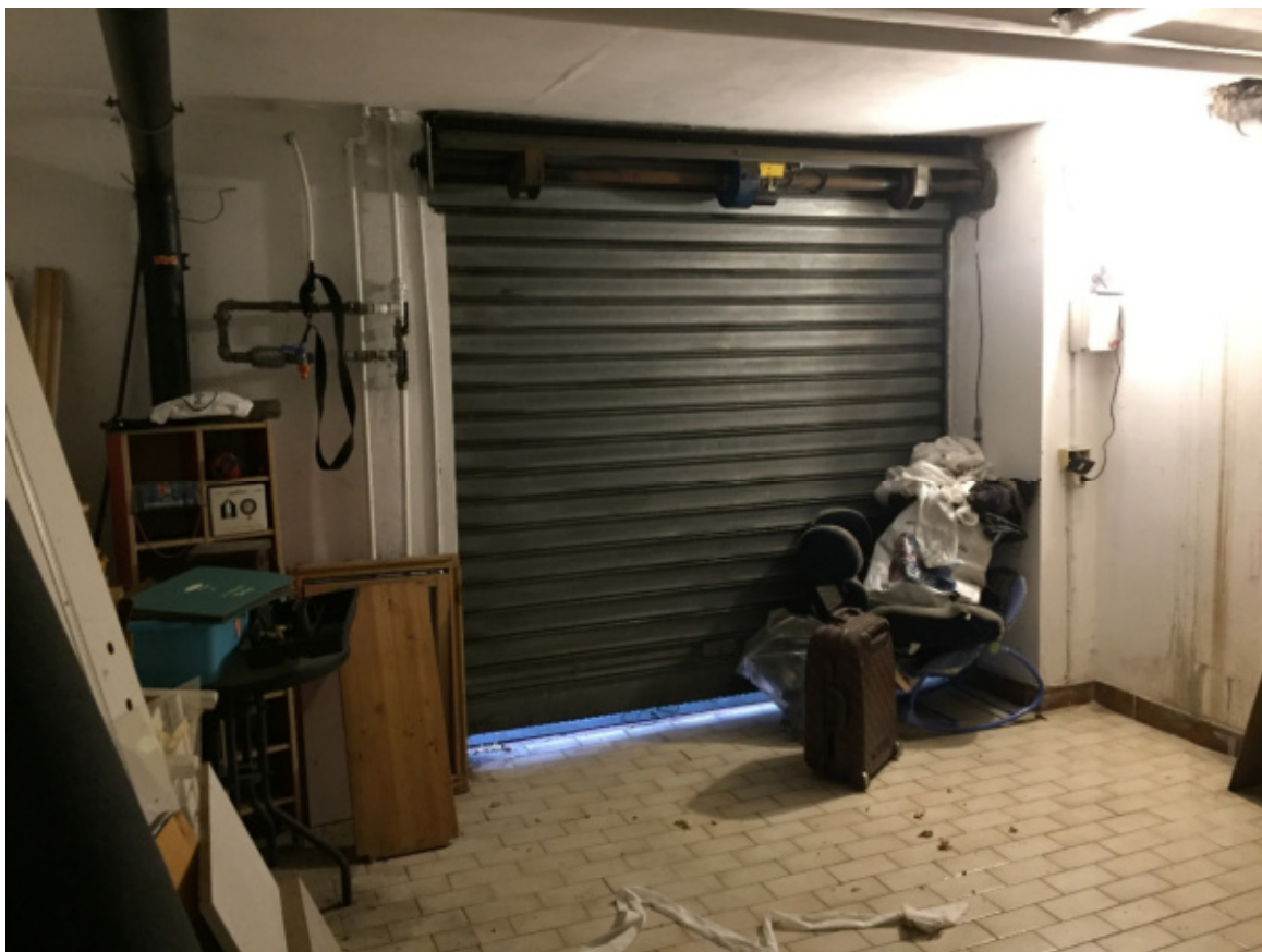
Foto 41 - Box