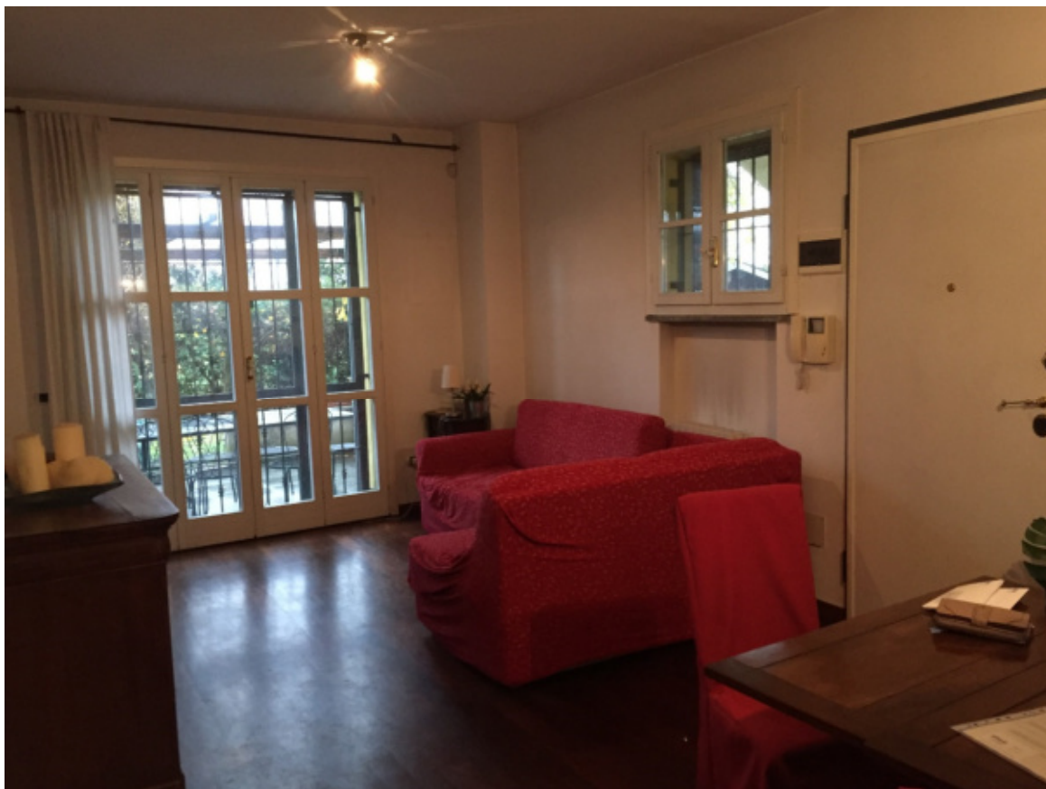
Foto 13 - Soggiorno