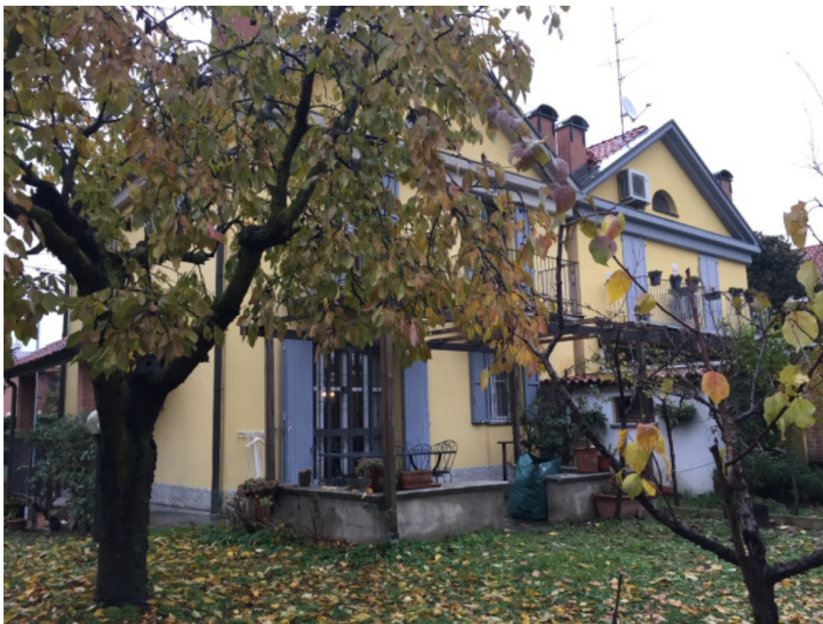
Foto 08 - Giardino esclusivo sul retro della villetta con pergolato