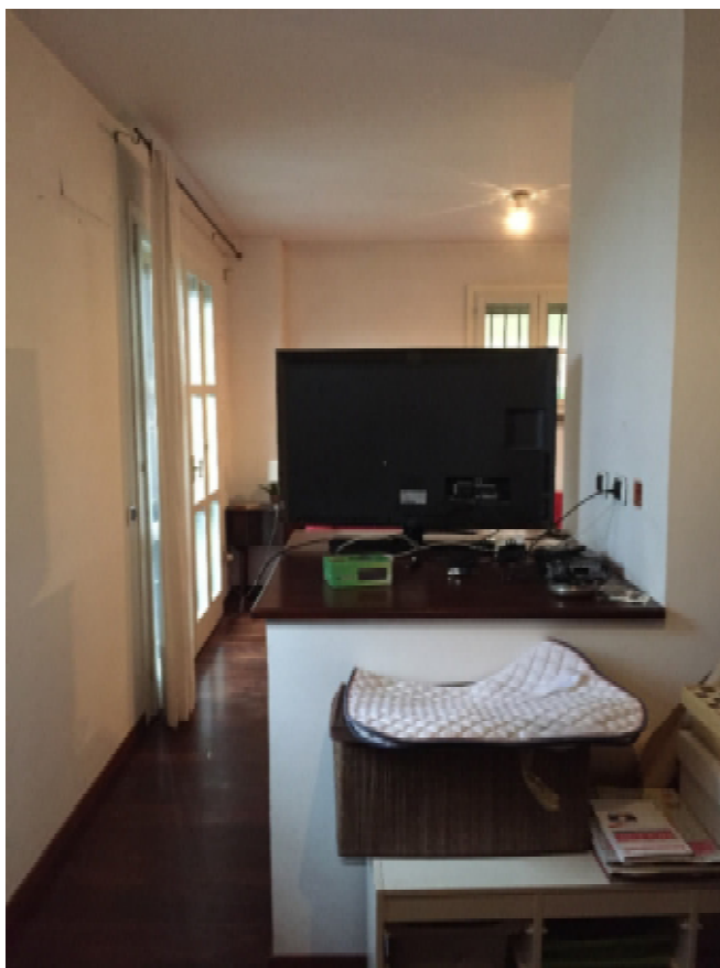
Foto 16 - Soggiorno