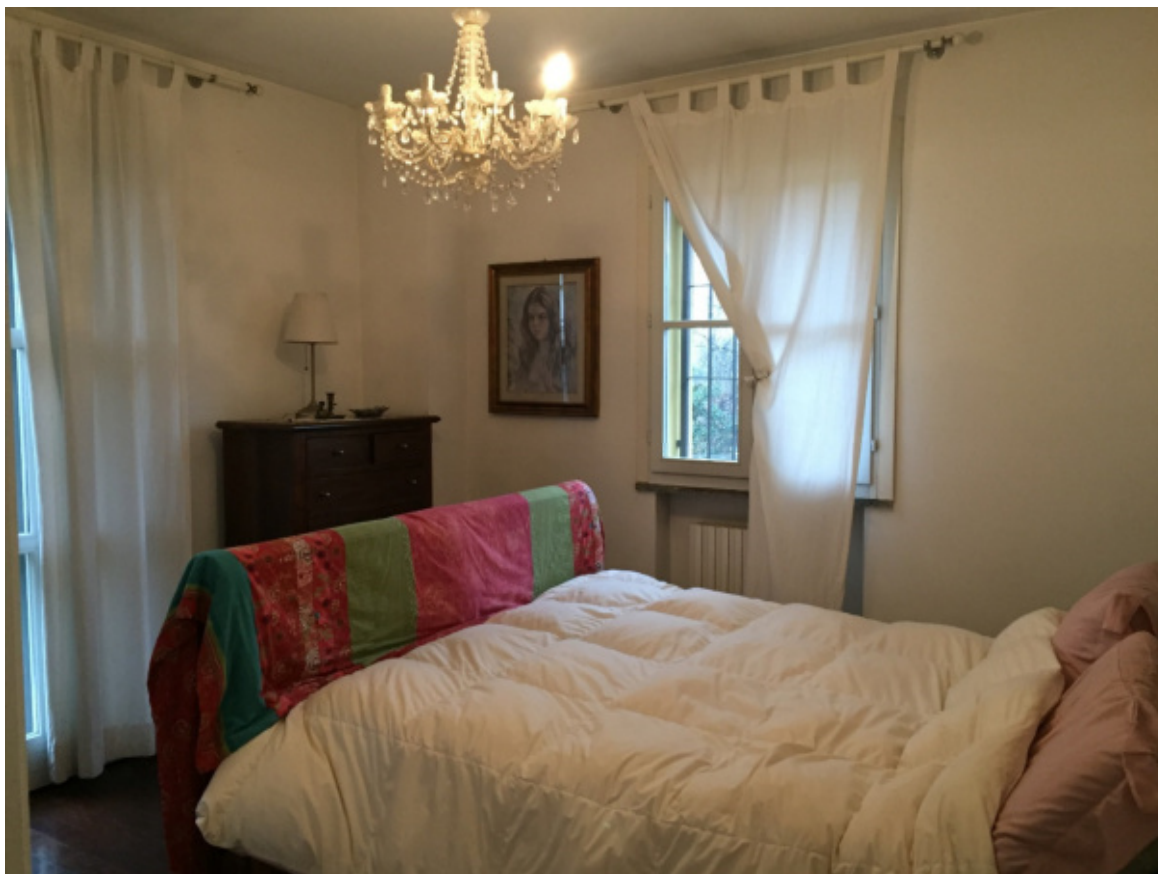
Foto 25 - Camera