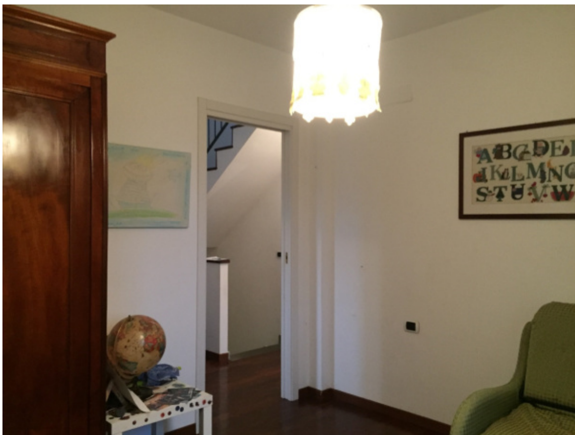
Foto 24 - Camera