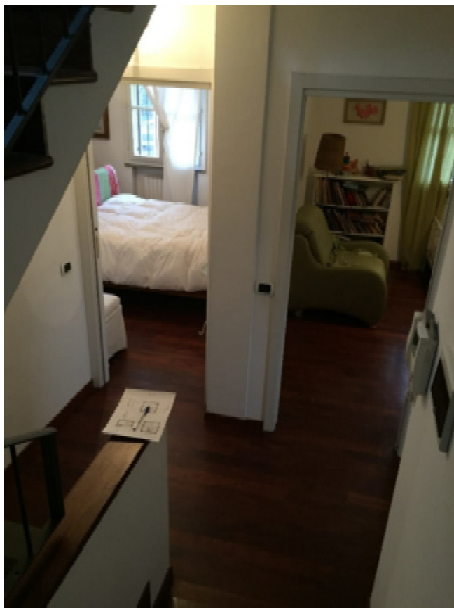
Foto 21 - Disimpegno