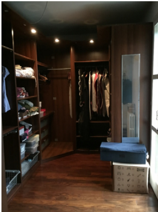
Foto 27 - Cabina armadio