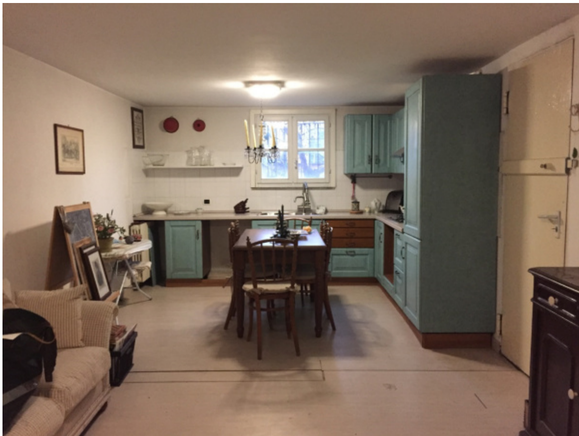
Foto 37 - Taverna al primo piano seminterrato