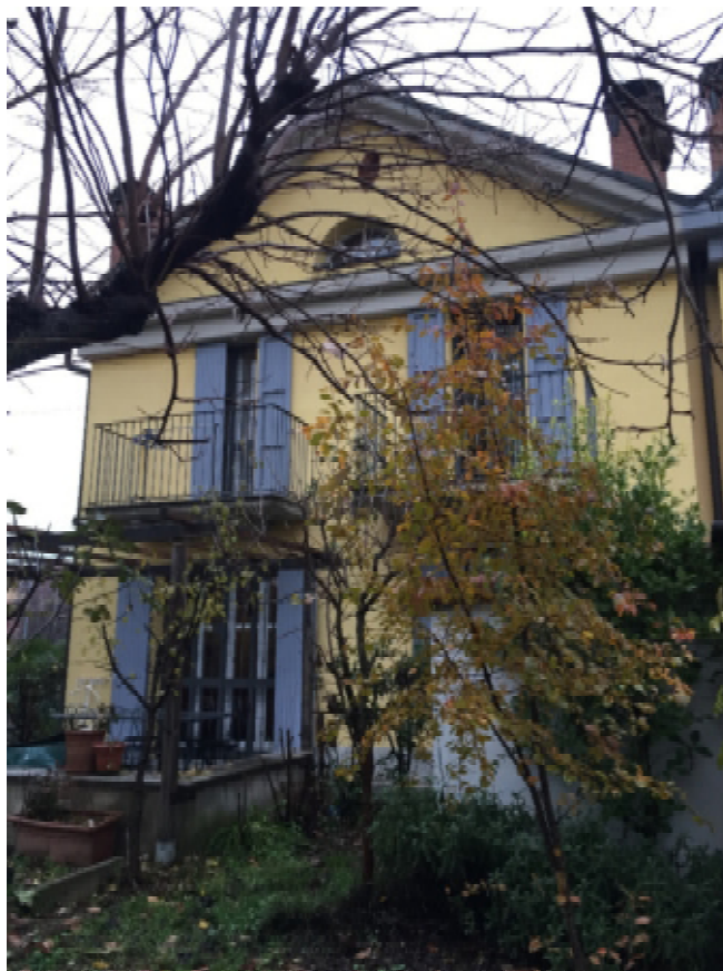
Foto 09 - Retro della villetta