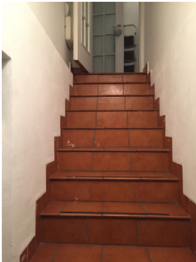
Foto 35 - Scala accesso al piano cantinato