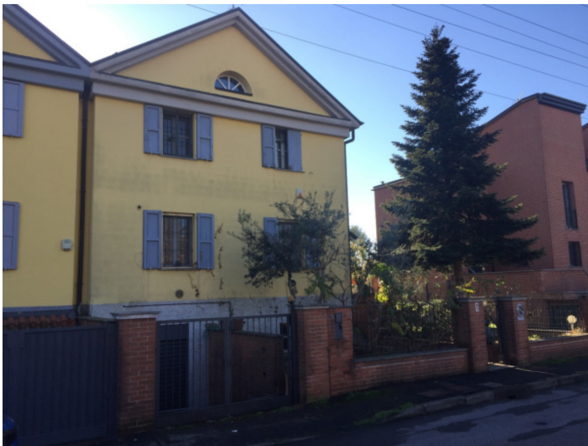
Foto 02 - La villetta su via Madonnina