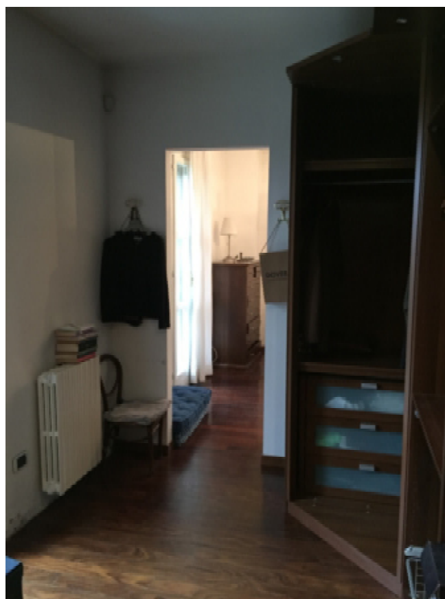
Foto 28 - Cabina armadio