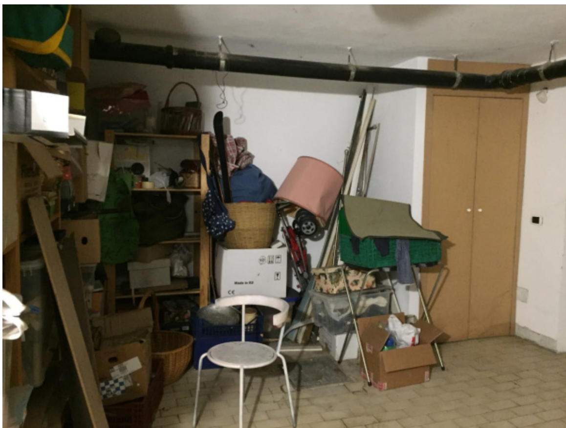
Foto 40 - Box