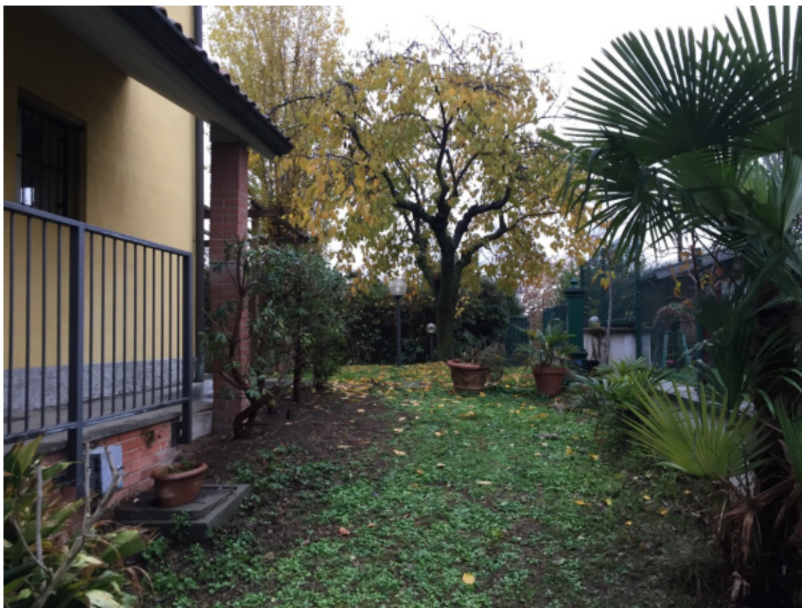
Foto 06 - Giardino esclusivo della villetta