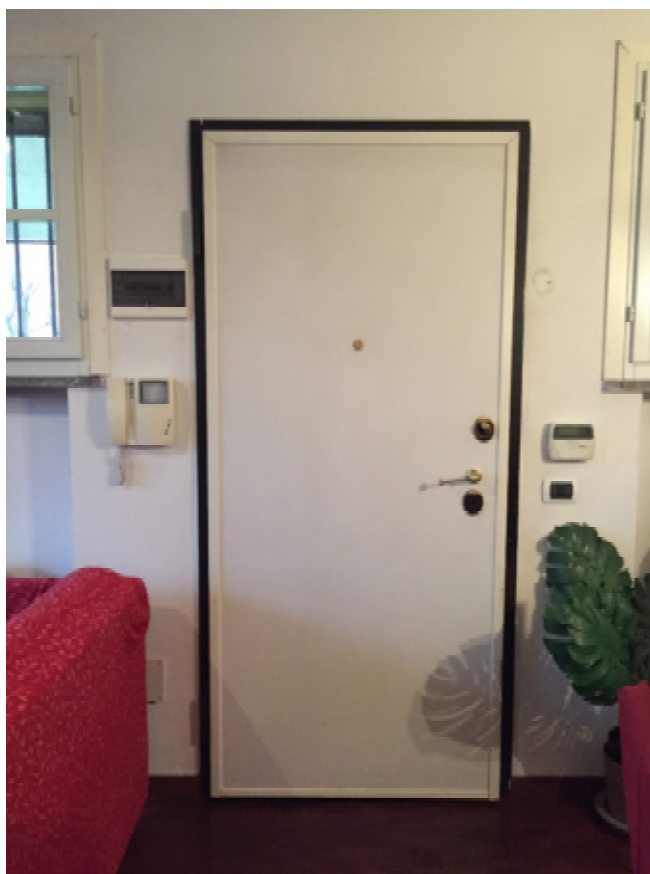
Foto 10 - Ingresso alla villetta