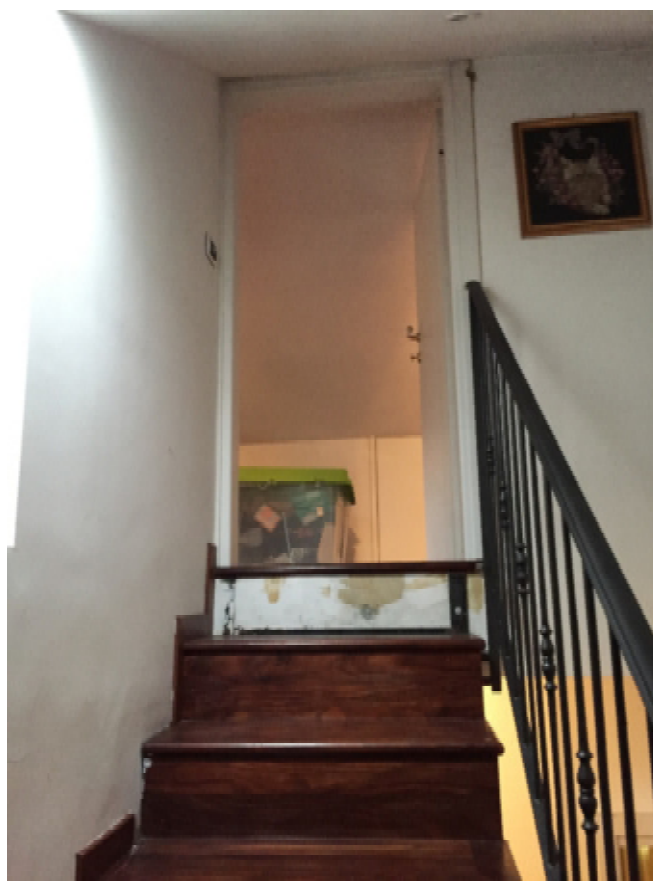
Foto 32 - Scala di accesso al secondo piano sottotetto