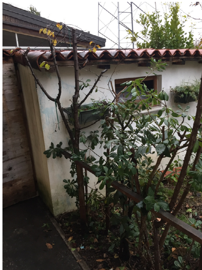
Foto 44 - Capanno degli attrezzi nel giardino esclusivo