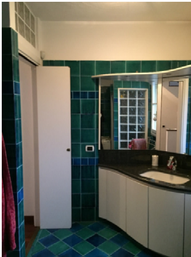
Foto 29 - Bagno