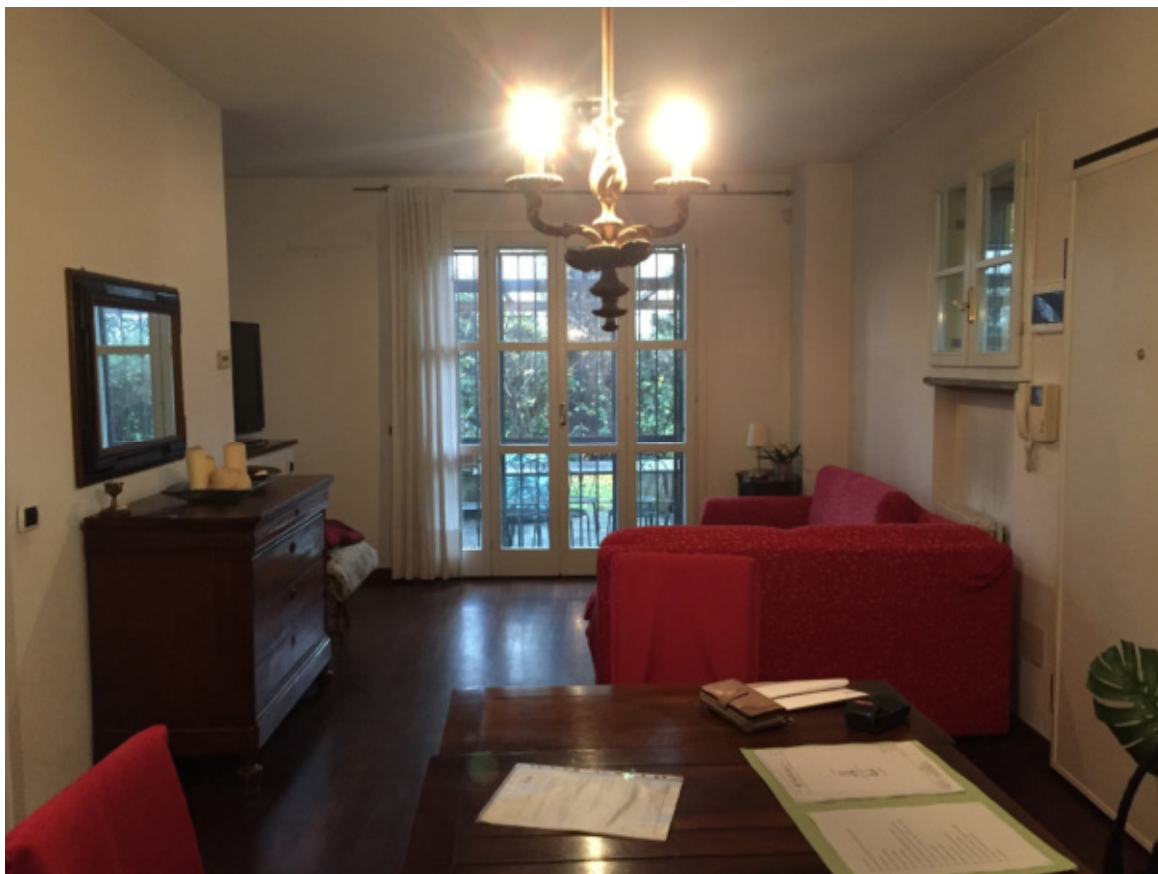
Foto 11 - Soggiorno