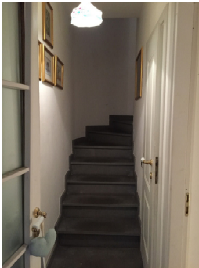
Foto 20 - Scala di accesso al primo piano