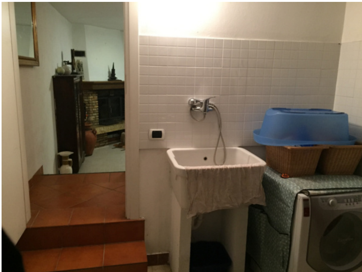
Foto 39 - Lavanderia e disimpegno