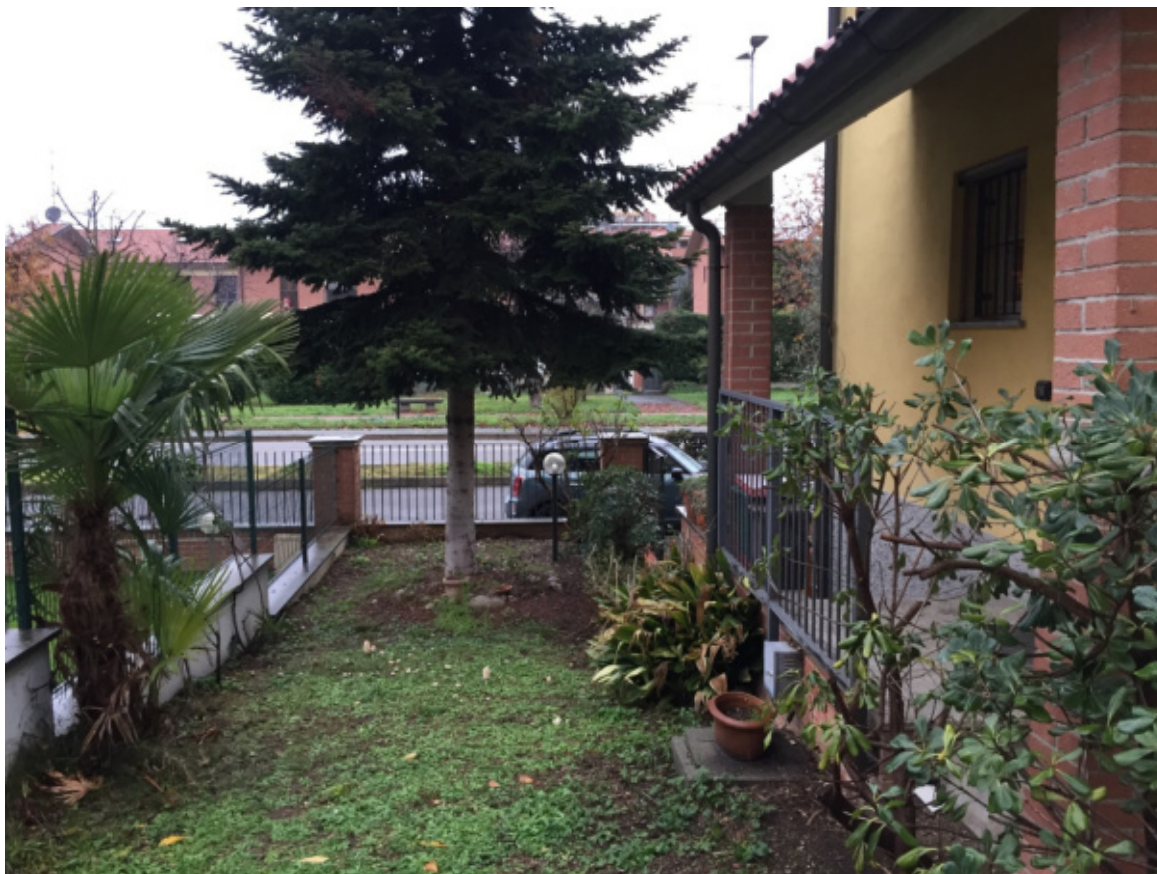
Foto 05 - Giardino esclusivo della villetta