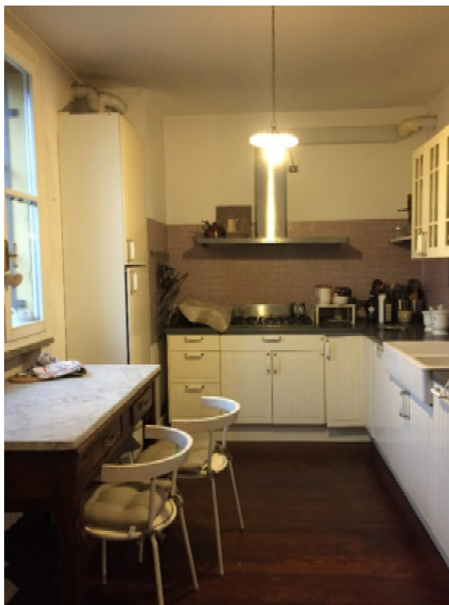
Foto 18 - Cucina