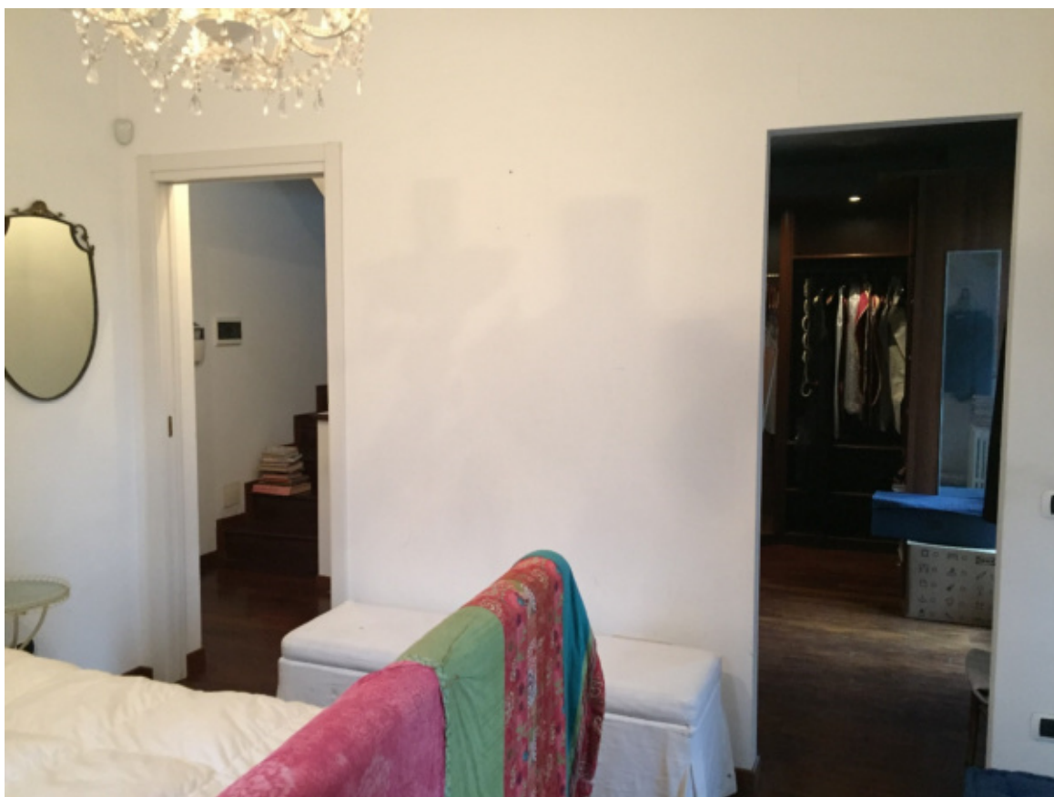
Foto 26 - Camera