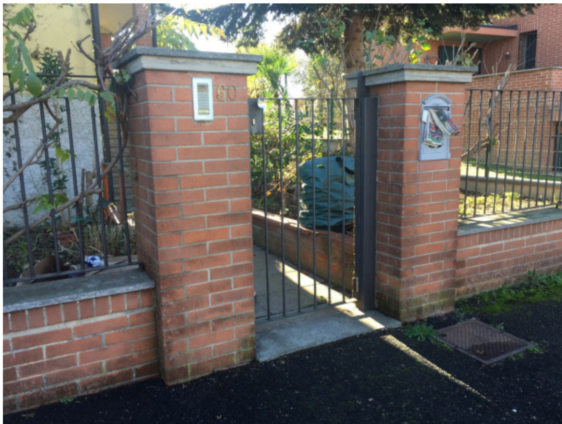
Foto 03 - Accesso alla villetta in via Madonnina al civico 60