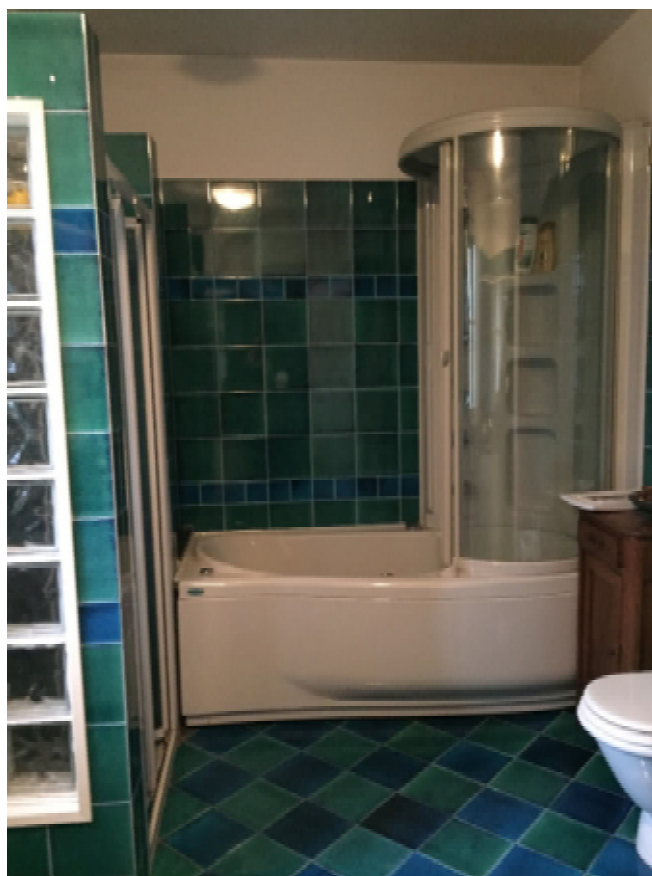
Foto 30 - Bagno