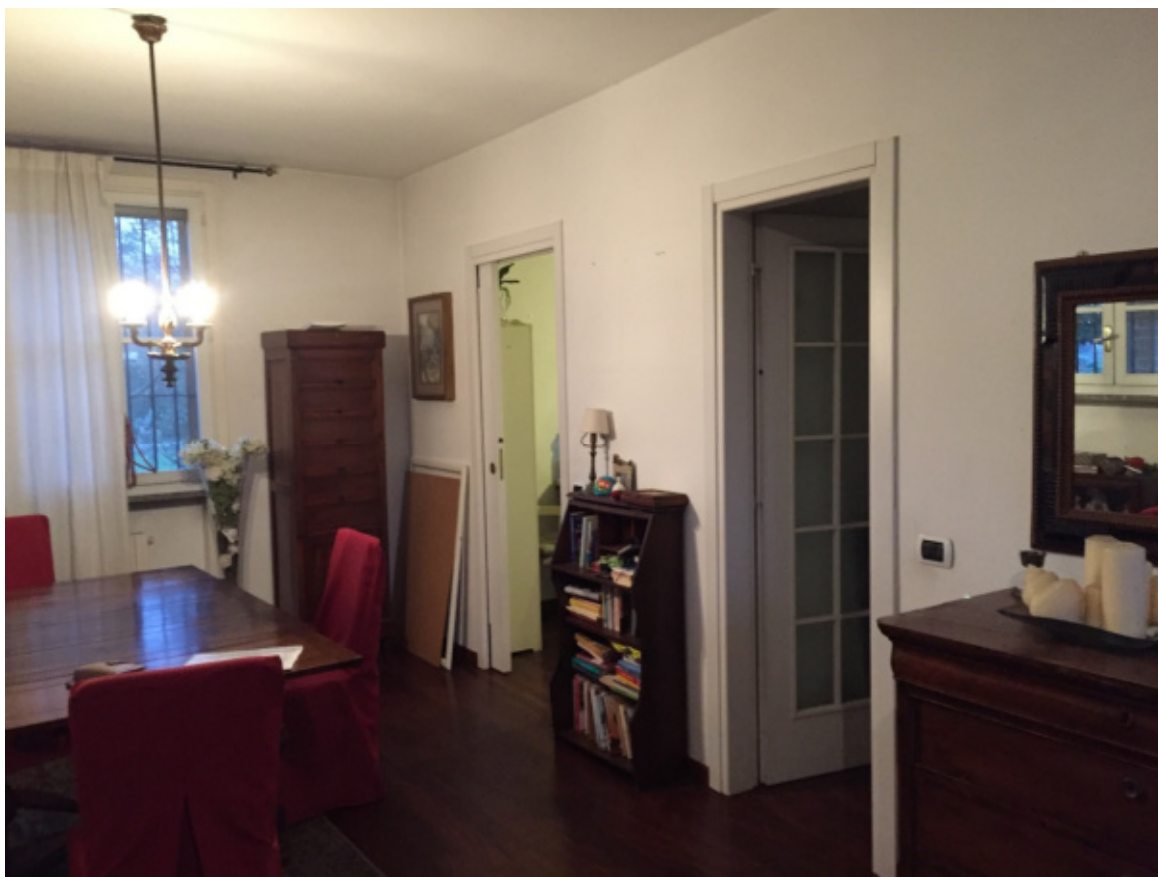
Foto 14 - Soggiorno