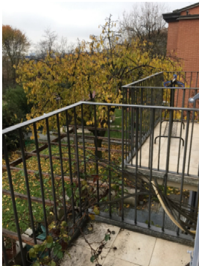
Foto 31 - Balconi