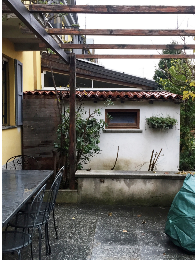
Foto 43 - Capanno degli attrezzi nel giardino esclusivo