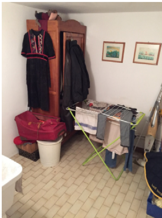
Foto 36 - Lavanderia