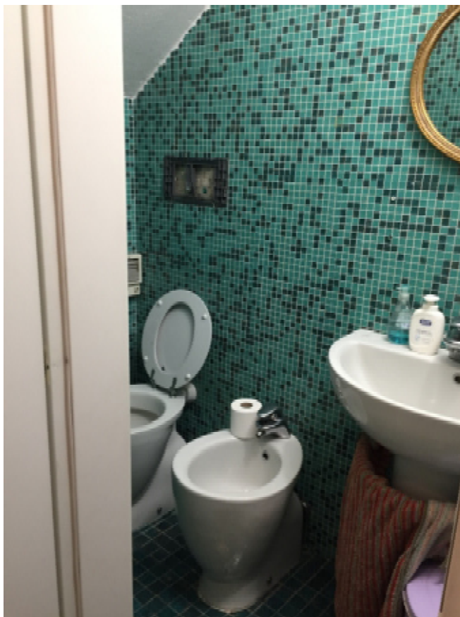
Foto 19 - Bagno