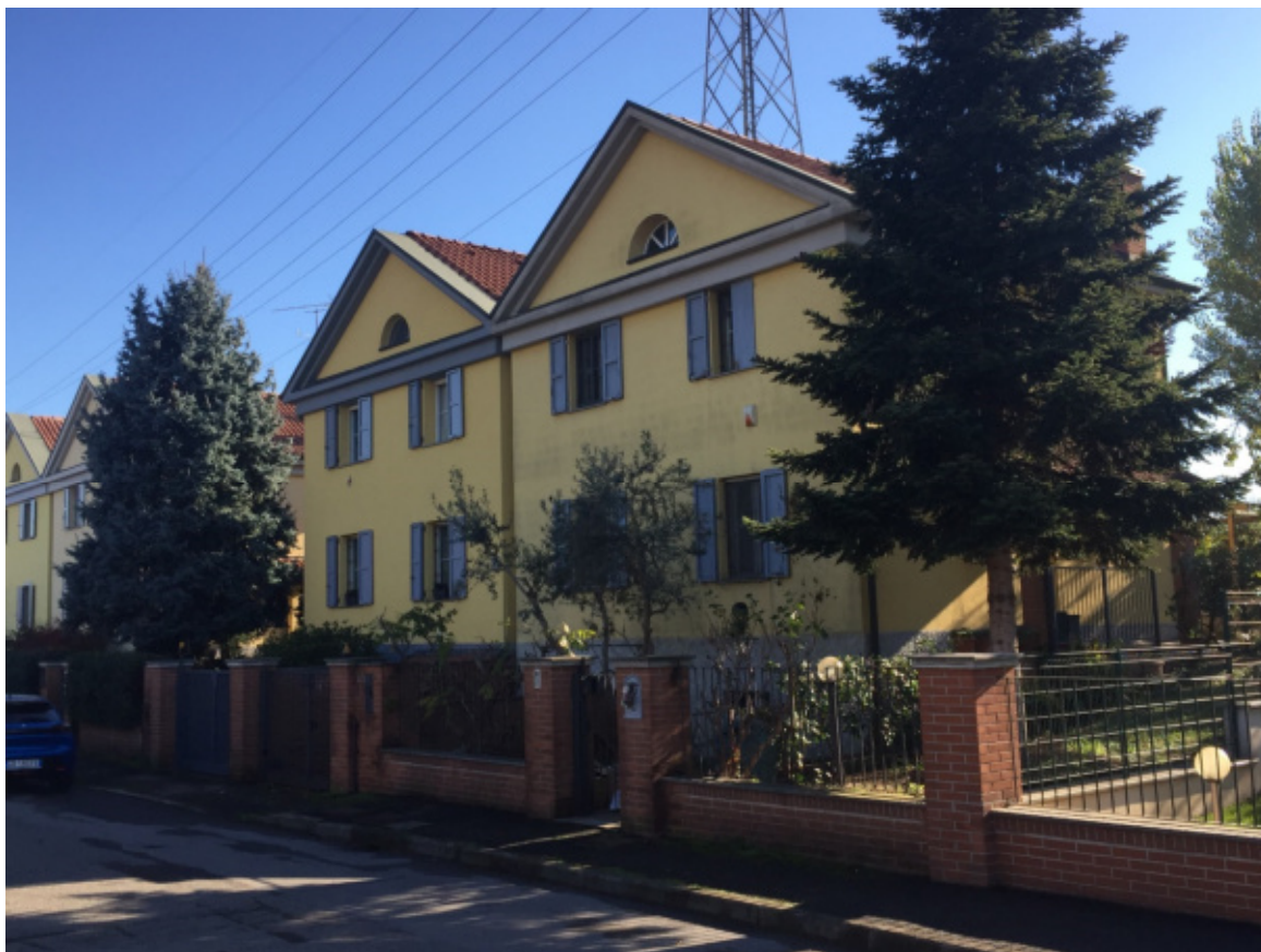
Foto 01 - La villetta su via Madonnina