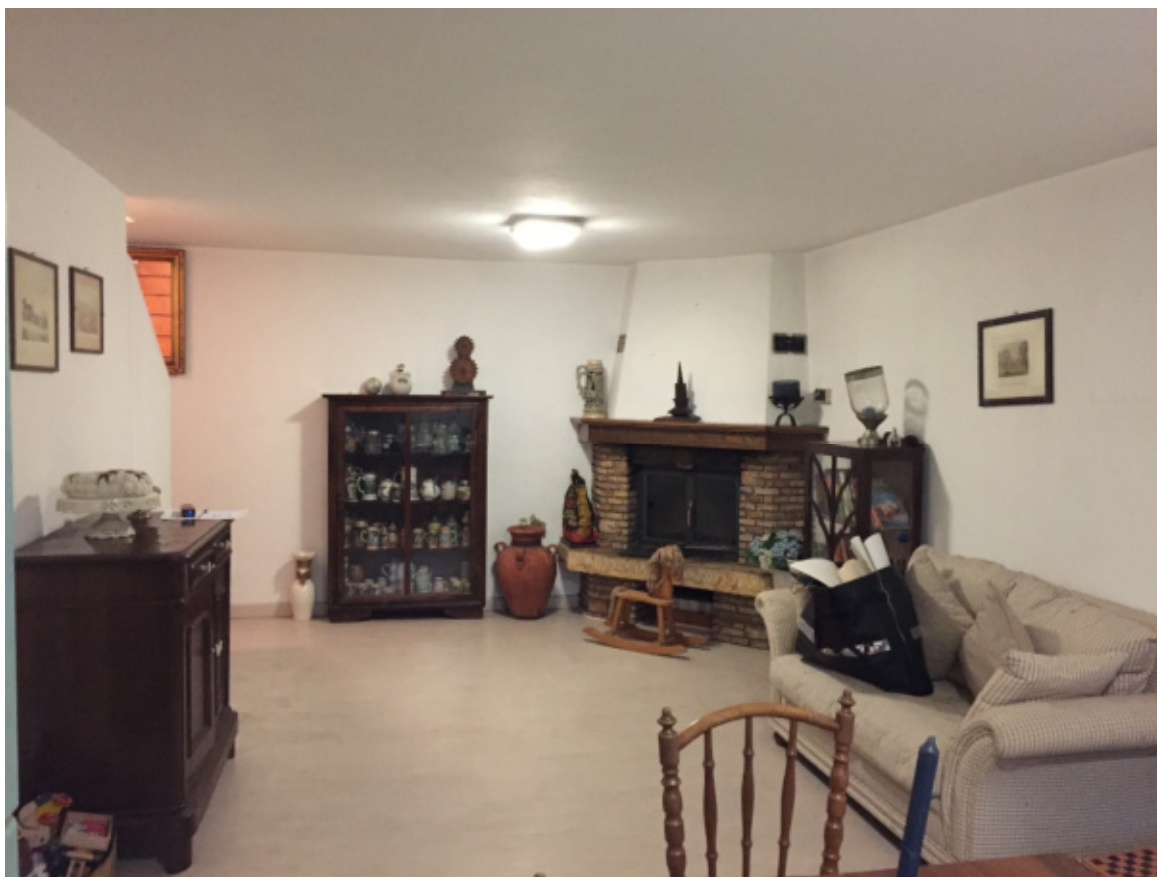
Foto 38 - Taverna al primo piano seminterrato