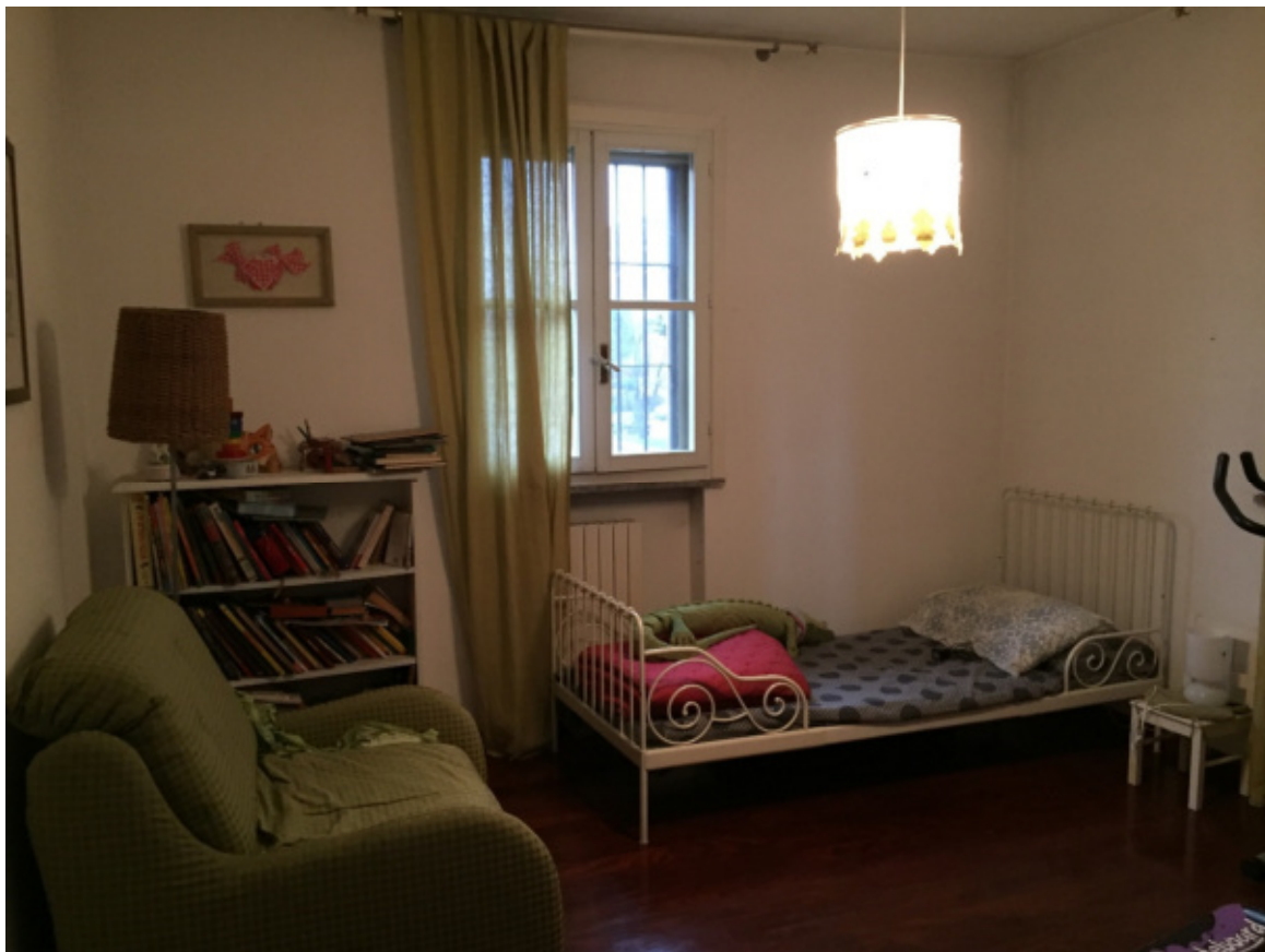
Foto 23 - Camera