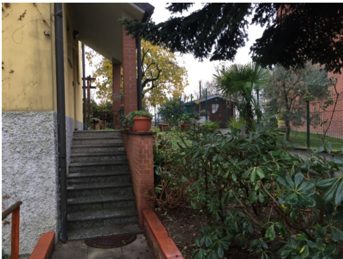
Foto 04 - Vialetto d'accesso e porticato d'ingresso alla villetta