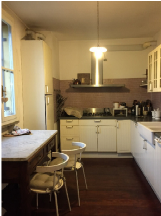
Foto 17 - Cucina