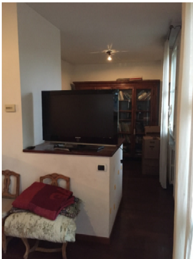
Foto 15 - Soggiorno