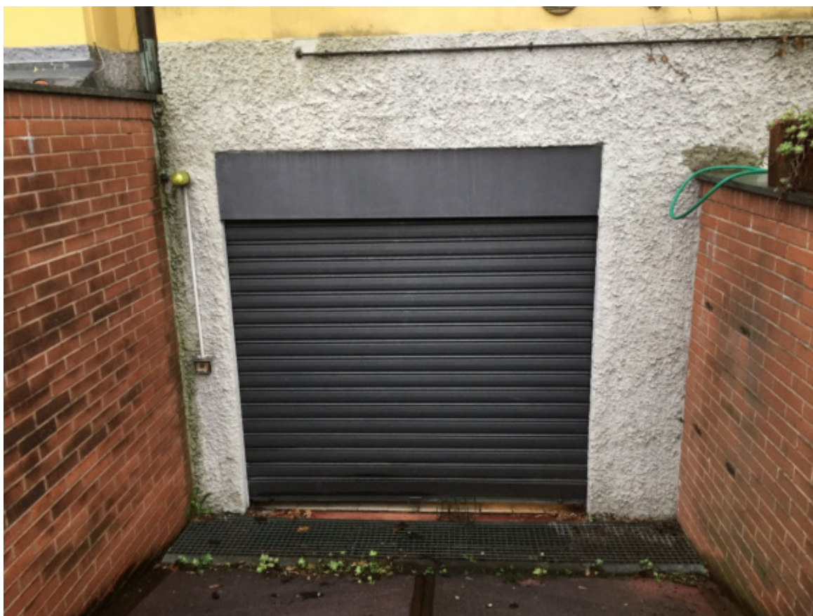
Foto 42 - Box e rampa di accesso dal piano terra