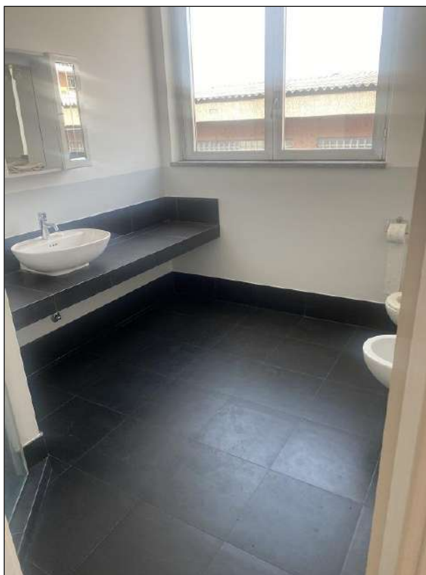
BAGNO - VISTA FOTOGRAFICA 20)