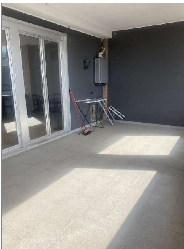
LOGGIATO - VISTA FOTOGRAFICA 22)