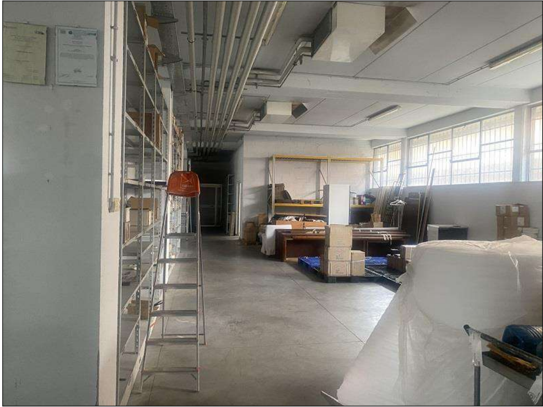
INTERNO LABORATORIO - VISTA FOTOGRAFICA 8)