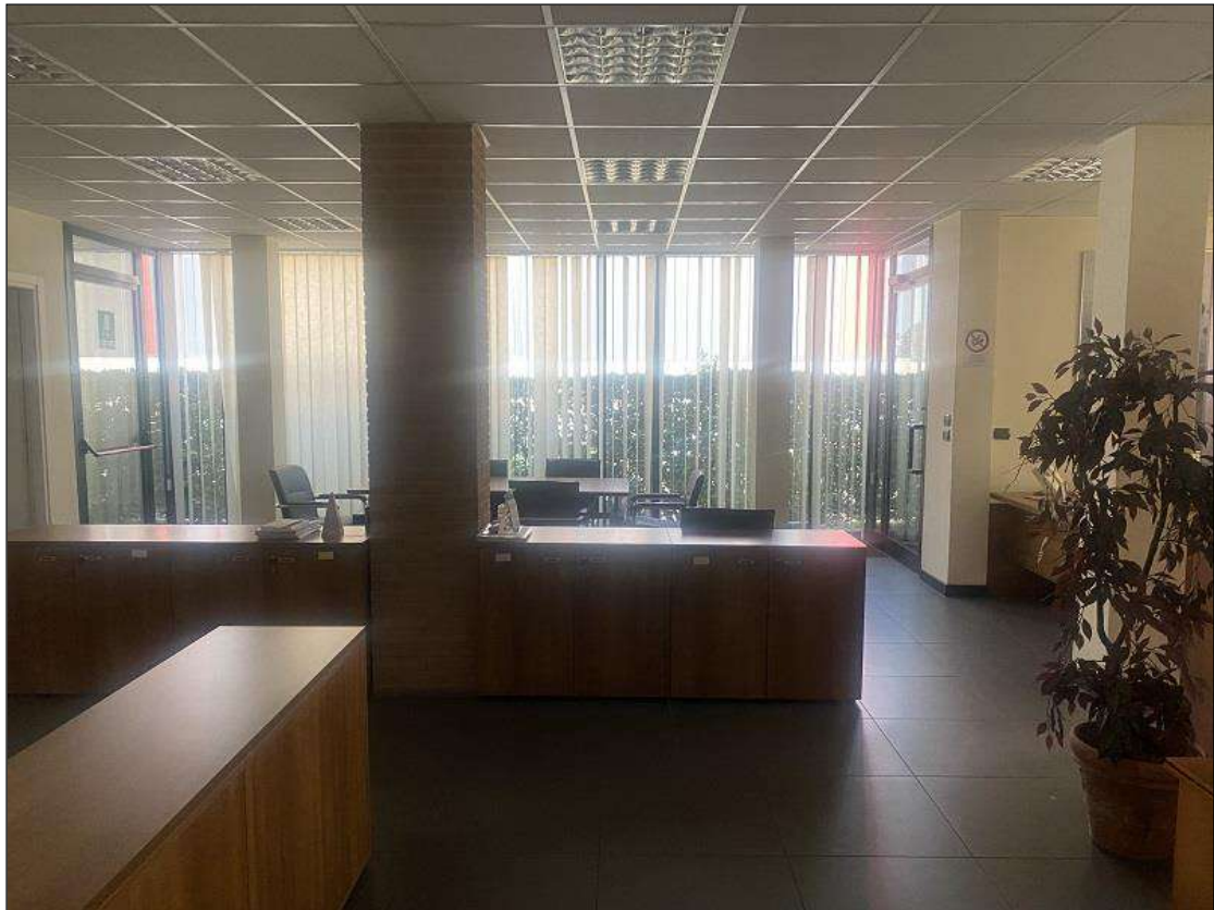
UFFICIO - VISTA FOTOGRAFICA 12)