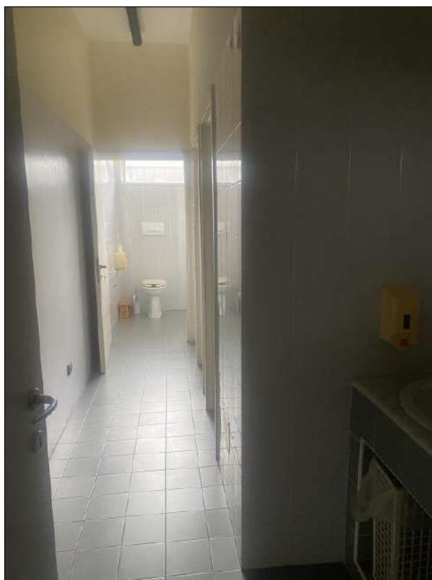
SERVIZI IGIENICI - VISTA FOTOGRAFICA 10)