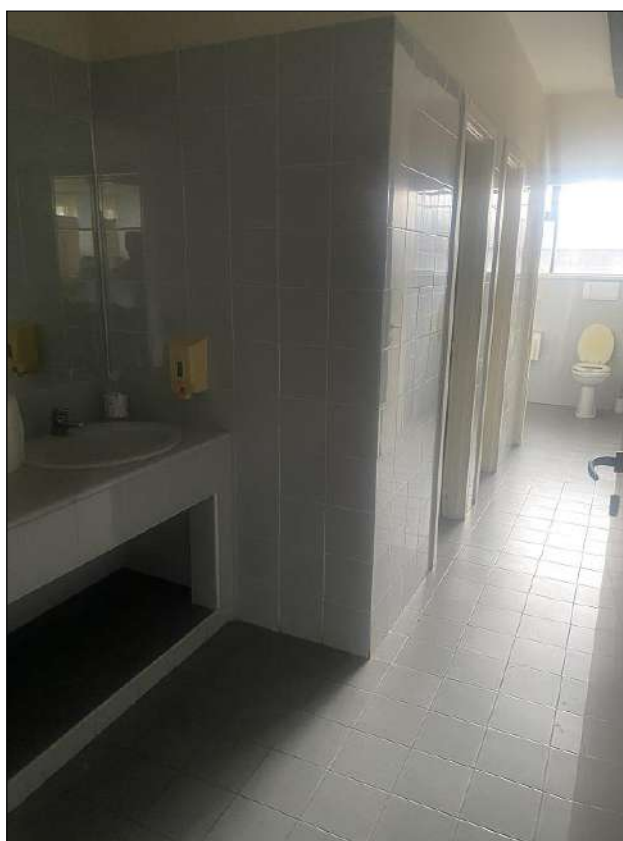
SERVIZI IGIENICI - VISTA FOTOGRAFICA 11)