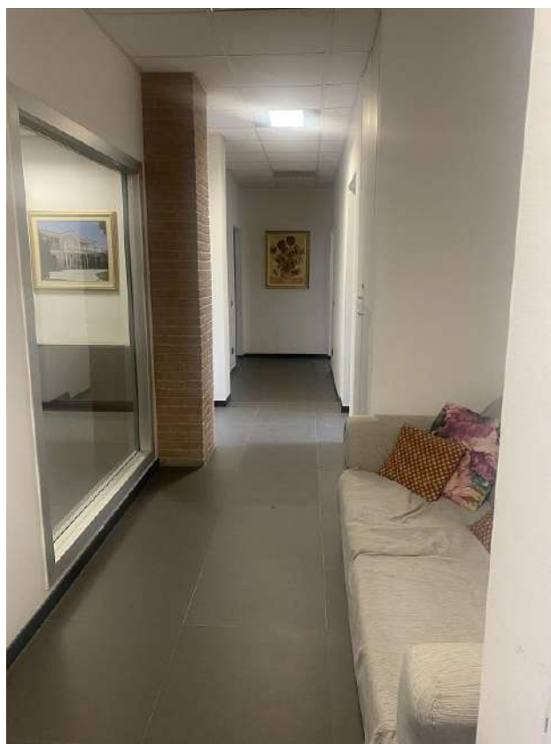
CORRIDOIO DI ACCESSO AL SUB. 702 - VISTA FOTOGRAFICA 17)