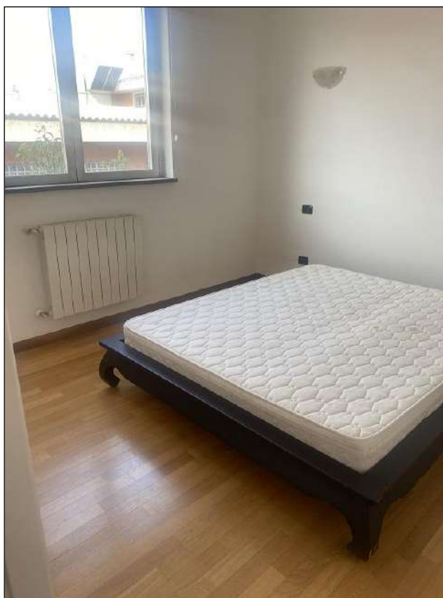
CAMERA - VISTA FOTOGRAFICA 19)