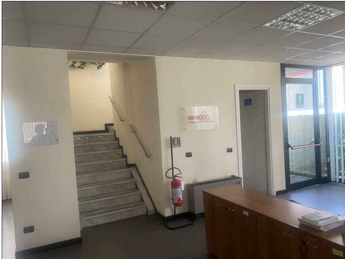
SCALA DI ACCESSO ALL'UFFICIO SUB. 715 PIANO PRIMO (VISTA FOTOGRAFICA 14)