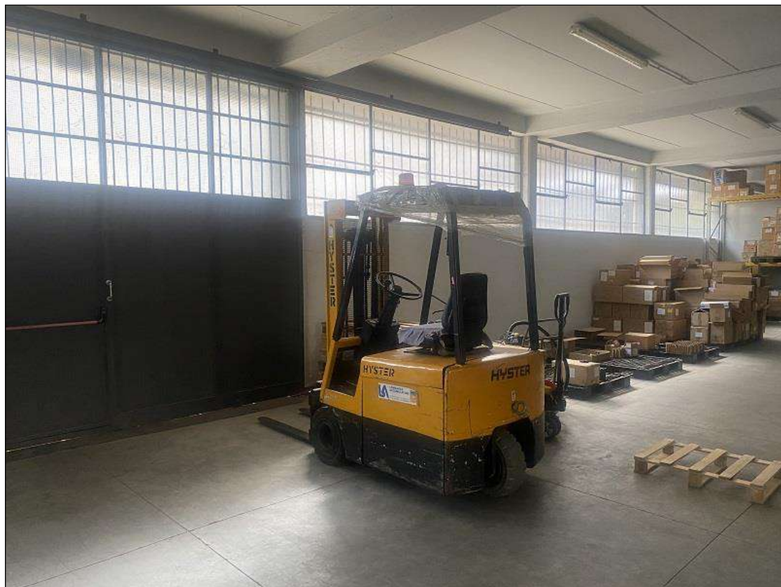
INGRESSO LABORATORIO - VISTA FOTOGRAFICA 7)