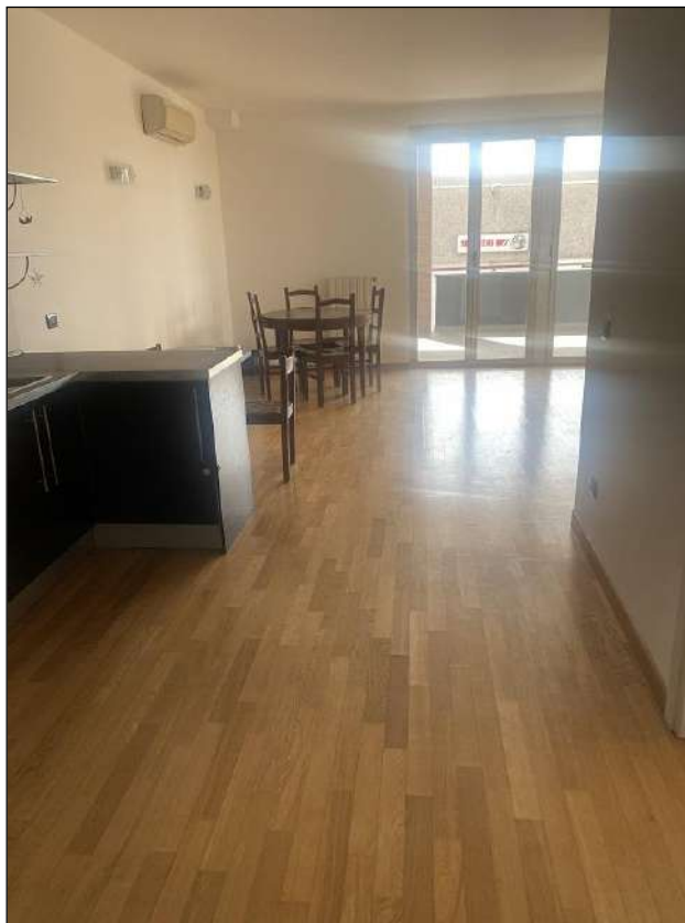
CUCINA/SOGGIORNO - VISTA FOTOGRAFICA 18)