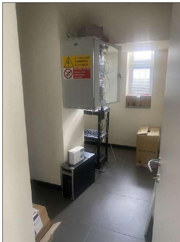
SOTTOSCALA LOCALE QUADRO ELETTRICO - VISTA FOTOGRAFICA 13)