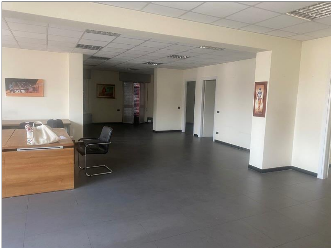
UFFICIO - VISTA FOTOGRAFICA 15)