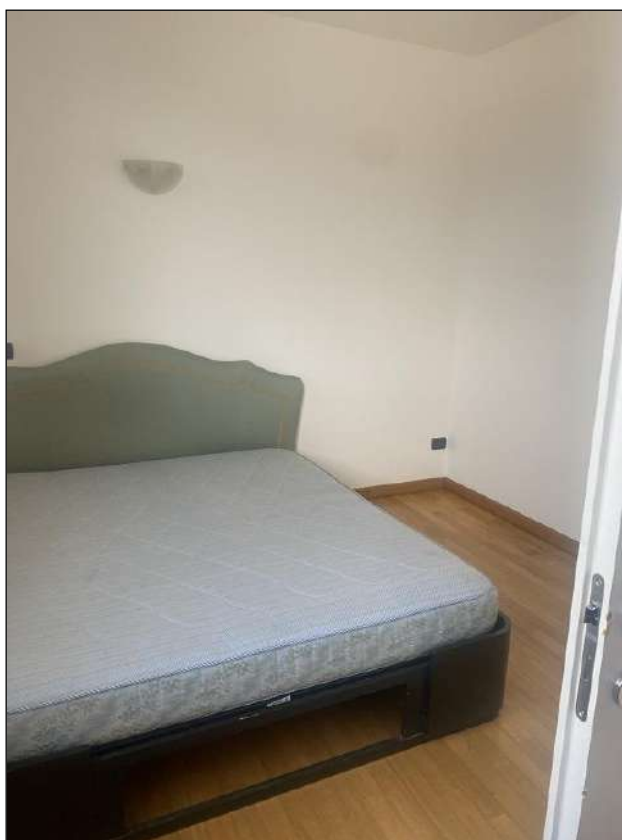
CAMERA - VISTA FOTOGRAFICA 21)