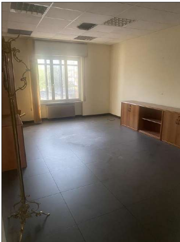
UFFICIO - VISTA FOTOGRAFICA 16)