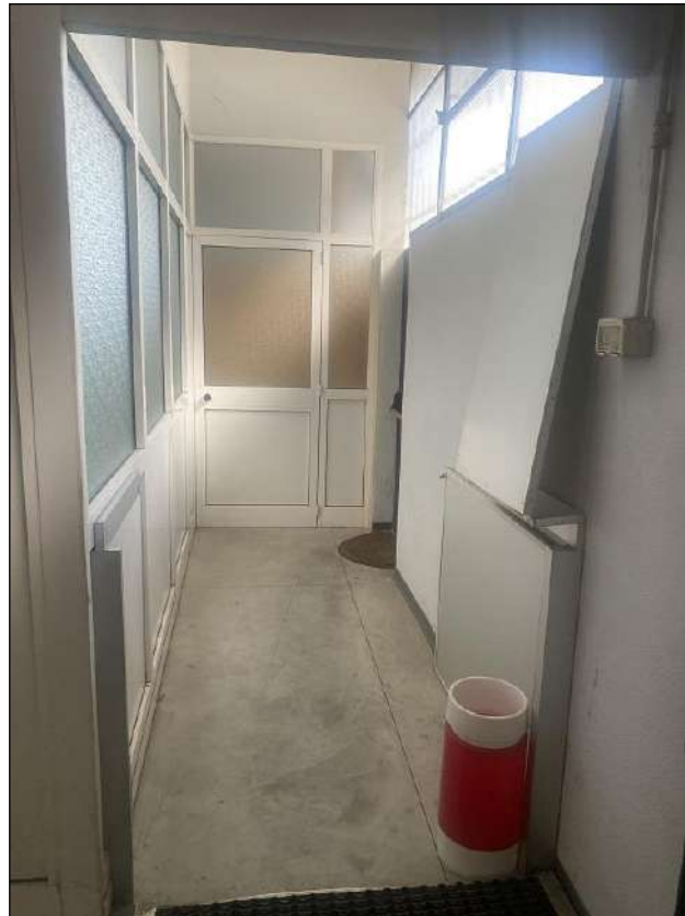
INGRESSO - VISTA FOTOGRAFICA 6)