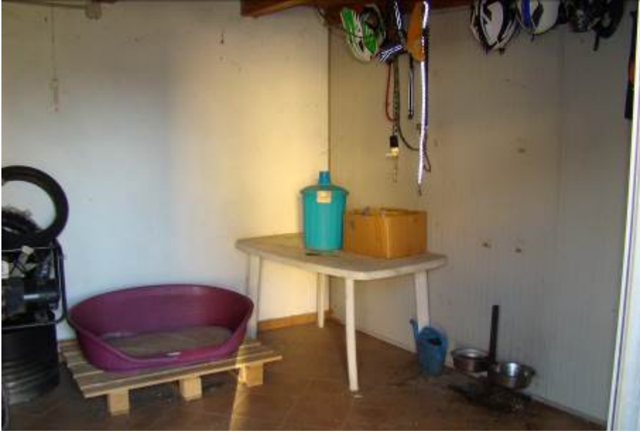
15. Vista interna.