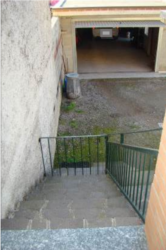
16. Dettaglio della scala esterna sul retro.