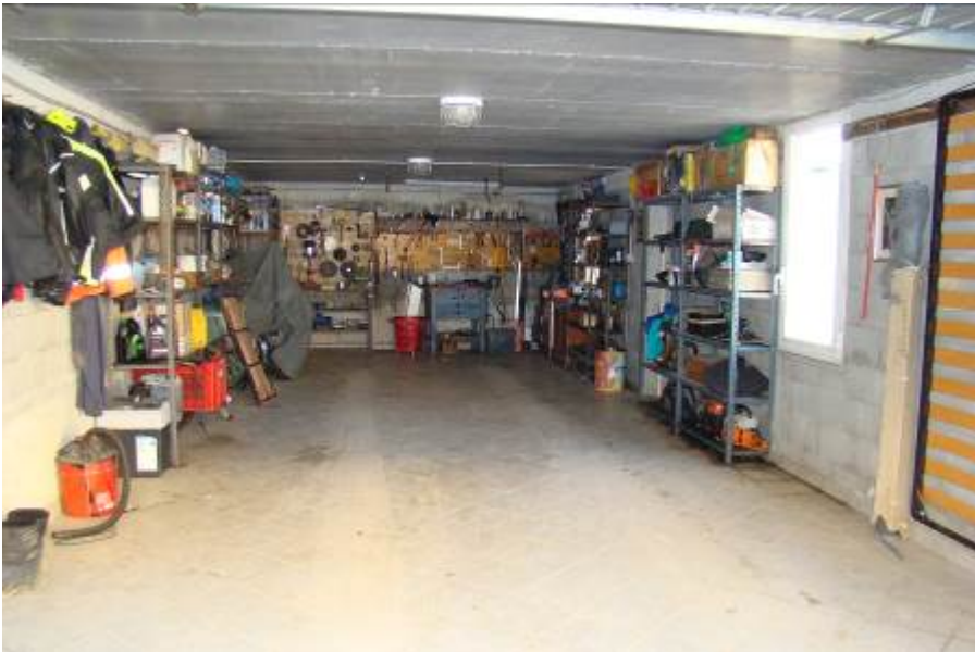
10. Vista interna del box.