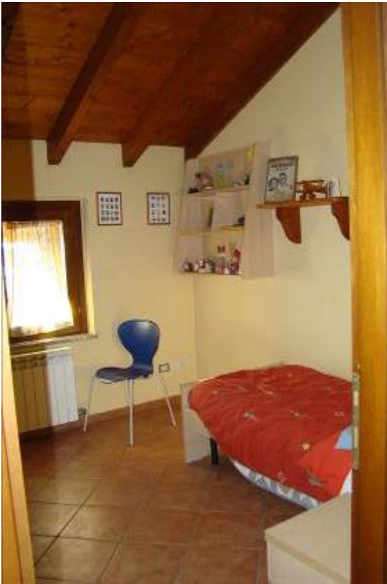
29. Vista della camera (realizzata al posto della sala hobby).