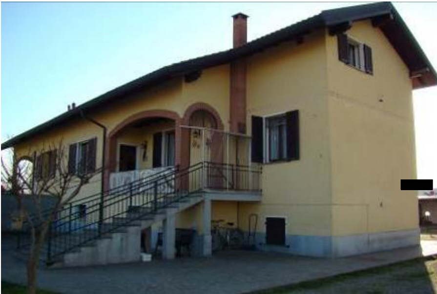
6. Vista della facciata principale e della laterale.