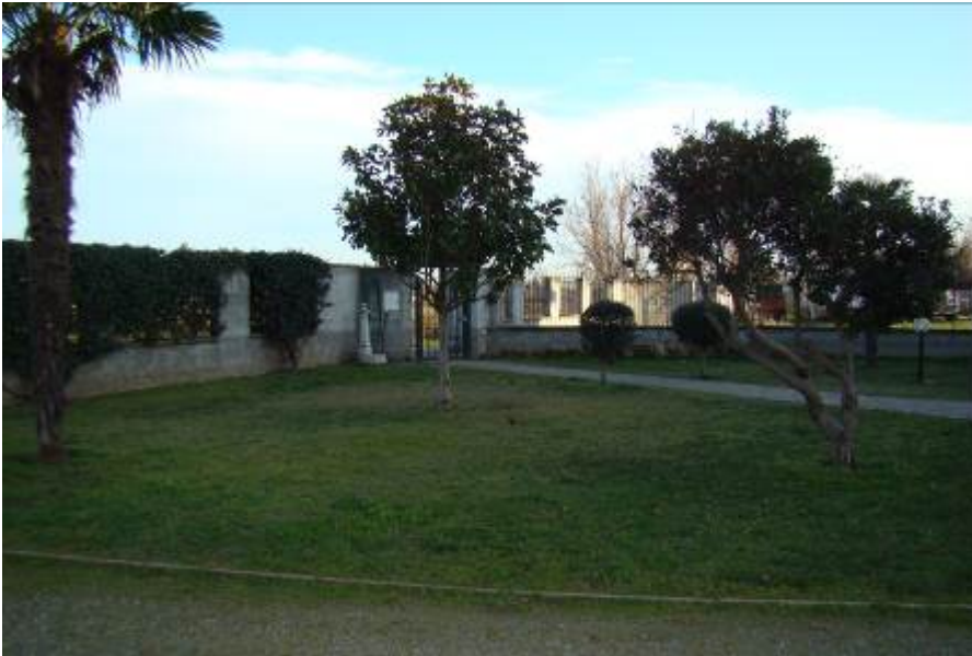
8. Vista del giardino.