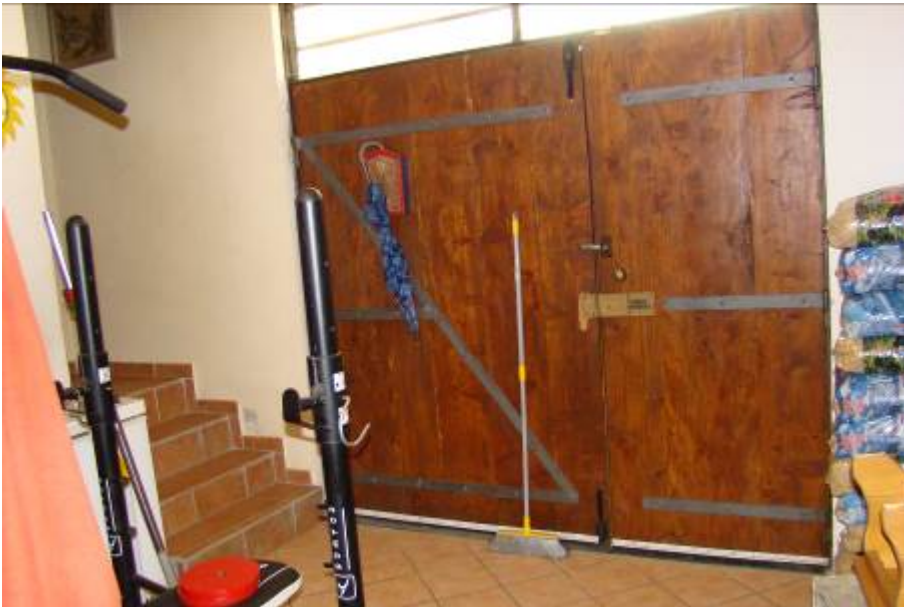
34. Dettaglio del portone che conduce sul retro.