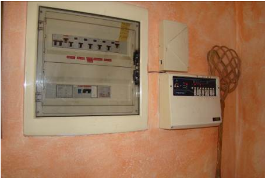
38. Dettaglio dell'impianto elettrico e antifurto.