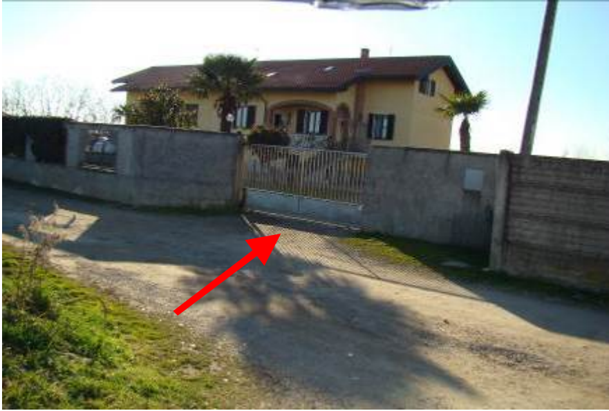
1. Rilievo fotografico del contesto. Vista su strada con indicazione dell'accesso carrabile.