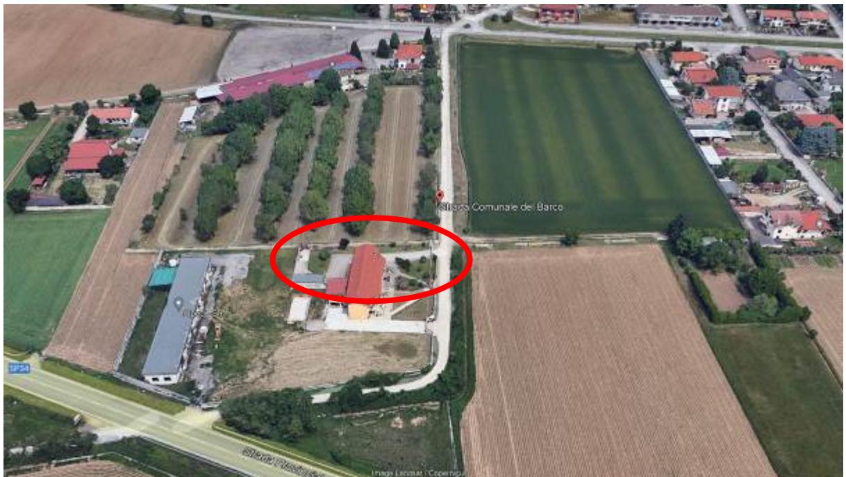
2. Vista aerea del contesto con individuazione dell'edificio.