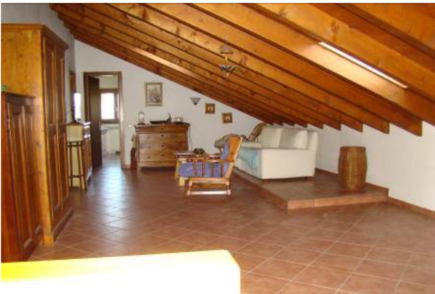
26. Vista dell'open space a piano primo.