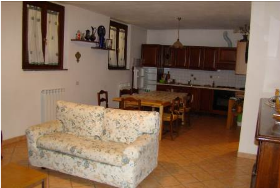
35. Vista del soggiorno/angolo cottura realizzato nel seminterrato.