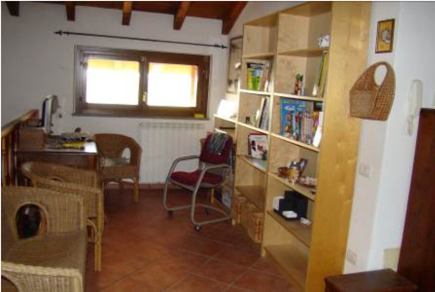
28. Vista della zona adiacente alla scala.