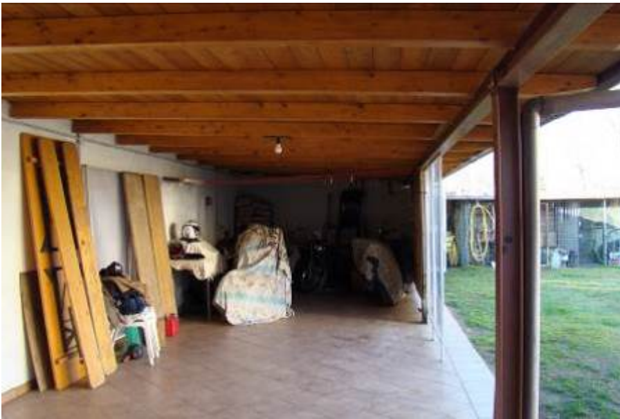
12. Dettaglio della tettoia.