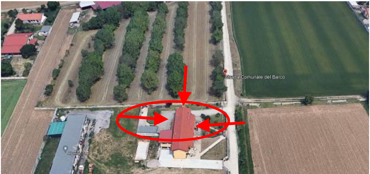
3. Vista aerea del contesto con individuazione degli affacci dell'immobile.