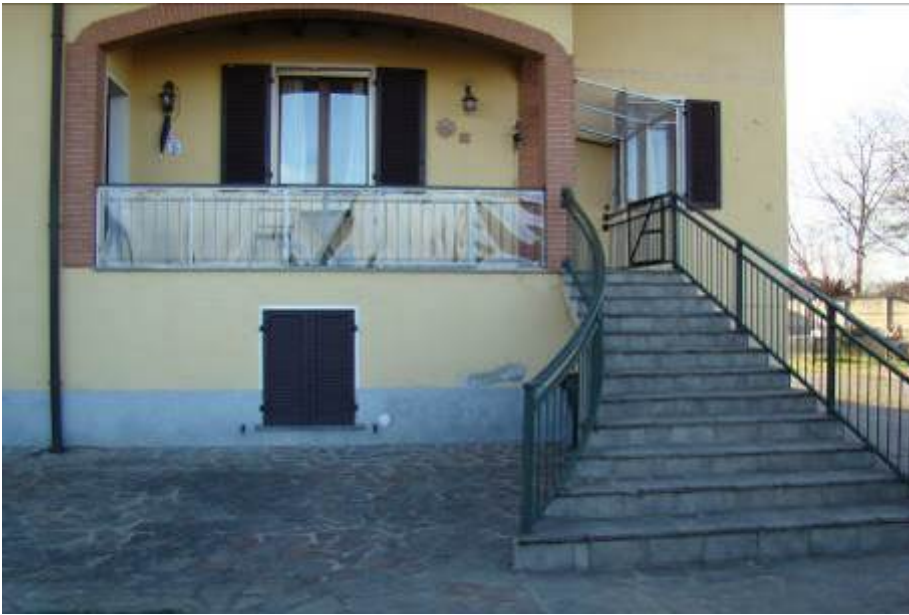
17. Dettaglio della scala in facciata.