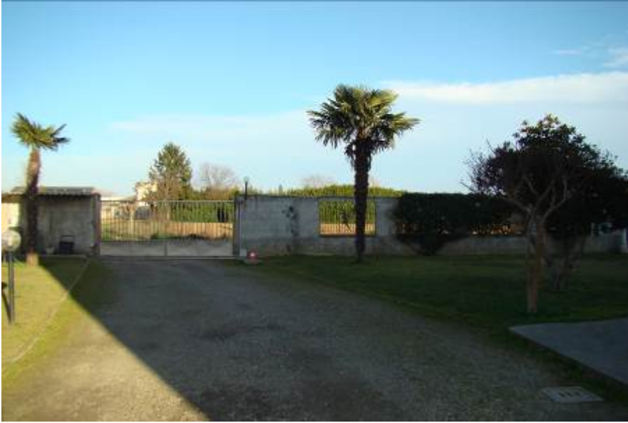
5. Vista dall'interno dell'accesso carrabile.