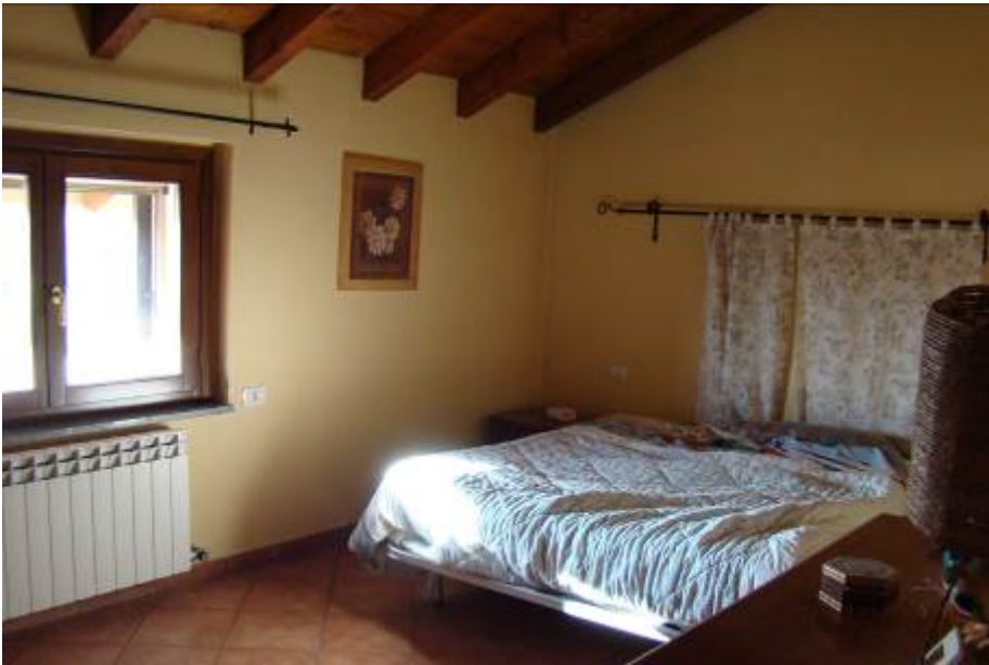
30. Vista dell'altra camera a piano primo.