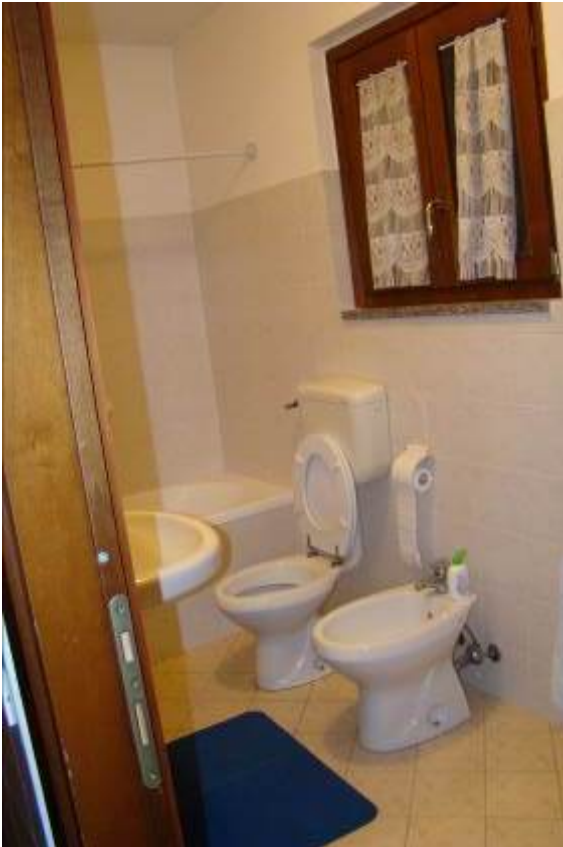
36. Vista del bagno realizzato nel seminterrato.