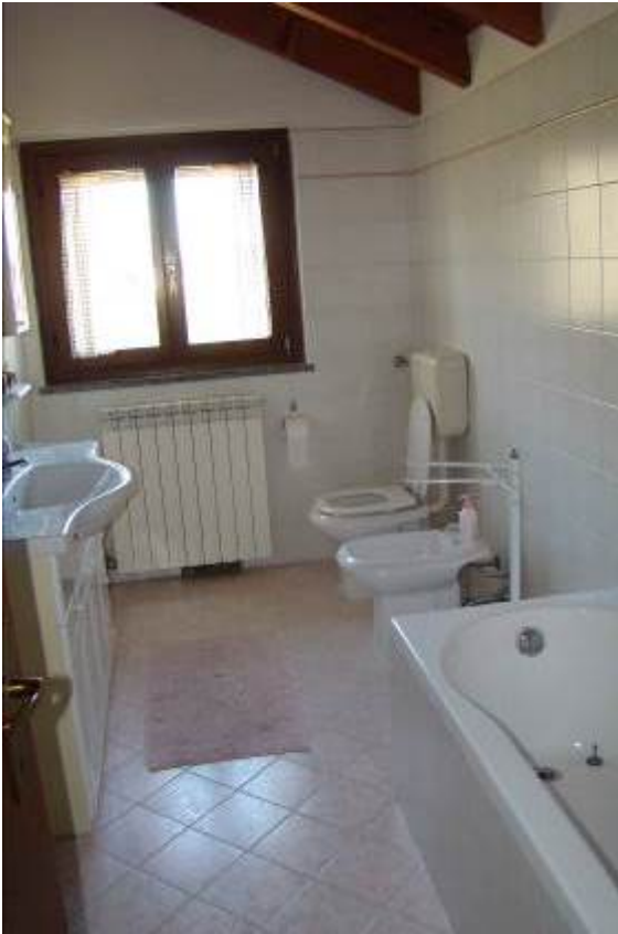
31. Vista del bagno a piano primo.