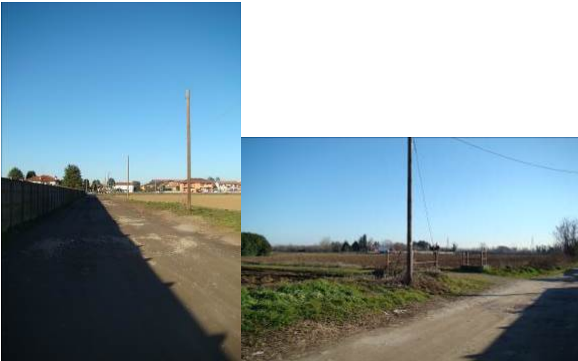
2. Rilievo fotografico del contesto. Viste della strada.