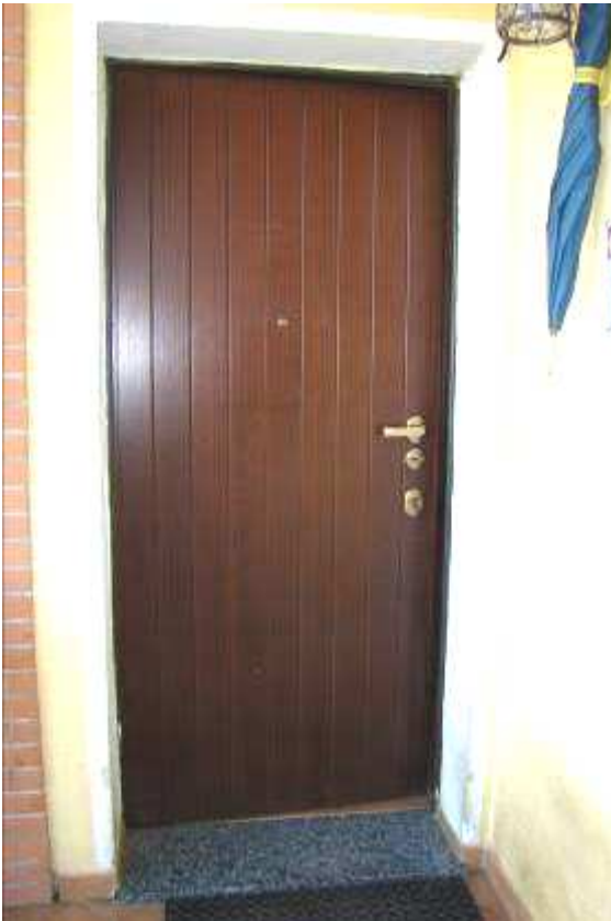
18. Dettaglio della porta principale di accesso al villino.