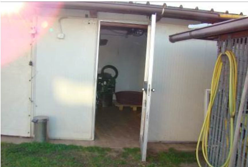
14. Dettaglio della porta nella chiusura laterale.