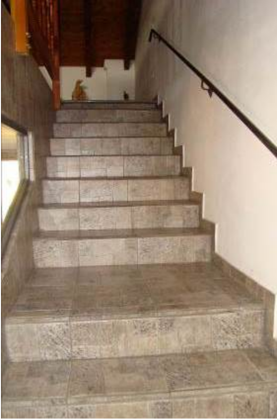
25. Vista della scala che conduce al piano primo.