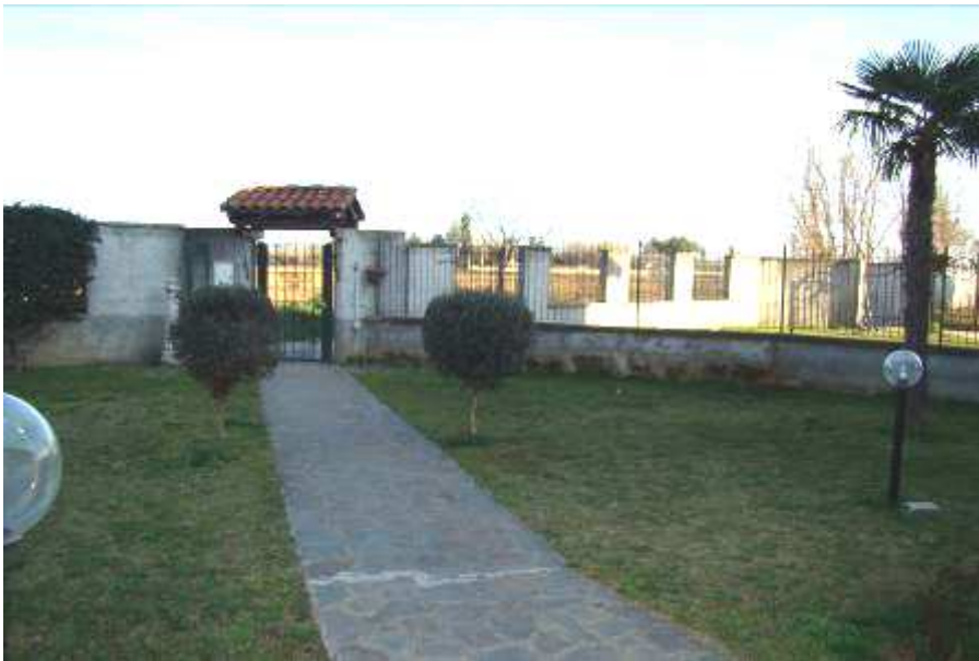
4. Vista dall'interno verso l'accesso pedonale.