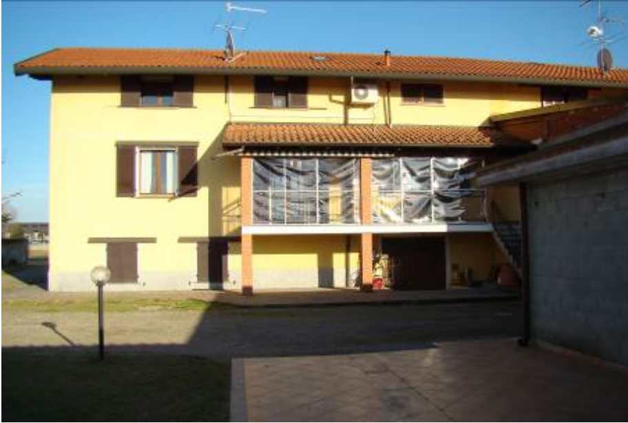
7. Vista della facciata sul retro.