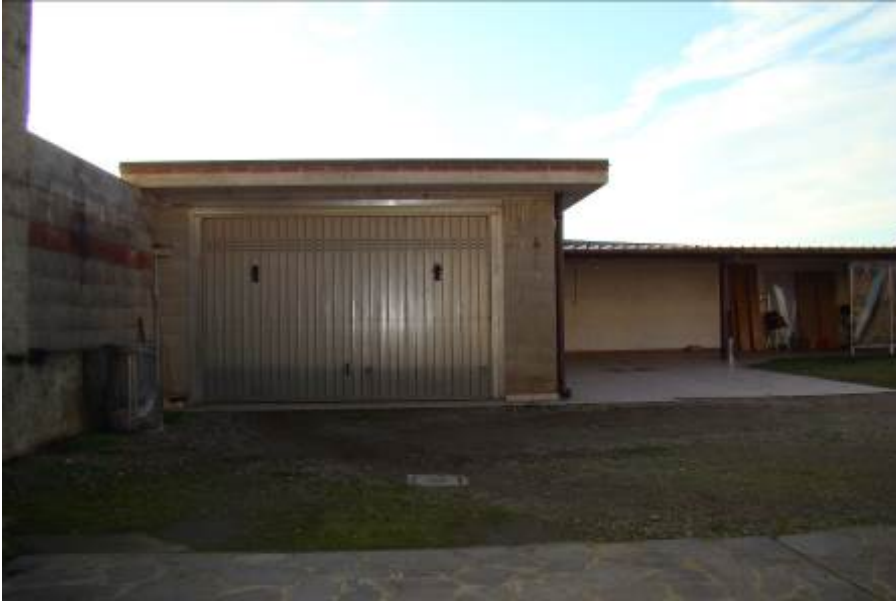
9. Vista del corpo box.