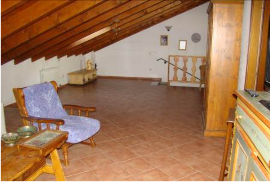
27. Vista dell'open space a piano primo, verso la scala.