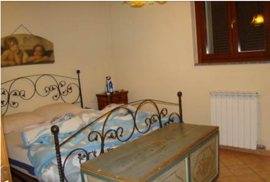
37. Vista della camera realizzata nel seminterrato.