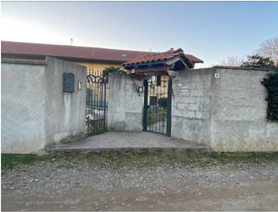
3. Rilievo fotografico del contesto. Vista del cancello di accesso pedonale.