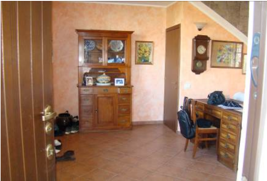
19. Vista dell'ingresso.