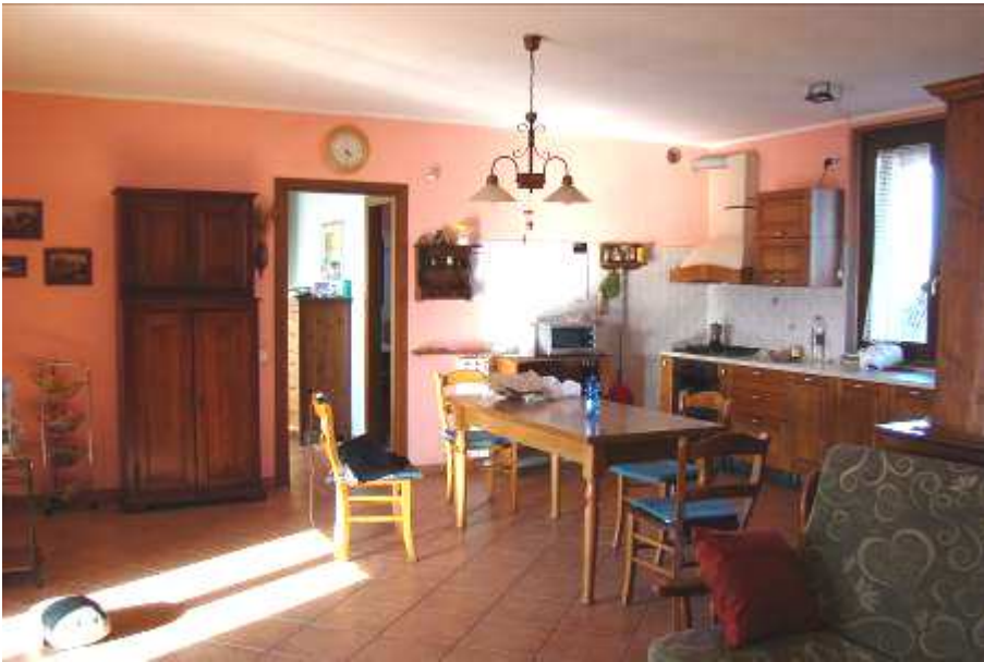
21. Vista della cucina.