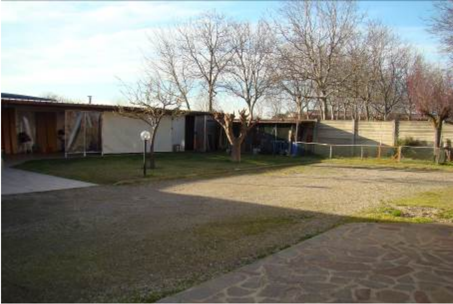
11. Vista della tettoia contigua al box.