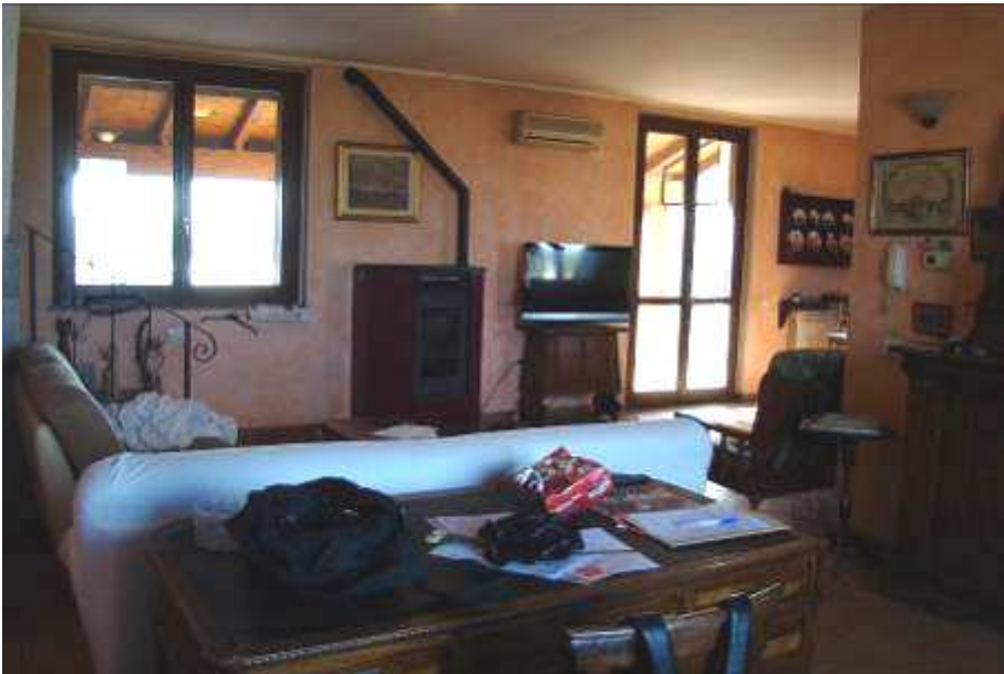
20. Vista del soggiorno.