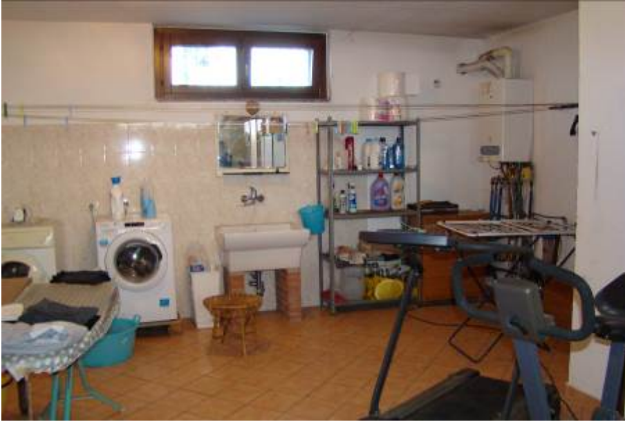
33. Vista interna della cantina trasformata in lavanderia/locale hobby.