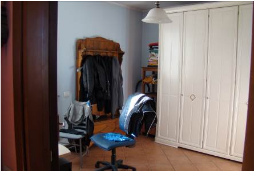
22. Vista della camera.