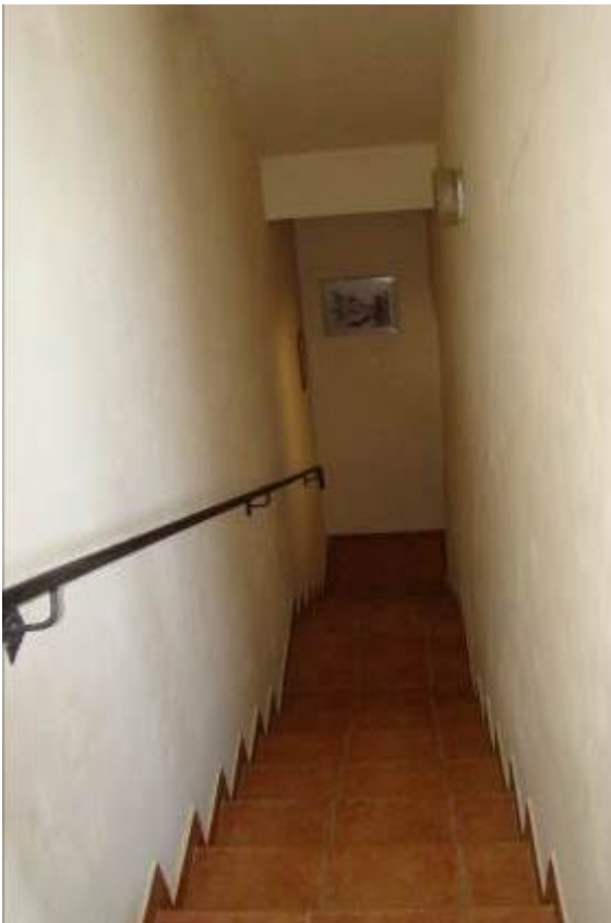
32. Vista della scala che conduce al piano seminterrato.