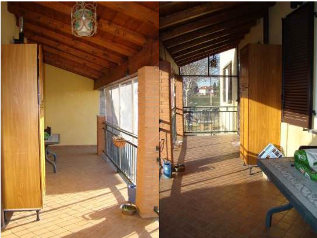
24. Viste del porticato sul retro.