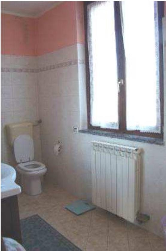
23. Vista del bagno.