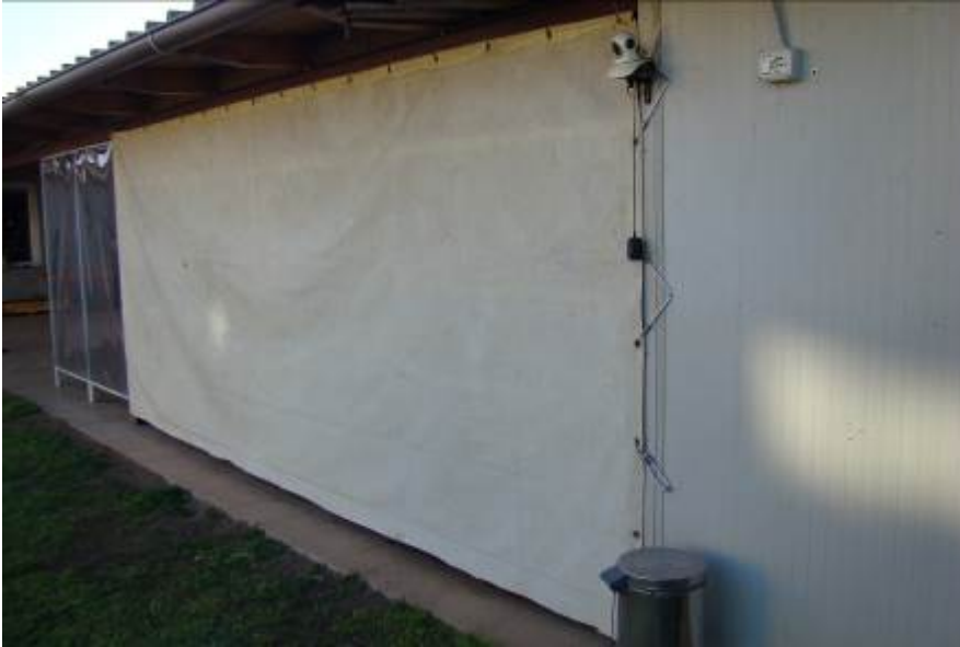
13. Dettaglio della chiusura laterale.