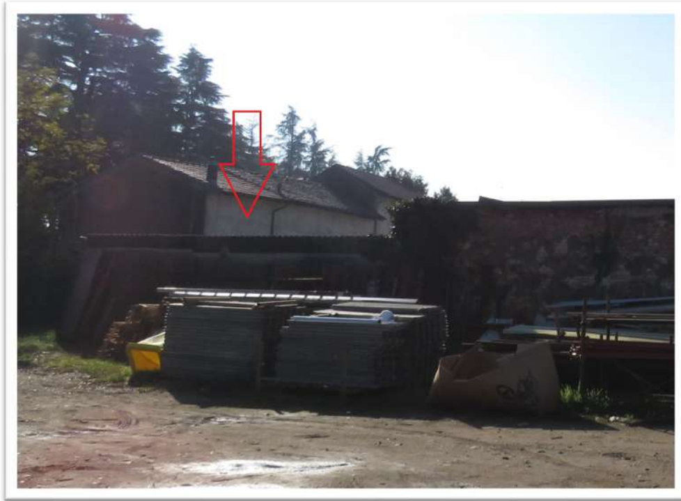
Vista del confine da Nord (sopra) e del Lotto 1 confinante (sotto).