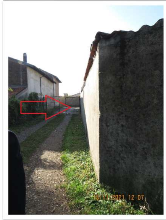
Viste dei confini da Sud-Est (sopra) e da Est (sotto).