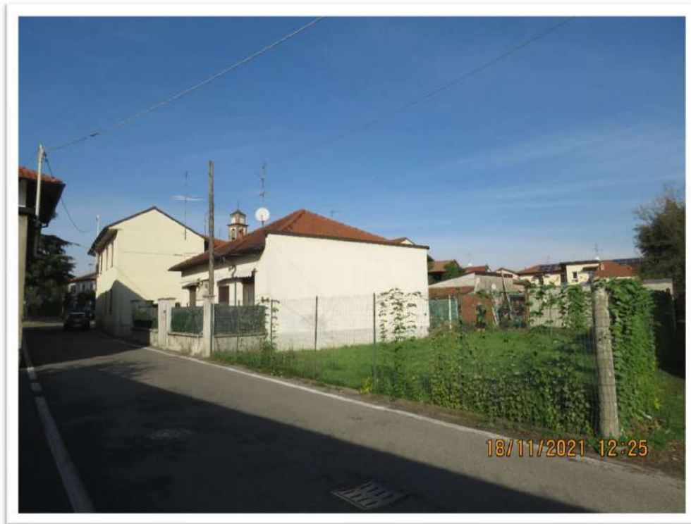
L'intorno: via Isonzo.