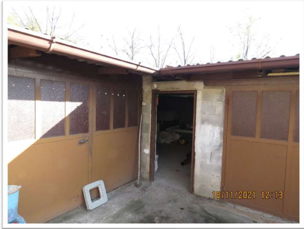
Viste del Lotto n. 2 – Foglio 10 - Mappale 192: box Sub. 4