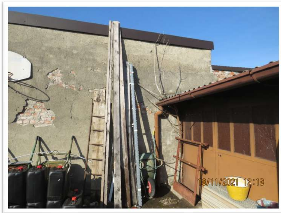
Viste del Lotto n. 2 – Foglio 10 - Mappale 192: vista del confine Nord-Ovest.