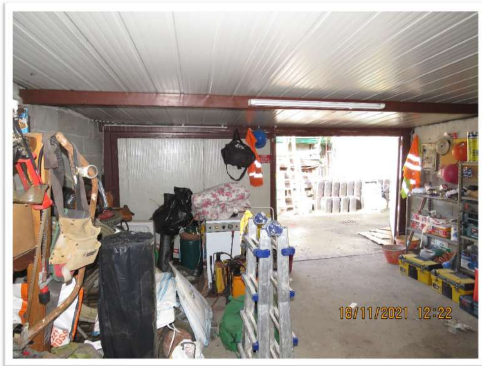
Viste del Lotto n. 2 – Foglio 10 - Mappale 192 : porzione di cortile esterno abusivamente chiusa con copertura e portone di accesso.