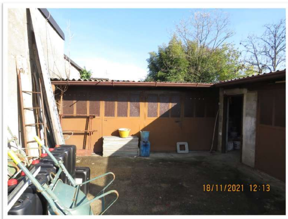
Viste del Lotto n. 2 – Foglio 10 - Mappale 192: box Sub. 2