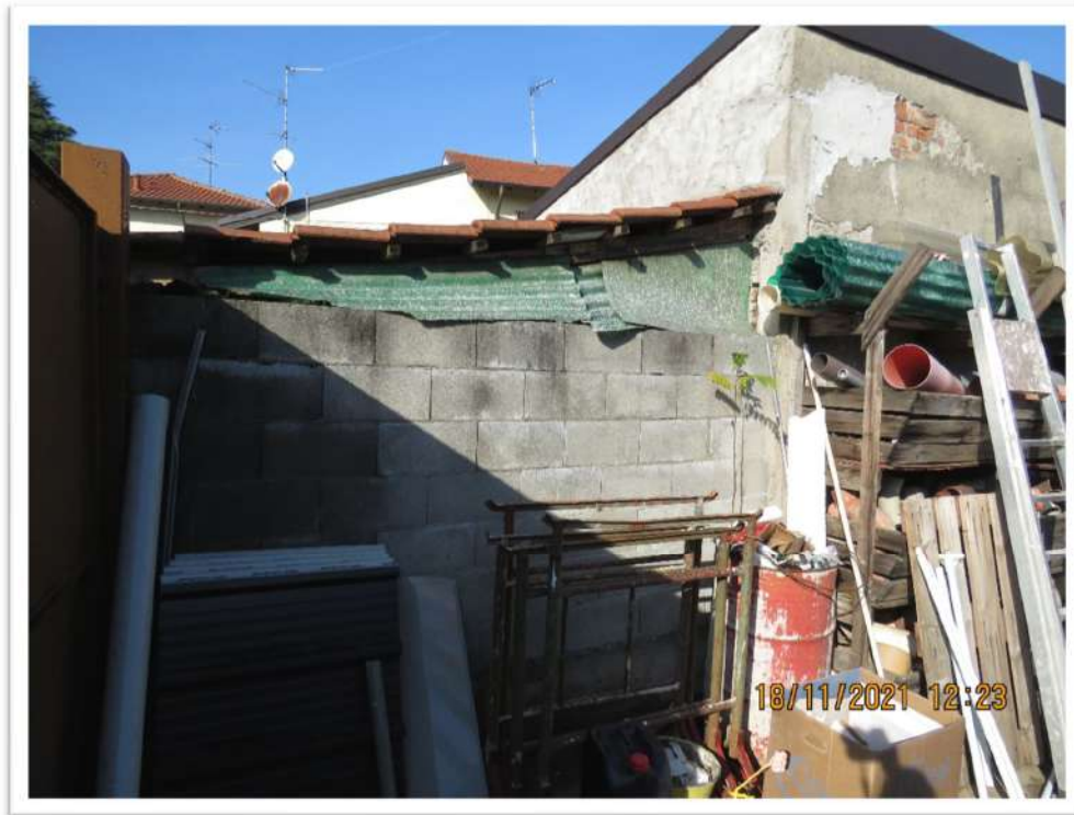
Viste del Lotto n. 2 – Foglio 10 - Mappale 192: vista del confine Nord-Ovest (sopra) e verso Sud-Ovest (sotto: stradina mappale 194 di proprietà di terzi).