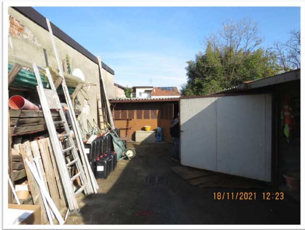
Viste del Lotto n. 2 – Foglio 10 - Mappale 192: cortile interno.