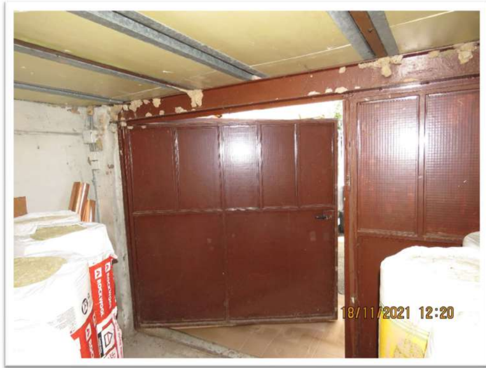
Viste del Lotto n. 2 – Foglio 10 - Mappale 192: box Sub. 3