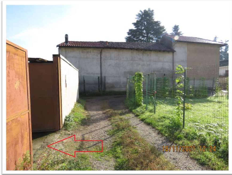
Vista dell'ingresso al Lotto n. 2 - mappale 192 – dal mappale 194 di proprietà di terzi .