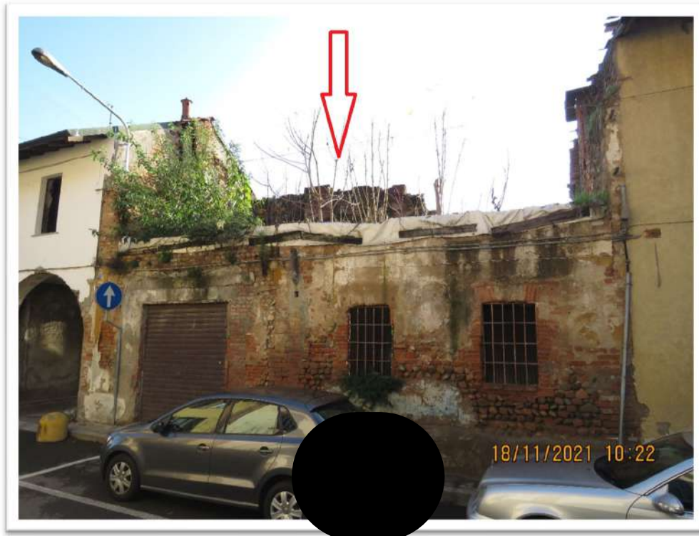
Vista della porzione diroccata del Mappale 159 Sub. 706 e Sub. 7 (è rimasta la sola porzione della facciata del piano terreno e manca tutto il primo piano) (sopra) e della porzione Sub. 705 (sotto).