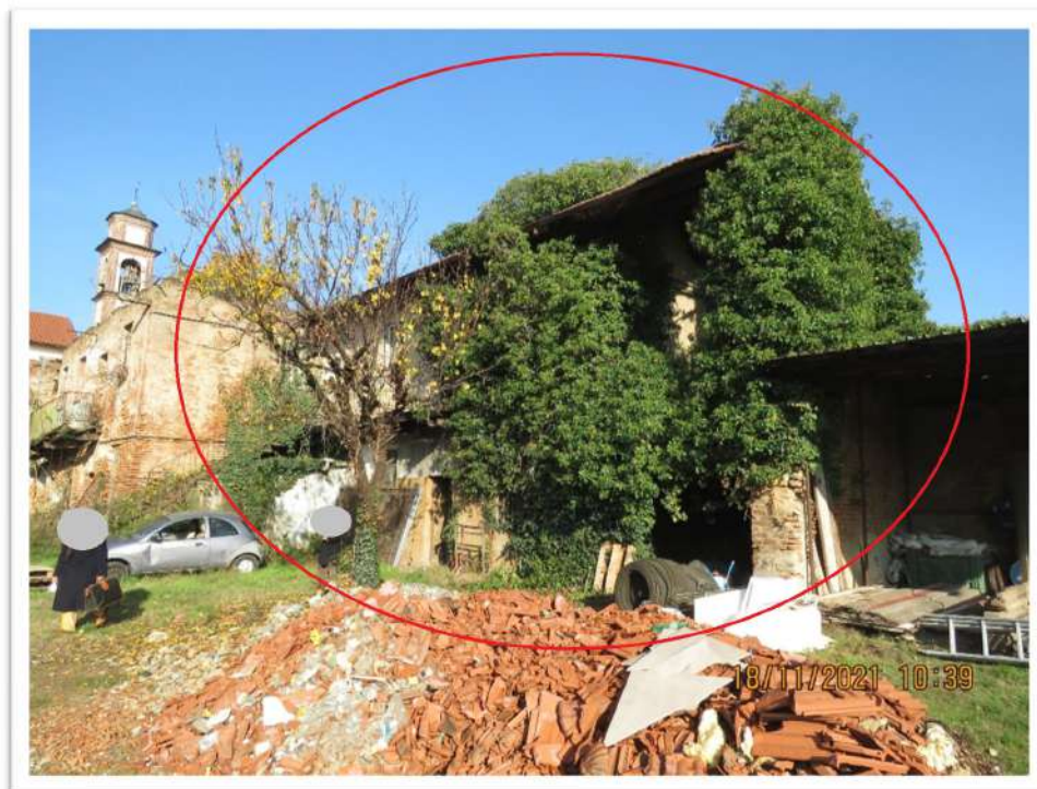
Vista dal cortile interno Mappale 158 (non colpito dal pignoramento de quo e non oggetto di vendita) delle porzioni del Mappale 159 Sub. 704 .