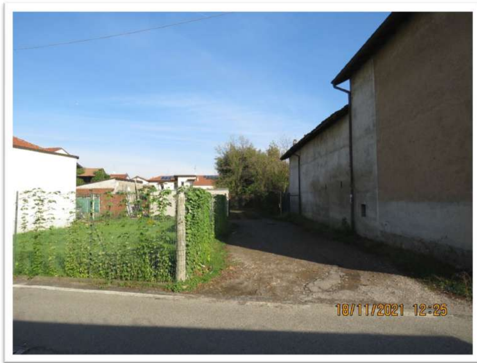
Vista dell'ingresso al cortile interno Mappale 158 (non colpito dal pignoramento de quo e non oggetto di vendita) da via Isonzo.