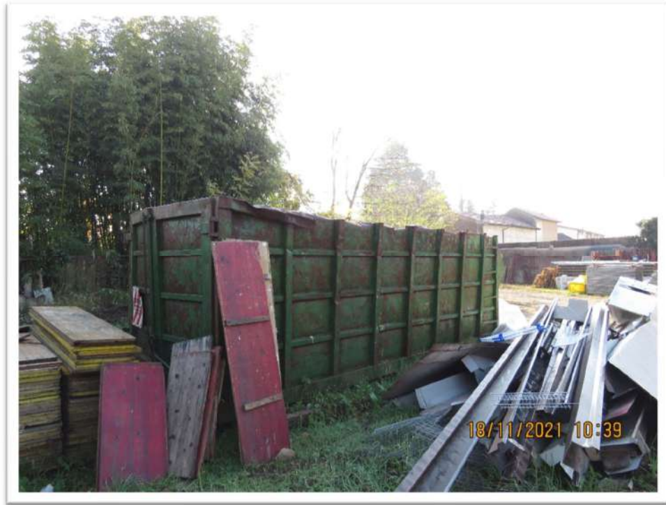
Depositi di materiali vari.