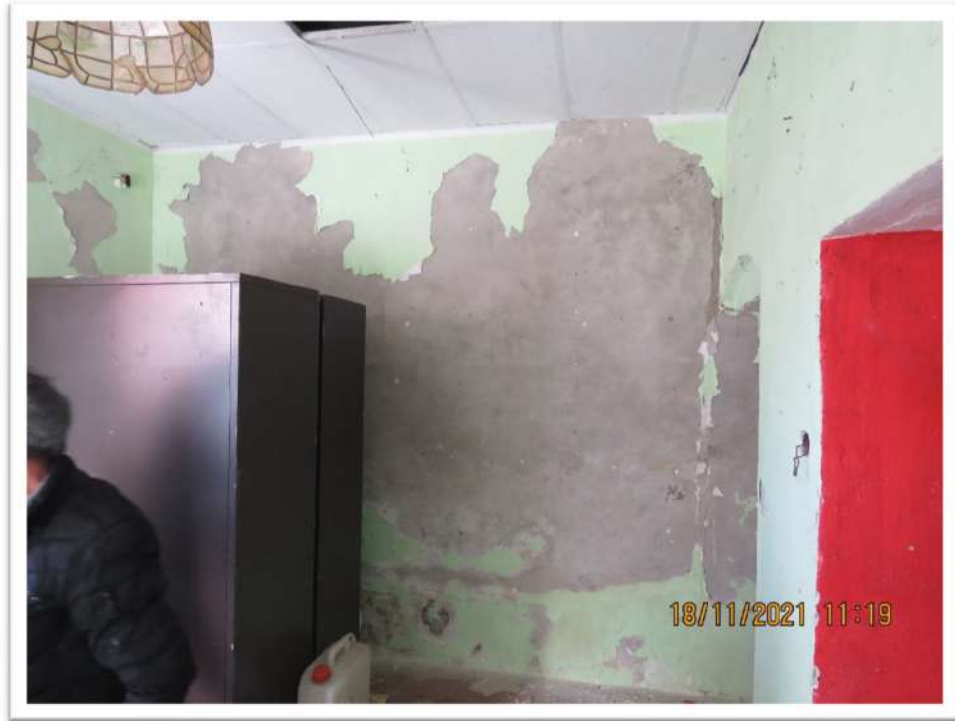
Viste interne del Sub. 705 del Mappale 159 (piano Terreno) e, sotto, del primo piano – Sub. 102 – del fabbricato.