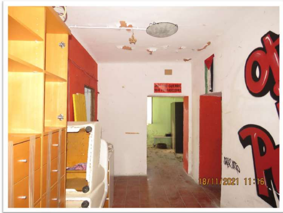
Viste interne del Sub. 705 del Mappale 159 (piano Terreno).