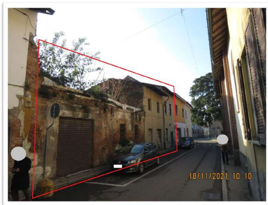
Vista dei beni da via Gorizia

NERVIANO (MI) – via Gorizia, 8 – Località “Garbatola” LOTTO n. 1