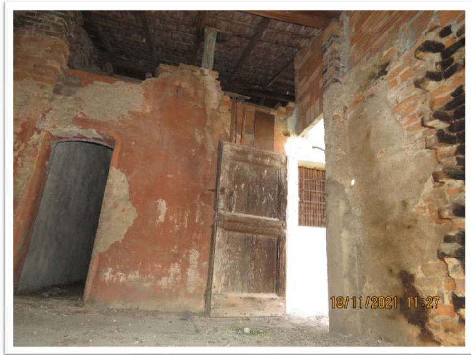
Viste interne del Sub. 102 del Mappale 159 (piano 1°)