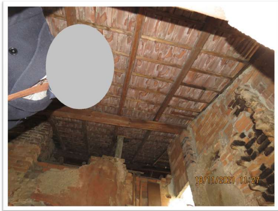
Viste interna ed esterna del Sub. 102 del Mappale 159 (piano 1°)