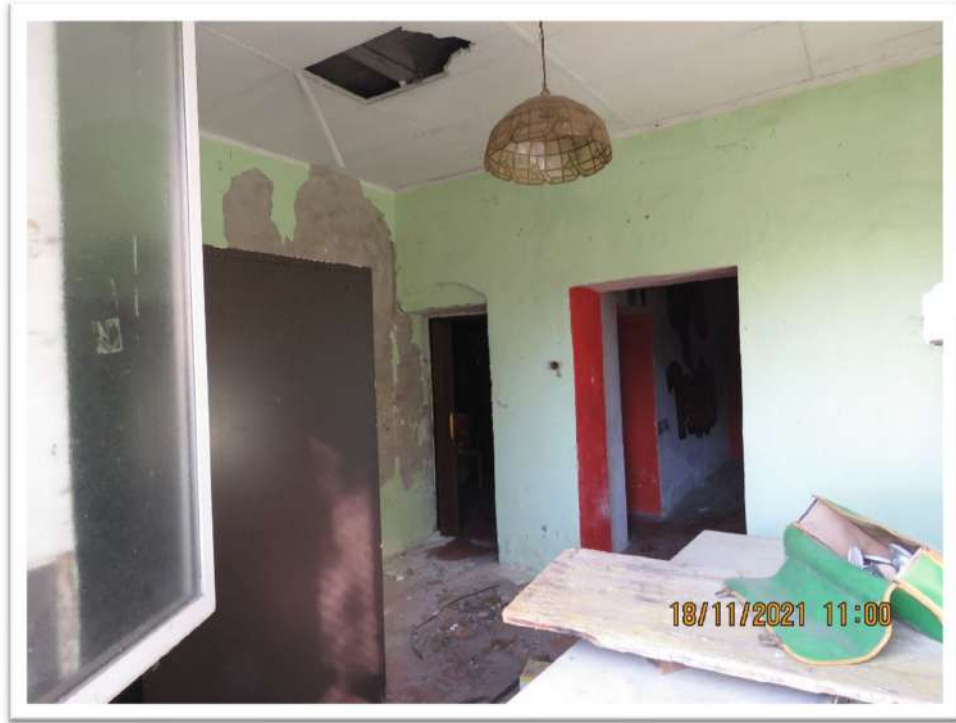
Viste interne del Sub. 705 del Mappale 159 (piano Terreno).