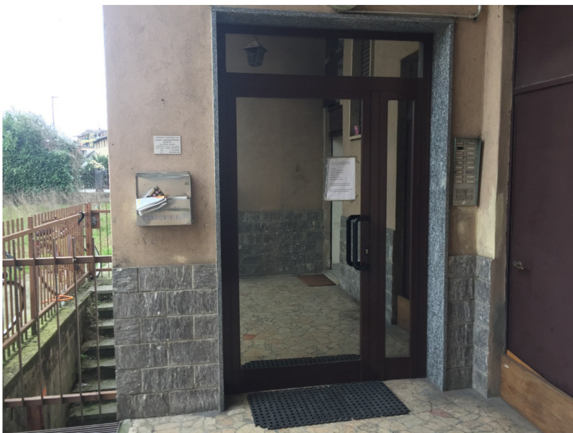
Foto 06 - Accesso al fabbricato