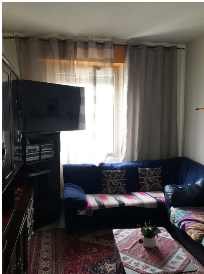
Foto 11 - Soggiorno