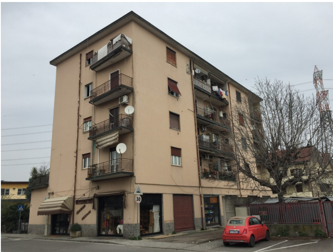
Foto 02 - Il fabbricato su via Primo Maggio