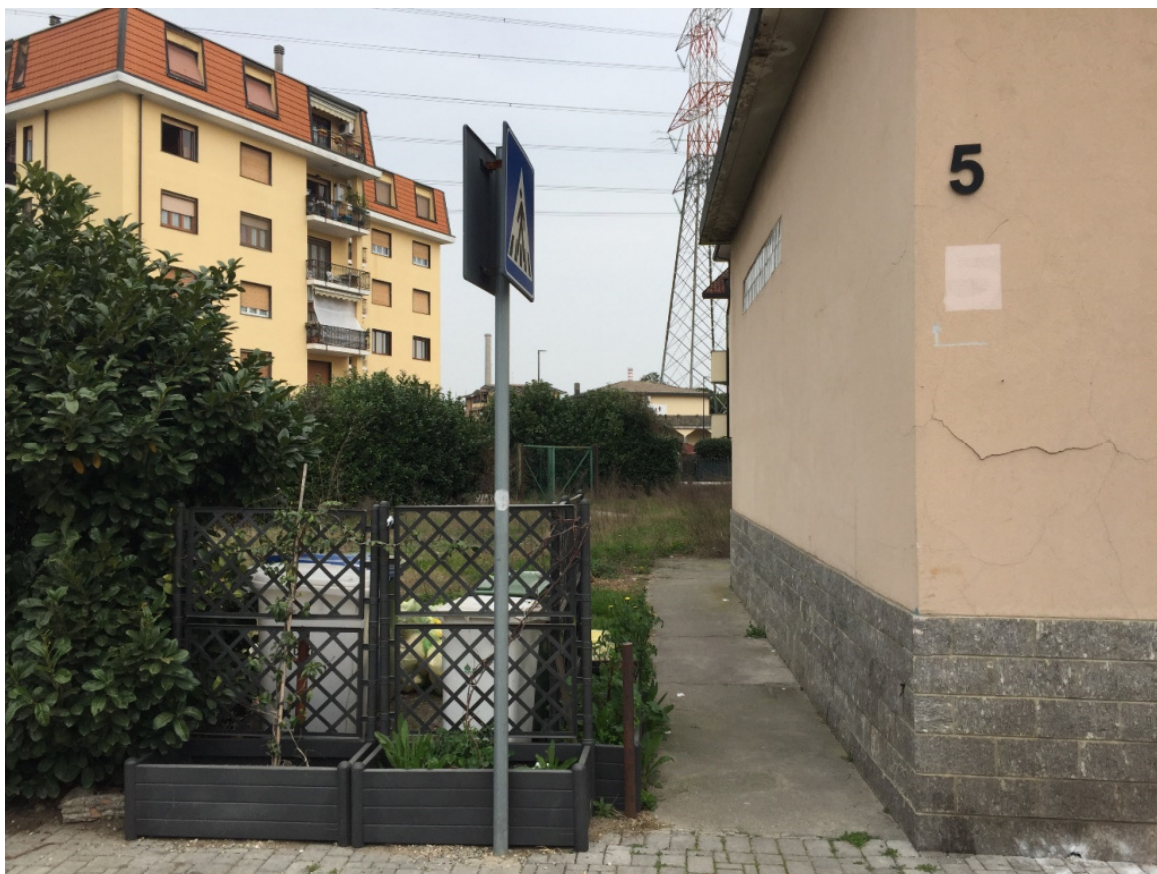
Foto 05 - Accesso al fabbricato dal civico 5 di via Primo Maggio