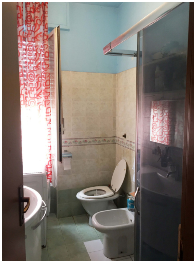
Foto 17 - Bagno