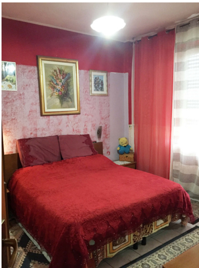
Foto 13 - Camera