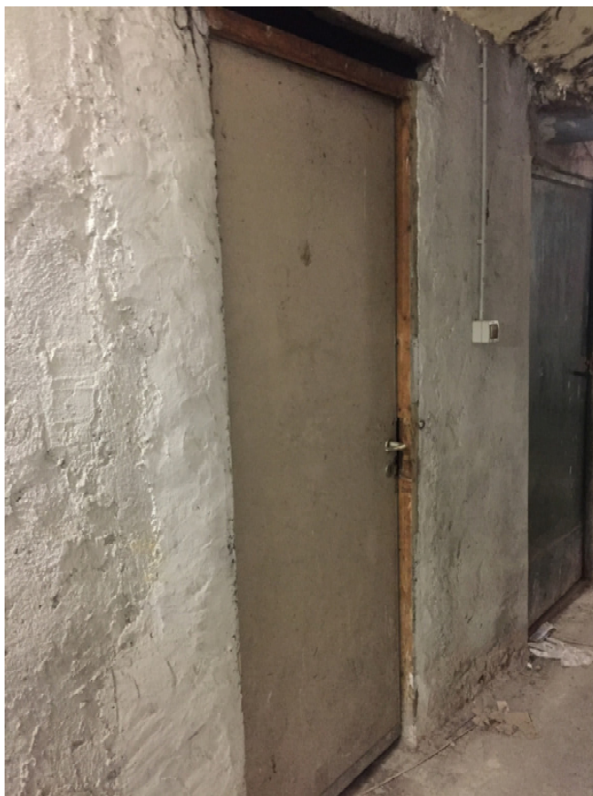
Foto 19 - Cantina