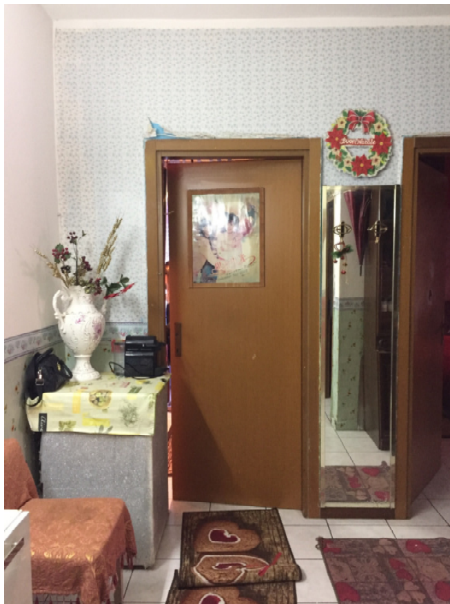
Foto 09 - Ingresso