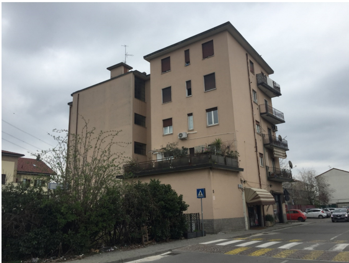
Foto 04 - Il fabbricato all'angolo tra via Primo Maggio e via Due Giugno