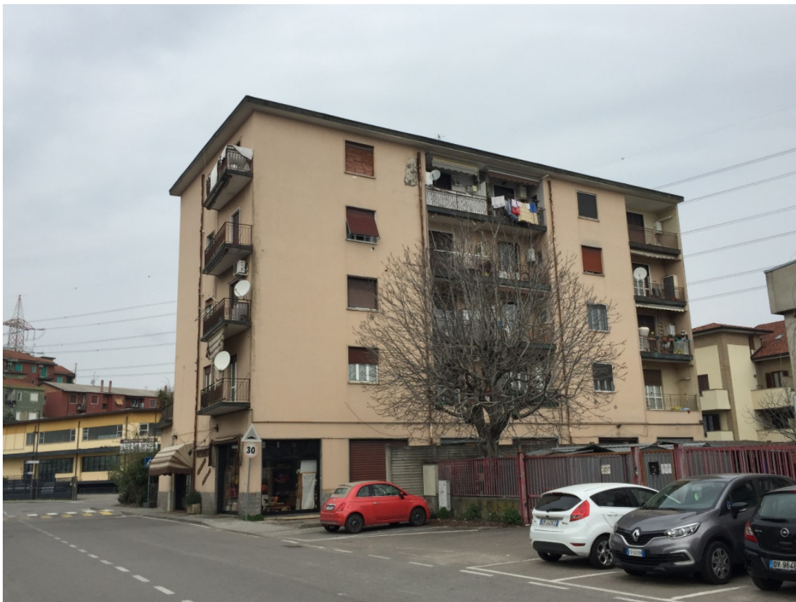
Foto 01 - Il fabbricato su via Primo Maggio