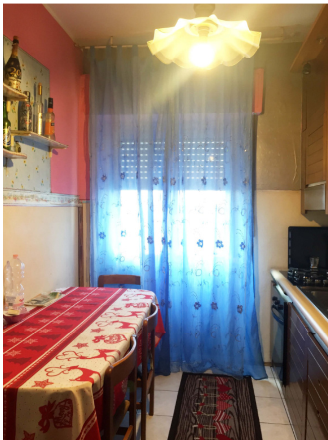
Foto 15 - Cucina