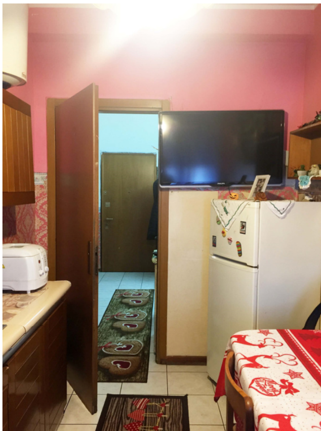
Foto 16 - Cucina