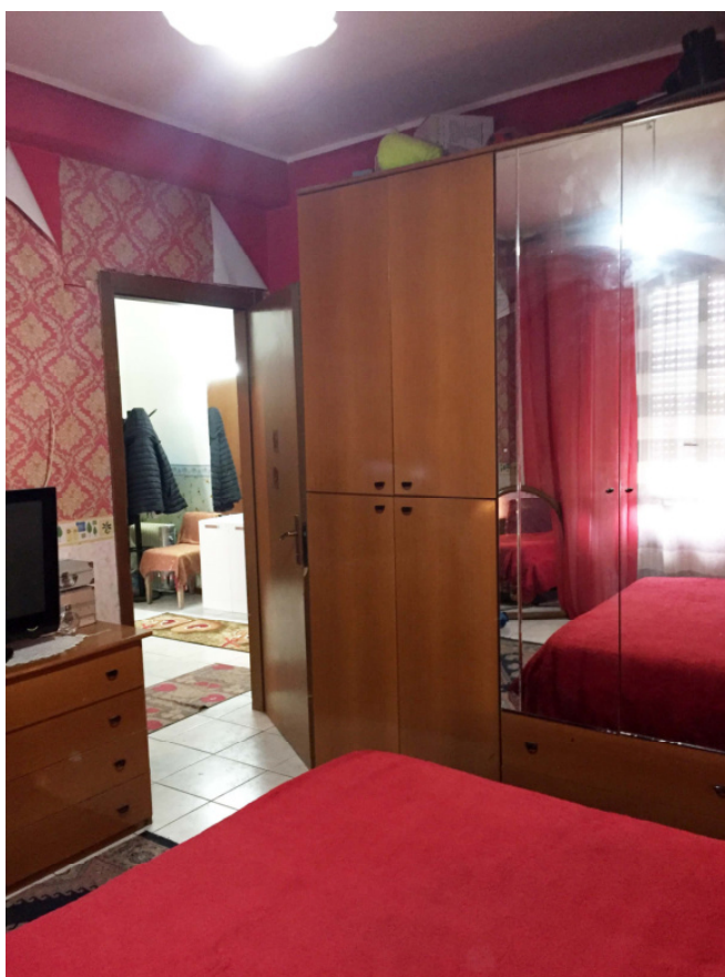
Foto 14 - Camera