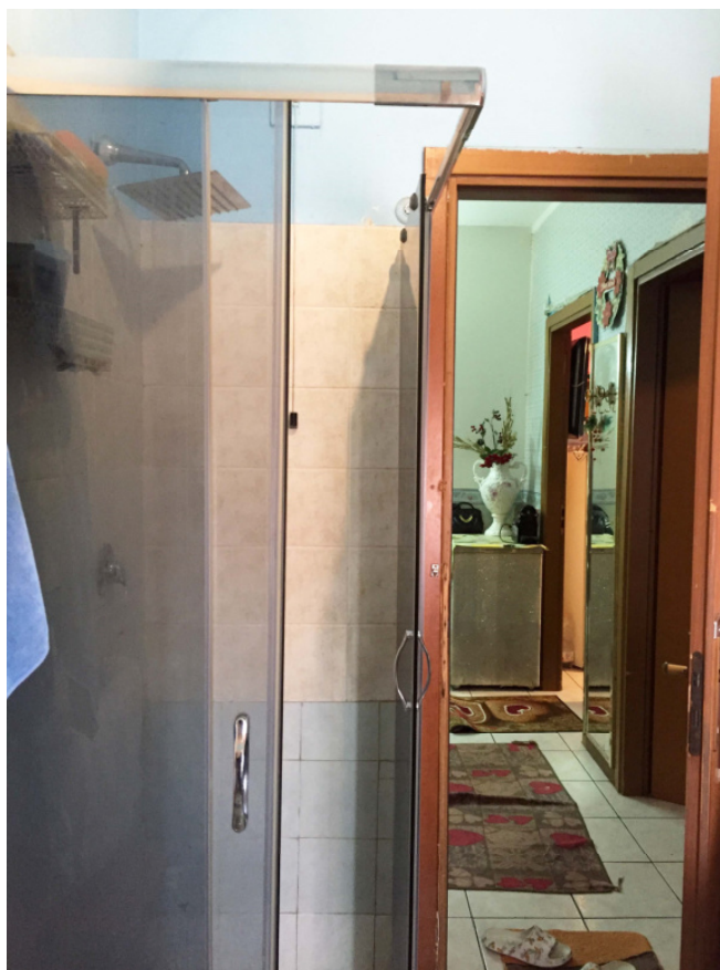
Foto 18 - Bagno