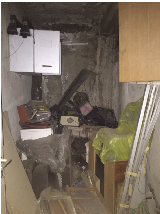
Foto 20 - Cantina