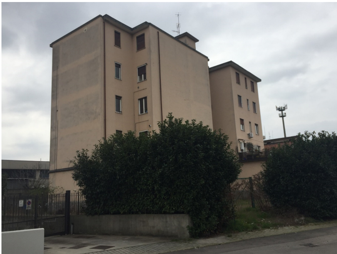
Foto 03 - Il fabbricato su via Due Giugno