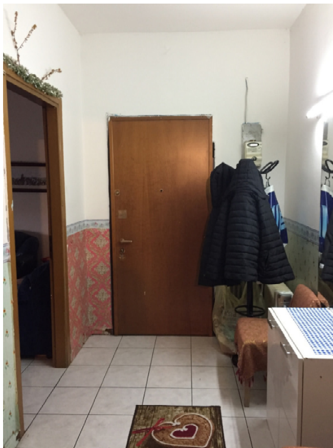
Foto 08 - Ingresso