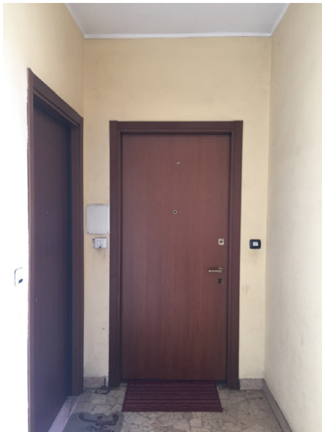
Foto 07 - Ingresso all'unità dal pianerottolo