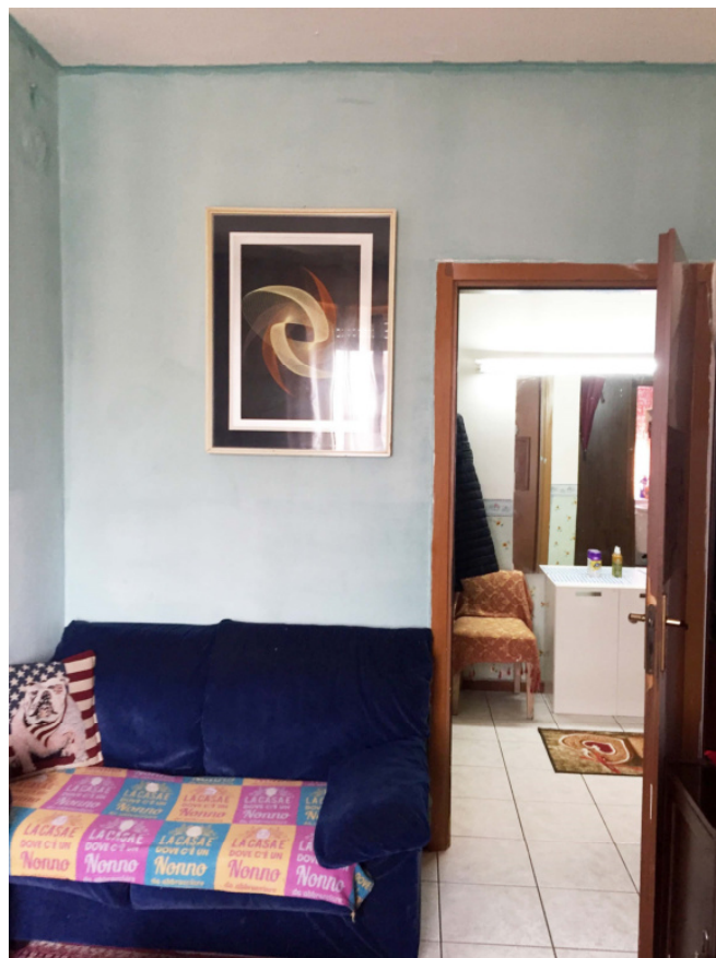
Foto 12 - Soggiorno