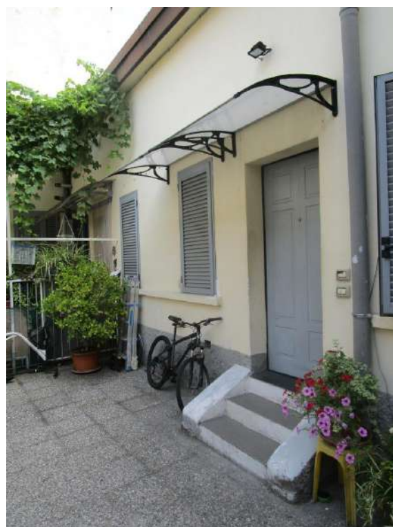
Foto 4/5 – Vista del cortile di proprietà e ingresso all'appartamento