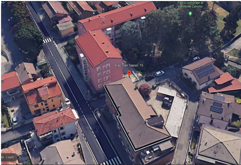
Foto 3 Vista della copertura e delle coperture confinanti