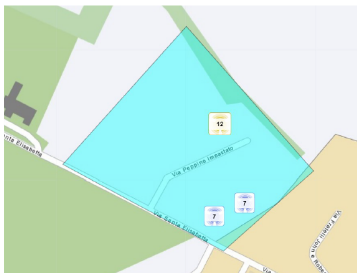
Agenzia delle Entrate. Area urbana oggetto di interrogazione

Saggio di variazione annuale del mercato immobiliare: -1,00%